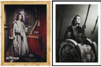
Francesco Vezzoli, Porträtt av H.K.H. Prinsessan av Hannover (före och efter Salvador Dalí) , 2009

Francesco Vezzoli har i den här diptyken dels fotograferat Caroline av Monaco i rollen som drottning Kristina av Sverige och dels i rollen som Greta Garbo när hon spelar drottning Kristina i en film från 1933. Drottning Kristina själv valde bort den roll hon föddes in i. Hon flyttade till Italien och konverterade till katolicismen. Det är inte för mycket sagt att Vezzolis verk handlar om rollspel, på många olika nivåer.