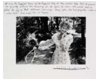
Duane Michals, Det var den lyckligaste timmen av den lyckligaste dagen i hela hennes liv , 1978

A white woman dressed in white, helping black people in Africa, like a latter-day Florence Nightingale. Vibeke Tandberg's work, which challenges various prejudices, is a photomontage, with her own face inserted in documentary photos from Africa.