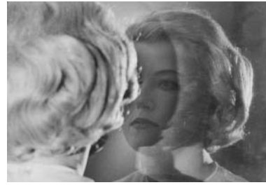
Cindy Sherman, Untitled Film Still #56 , 1980

In this diptych, Francesco Vezzoli portrays Caroline of Monaco as Queen Christina of Sweden, and as Greta Garbo in the role of Queen Christina in a movie from 1933. Queen Christina herself abdicated from the position she was born to, emigrated to Italy and converted to Catholicism. It is hardly an exaggeration to say that Vezzoli's work is about role play on many different levels.