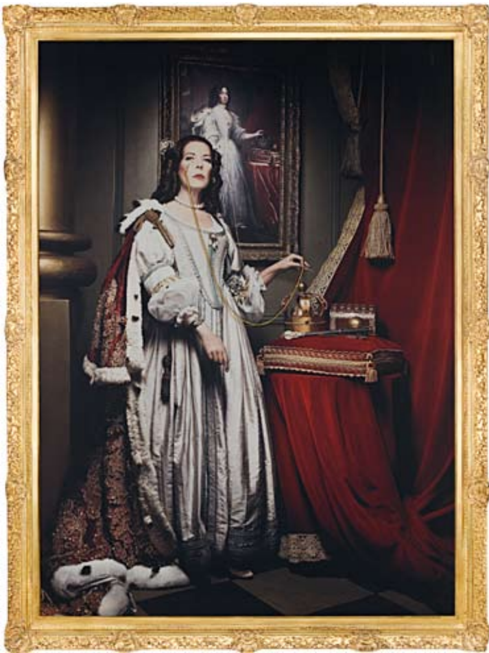
Francesco Vezzoli, Porträtt av H.K.H. Prinsessan av Hannover (före och efter Salvador Dalí) , 2009

Francesco Vezzoli har dels fotograferat prinsessan Caroline av Monaco i rollen som Drottning Kristina av Sverige och dels som Greta Garbo när hon spelar Drottning Kristina i en film från 1933. Färgfotografiet är utskrivet på väv och har en tung, utsirad ram, som för att förstärka kopplingen till måleri. Det svart-vita fotografiet har en slät yta istället en smal svart ram, som för att tydliggöra att det är hämtat från filmens värld. Kristina själv valde bort den roll som hon hade fötts in i, lämnade Sverige och konverterade till katolicismen. Vezzolis verk handlar om rollspel, på flera olika nivåer.