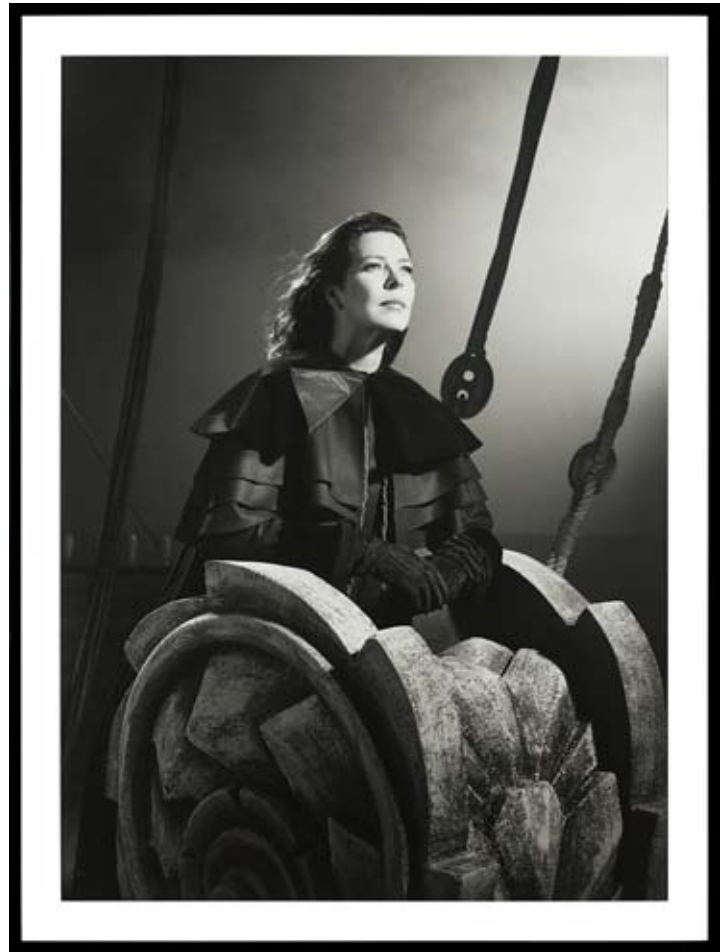
Francesco Vezzoli, Portrait of H.R.H. the Princess of Hanover (Before & After Salvador Dalí) , 2009

Francesco Vezzoli har dels fotograferat prinsessan Caroline av Monaco i rollen som Drottning Kristina av Sverige och dels som Greta Garbo när hon spelar Drottning Kristina i en film från 1933. Färgfotografiet är utskrivet på väv och har en tung, utsirad ram, som för att förstärka kopplingen till måleri. Det svart-vita fotografiet har en slät yta istället en smal svart ram, som för att tydliggöra att det är hämtat från filmens värld. Kristina själv valde bort den roll som hon hade fötts in i, lämnade Sverige och konverterade till katolicismen. Vezzolis verk handlar om rollspel, på flera olika nivåer.