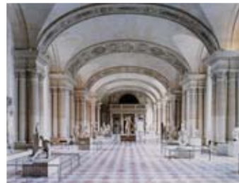
Candida Höfer, Louvren i Paris X 2005 – karyatidsalen, 2005

The sea meets the sky at the horizon. That's the way it is and always has been. In his Seascapes the Japanese photographer Hiroshi Sugimoto seeks to capture a view as it may have appeared to the first humans, at the dawn of time. The camera shutter was open for a long time, and the seconds that passed are stored in the picture, which thus portrays time on several levels.