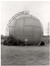
Bernd och Hilla Becher, Gasklocka, Essen-Karnaps kraftverk, Ruhrområdet, 1973/75

Bernd och Hilla Becher fotograferade en mängd byggnader och miljöer för att dokumentera det industrilandskap som höll på att förändras och moderniseras. Bilderna är oftast tagna rakt framför motivet och inga människor syns till. Deras sätt att arbeta blev enormt inflytelserikt. Om du ser dig omkring ser du storskaliga exempel på distanserade, folktomma fotografier, flera av dem tagna av elever till makarna Becher.