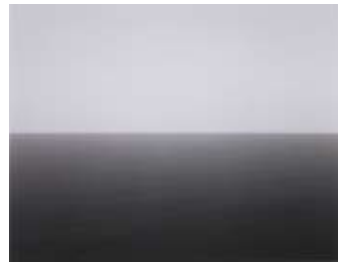
Hiroshi Sugimoto, Gula Havet, Cheju 1992, 1992

Nine photos of children. What do they have in common? They are portrayed frontally, like in passport photos. They seem to be about the same age, we can't see what they are wearing. And they all have a scar on their throats. These children have had surgery for thyroid cancer. They grew up near Chernobyl and were exposed to radiation after the nuclear disaster. Sometimes one wishes things weren't true.