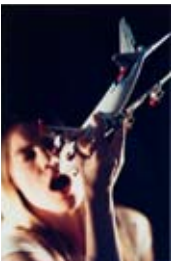
Annika von Hausswolff, I am the runway of your thoughts , 2008

A Swedish summer's day on the field. This could be a picture from any family album, if it weren't for the fact that the people have been edited out, giving the photo a ghostlike atmosphere. Who are the people in the picture, and where are they now? Are they forgotten, or were they intentionally erased from memory? It is easy to imagine your own family or friends in place of the black silhouettes.