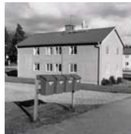
Gerry Johansson, Hagfors 2001 , ur serien Sverige , 2001/2005

The pictures in the series Le troisième angle (The Third Angle) are an intimate portrayal of the photographer's own body. A sheet of rice paper is attached below each photo, with a few words written by Klasson in French or Swedish. The words are linked to the composition of the photo, leading our gaze or thoughts in various directions. These images are to be perceived with the entire body.