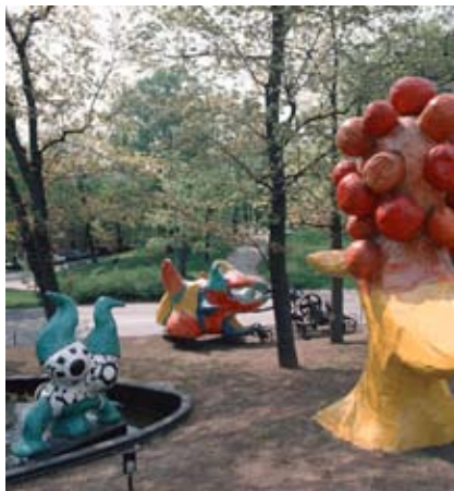
Paradiset av Niki de St Phalle och Jean Tinguely 1966

Fråga någon av värdarna på museet var de finns om du inte hittar dem.