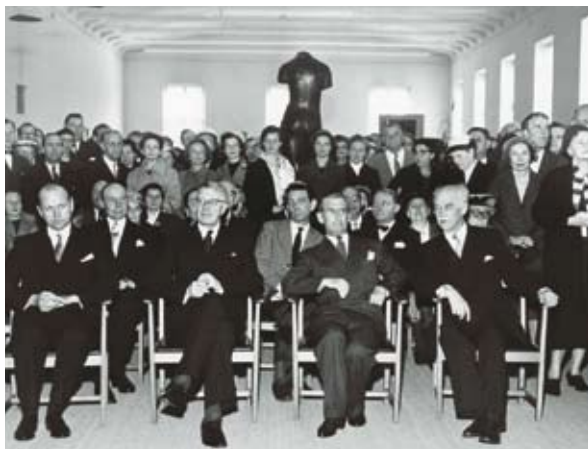
Invigning av museet 1958.

Det är denna byggnad som är Moderna Museet idag.