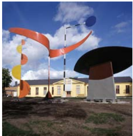
De fyra elementen av Alexander Calder 1961