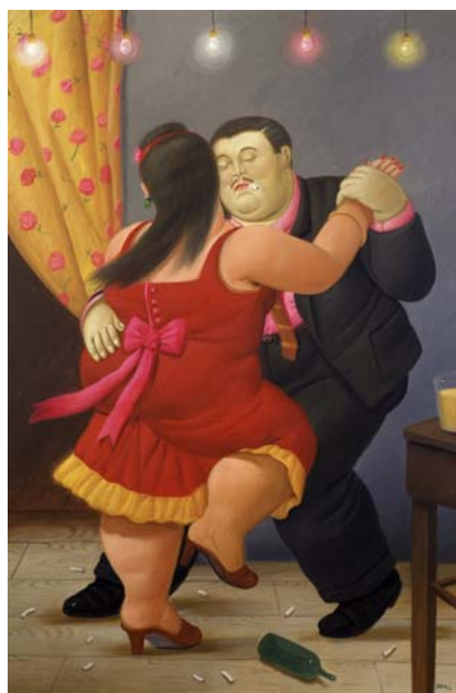
Fernando Botero Bailarines 2000

Sammanlagt har 178 föremål lånats ut under året. Lånen har fördelat sig som följer: Utland till 27 platser med 52 verk, övriga Sverige till 29 platser med 93 verk samt Stockholm till 11 platser med 33 verk. Därutöver har ett antal ytterligare verk lånats ut till de utställningar som Internationella projektet administrerar. Nämnas kan också att 38 låntagare fått avslag för 52 föremål.