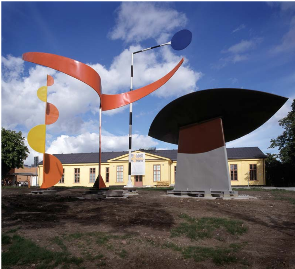
Återinvigning av Alexander Calders De fyra Elementen 22 september 2001

Museet har sju magasin för fem olika material-kategorier. Under 2001 har betydande problem med museibygnaden framkommit. Problemen har varit av arten förhöjd fuktighet i byggnaden samt andra felaktigheter av teknisk natur. Hösten 2001 har till stor del gått åt till att reda ut hur framtiden i huset skall se ut. Efter att ha gått igenom olika scenarier har det slutligen beslutats att lämna huset under ca två år. Det har visat sig att enda möjligheten att komma till rätta med de problem som faktiskt existerar i huset kräver att museet är tomt.