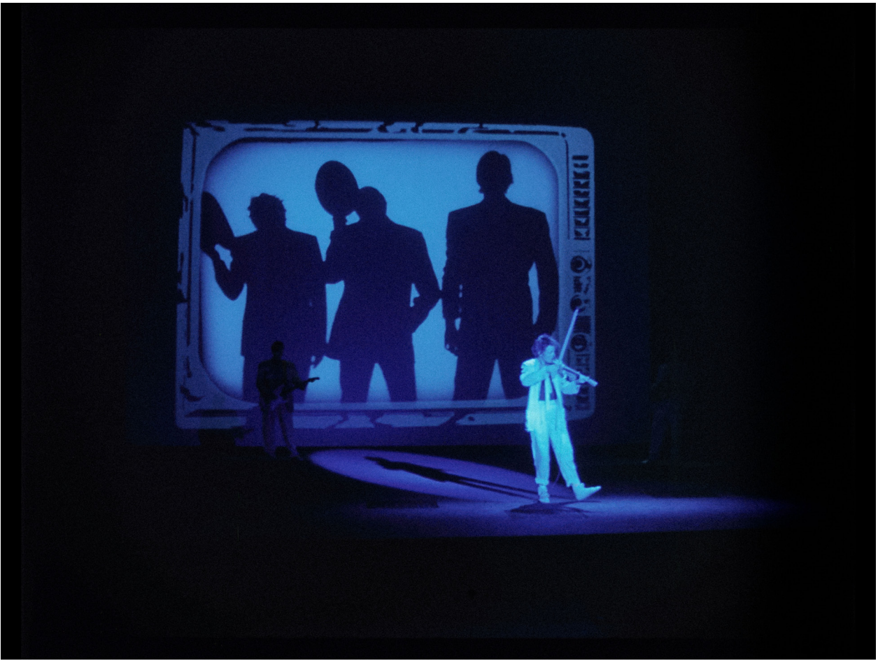
Home of the Brave, 1986 (stillbild ur film/film still)