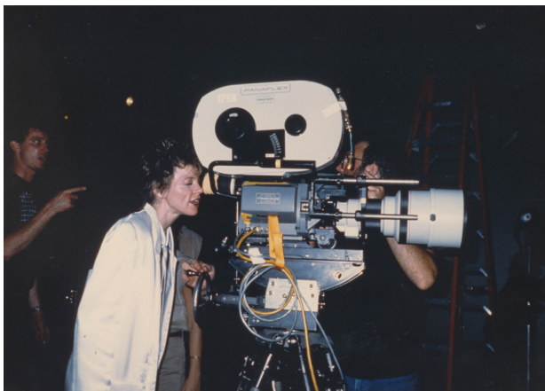
Från inspelningen av/Directing the shoot, "Home of the Brave", 1985