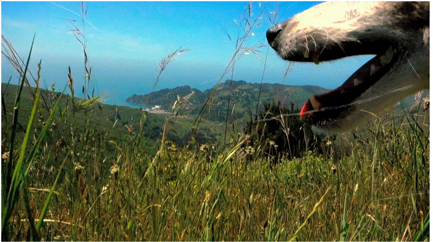
Heart of a Dog, 2015 (stillbild ur film/film still)