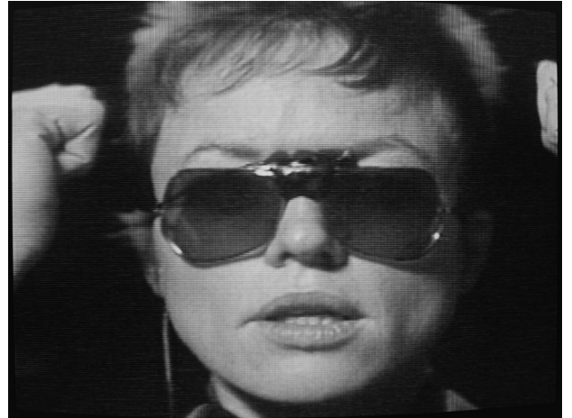
Drum Glasses, 1979