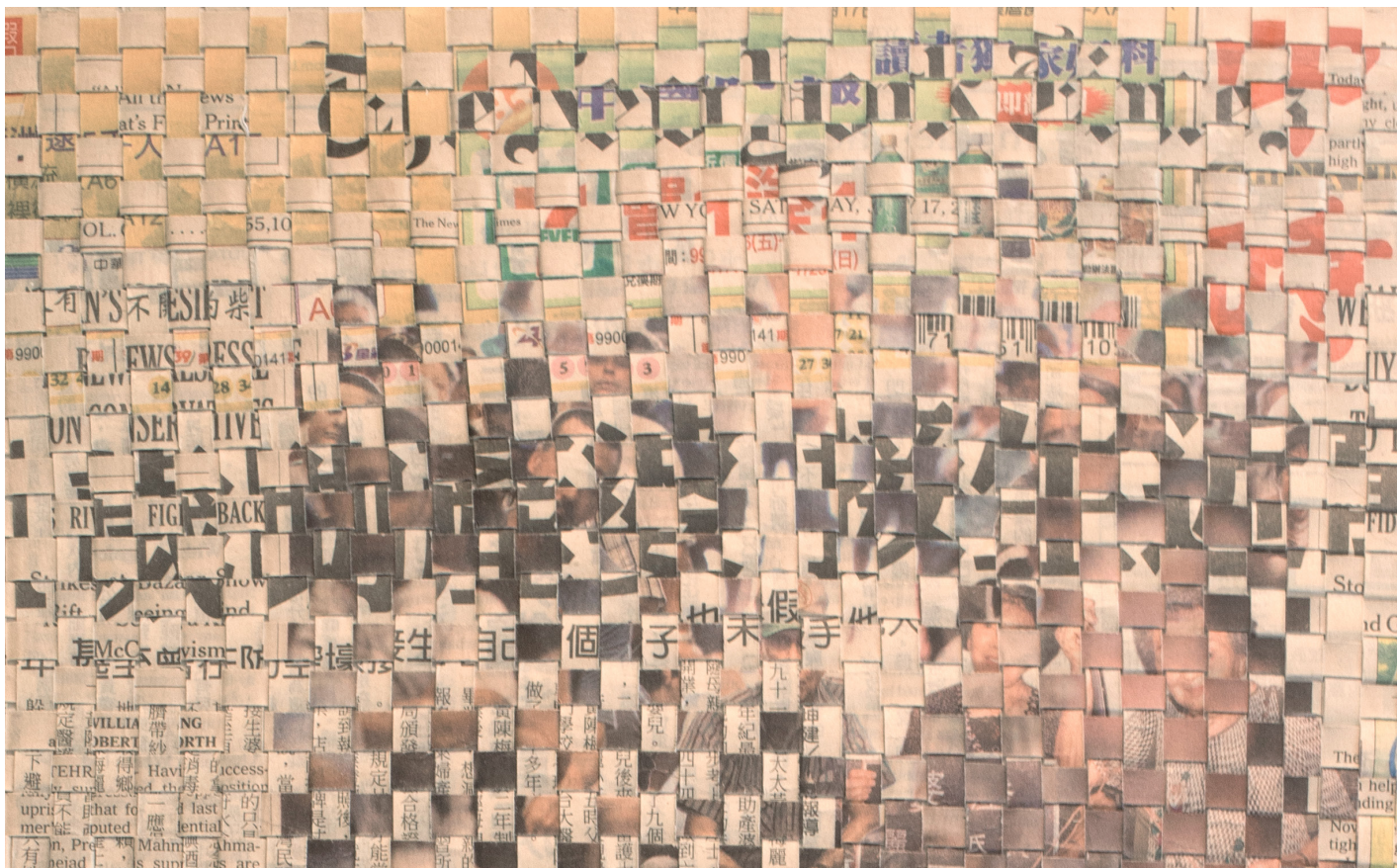
New York Times Horizontal/China Times Vertical, 1971 (detailj/detail)