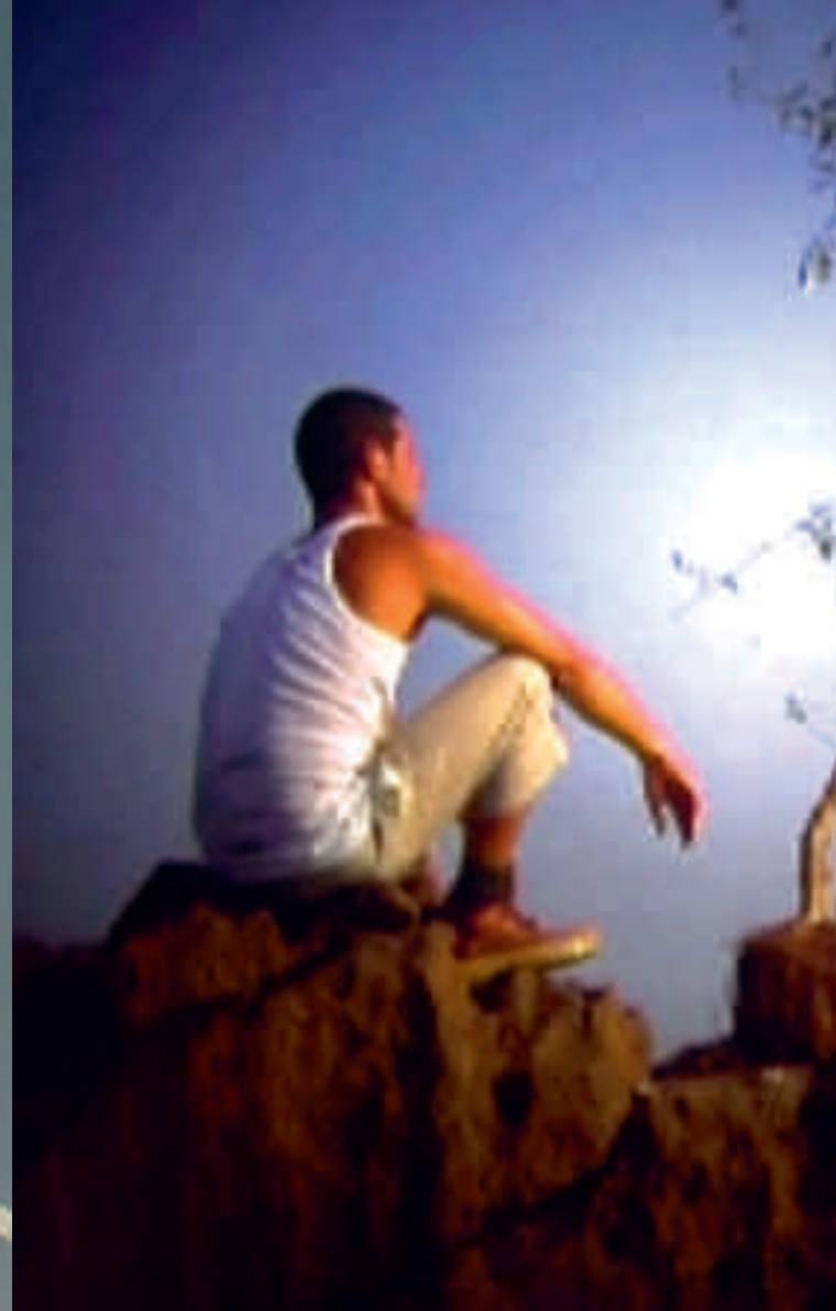
Yael Bartana A Declaration , 2006 One channel video and sound installation 7'30"