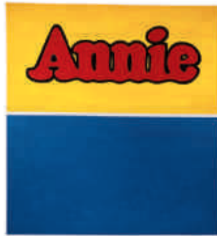
Ed Ruscha, Annie , 1962. Olja och blyerts på duk. Privat ägo. Foto: Paul Ruscha © Ed Ruscha 2010

Mot slutet av 1960-talet upphör Ed Ruscha att måla under knappt två år. ”There were no messages there”, kommenterade