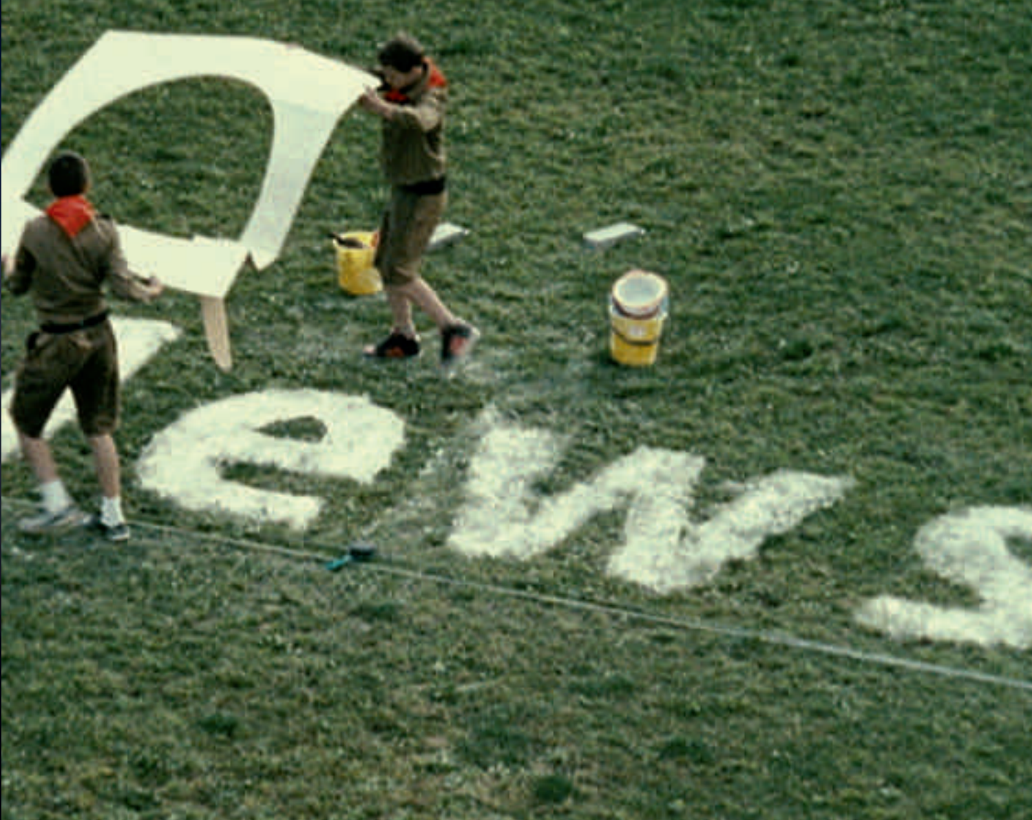
Yael Bartana, Mary Koszmary , 2007. En-kanals super 16mm film överförd till video, 10:50 min.