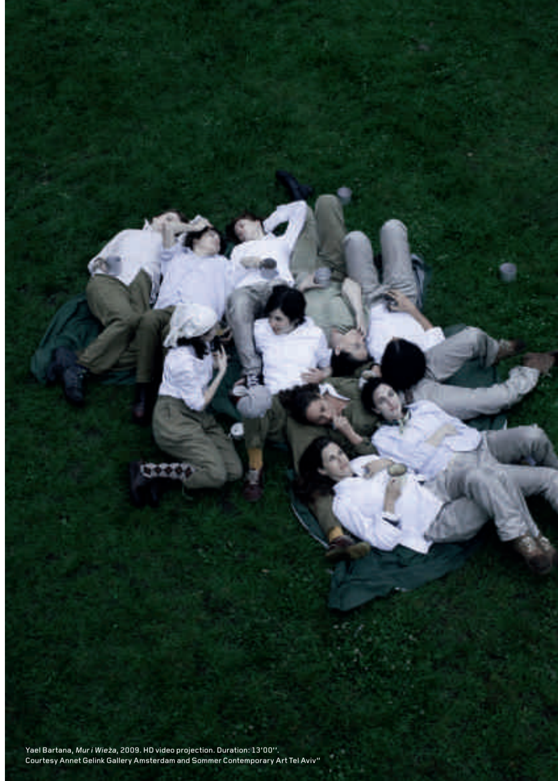
Yael Bartana, Mur i Wieża , 2009. HD video projection. Duration: 13'00".