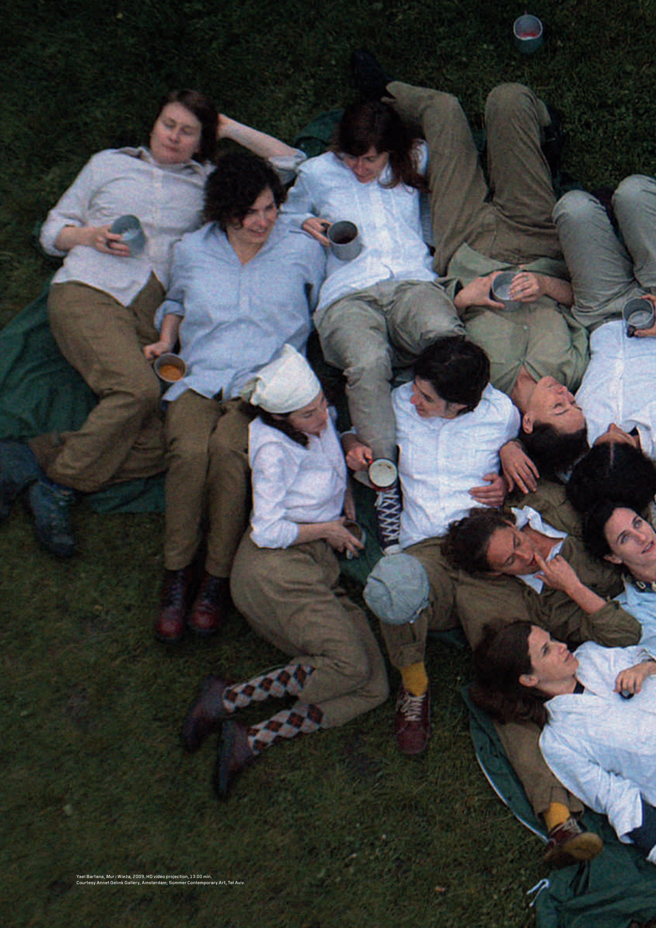
Yael Bartana, Muri Wieża , 2009. HD video projection, 13:00 min. Courtesy Annet Gelink Gallery, Amsterdam; Sommer Contemporary Art, Tel Aviv.