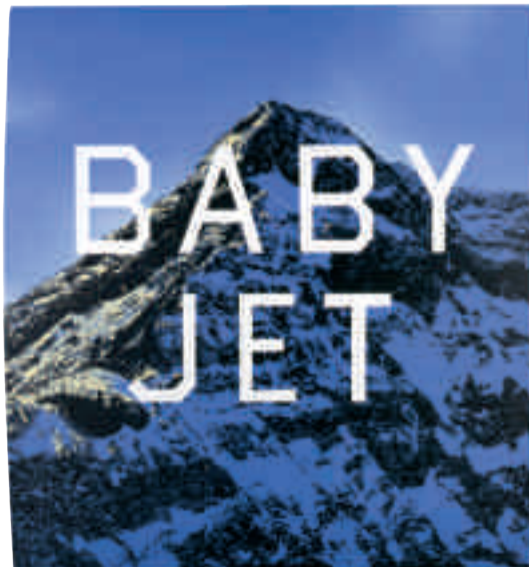
Ed Ruscha, Baby Jet, 1998. Akryl på formad duk. Konstnärns ägo.

Dröm, hägring, illusion, bilden av bilden. Ed Ruscha har själv sagt sig vara en abstrakt målare som använder sig av realistiska motiv. Betydelseförskjutningarna ligger lager om lager vilket gör det till ett visuellt och konceptuellt äventyr att ge sig hän åt hans bildvärld. Baby Jet (1998) är en liten målning på duk som i verkligheten buktar något, som om den sväller av sitt mäktiga innamäte. Hur många bergstopp har vi inte sett och hur många Toblerone har vi inte ätit? Målningen av bilden av vykortet av berget vi aldrig besteg – här uppstår svindel. Och så, i Ed Ruschas typiska typsnitt, BABY JET , som stansat över ytan, framom berget – släp in your face! ”Baby”, vi kan höra ordet eka från den hollywoodska drömfabriken, och sedan, ”jet”, med dess associationer till teknisk framgång, men kanhända även, en annalkande undergång i askmolnets efterföljd. JET – yet, redan. □