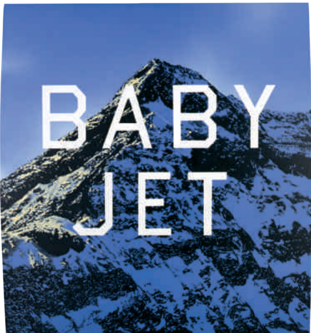
Ed Ruscha, Baby Jet , 1998 © Ed Ruscha.