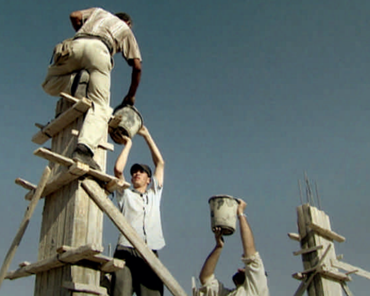
Yael Bartana, Summer Camp , 2007. Två-kanals video och ljudinstallation, 12:00 min.