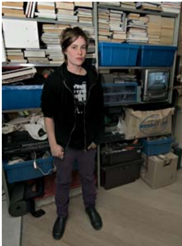
Klara Lidén framför installationen Unheimlich Manöver på Moderna Museet 2007. © Klara Lidén

Resultatet blev överväldigande. Hon byggde en konstruktion med titeln Unheimlich Manöver av alla sina ägodelar och