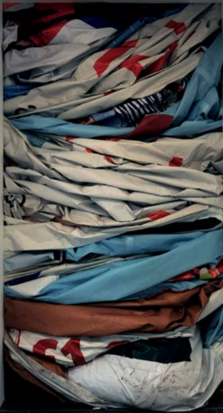
Klara Lidén, Toujours Être Ailleurs (Always To Be Elsewhere) , 2010, installation (Serpentine Gallery). © Klara Lidén