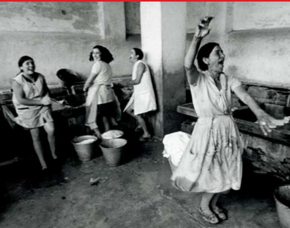
Georg Oddner, Tvätterskorna, Ubeda, 1970 . © Georg Oddner