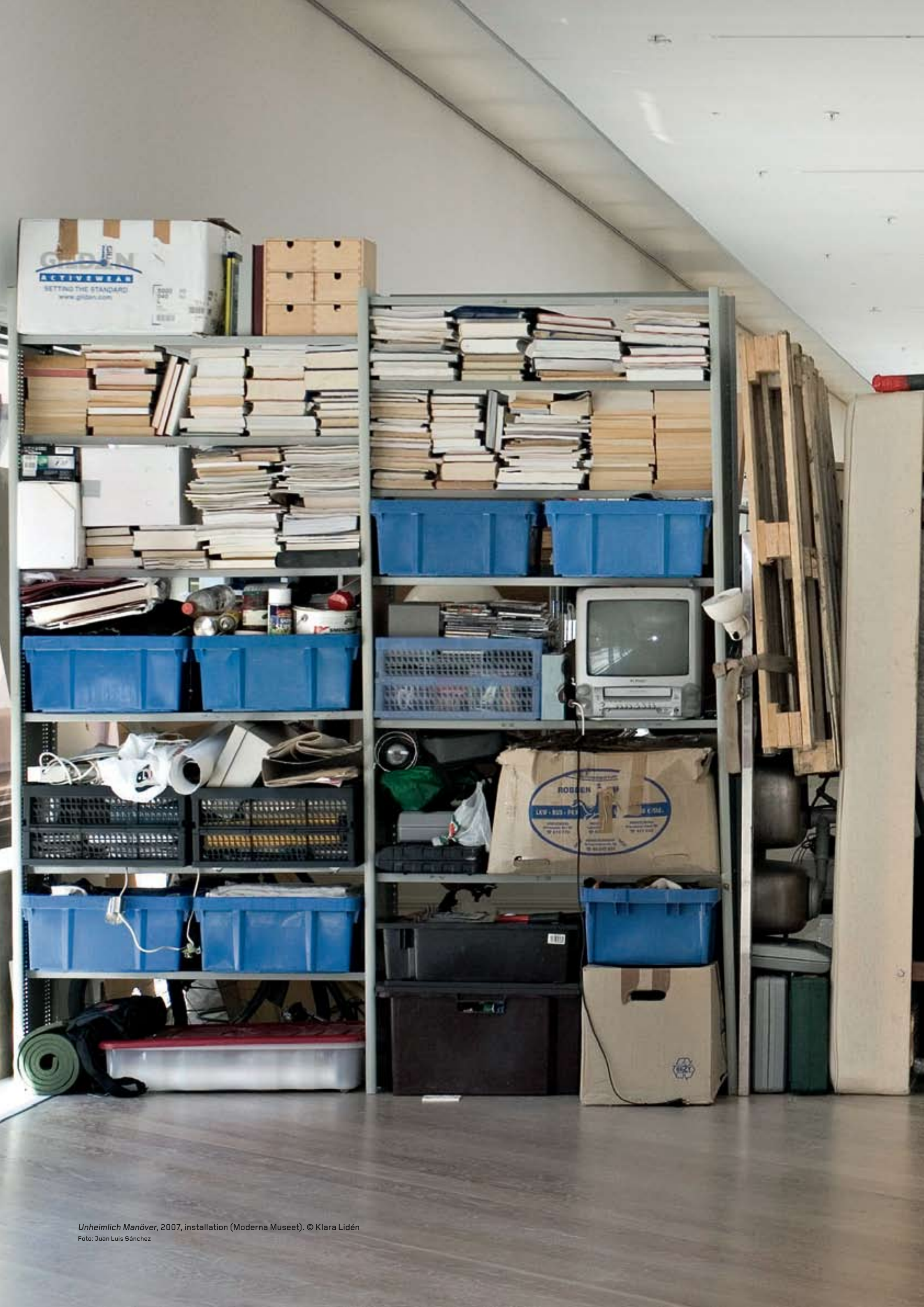
Unheimlich Manöver, 2007, installation (Moderna Museet). © Klara Lidén