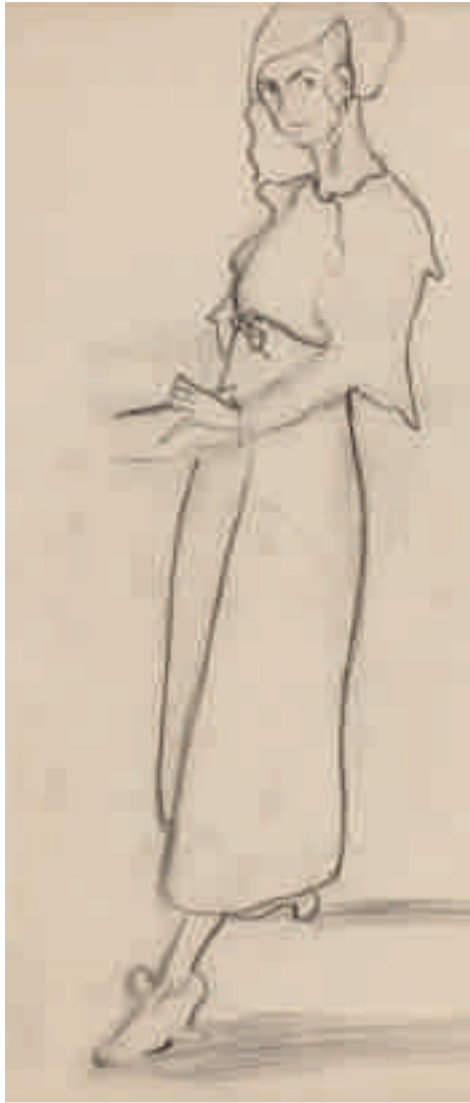
Siri Derkert, Självporträtt , ca 1910 Blyerts på papper. Privat ägo