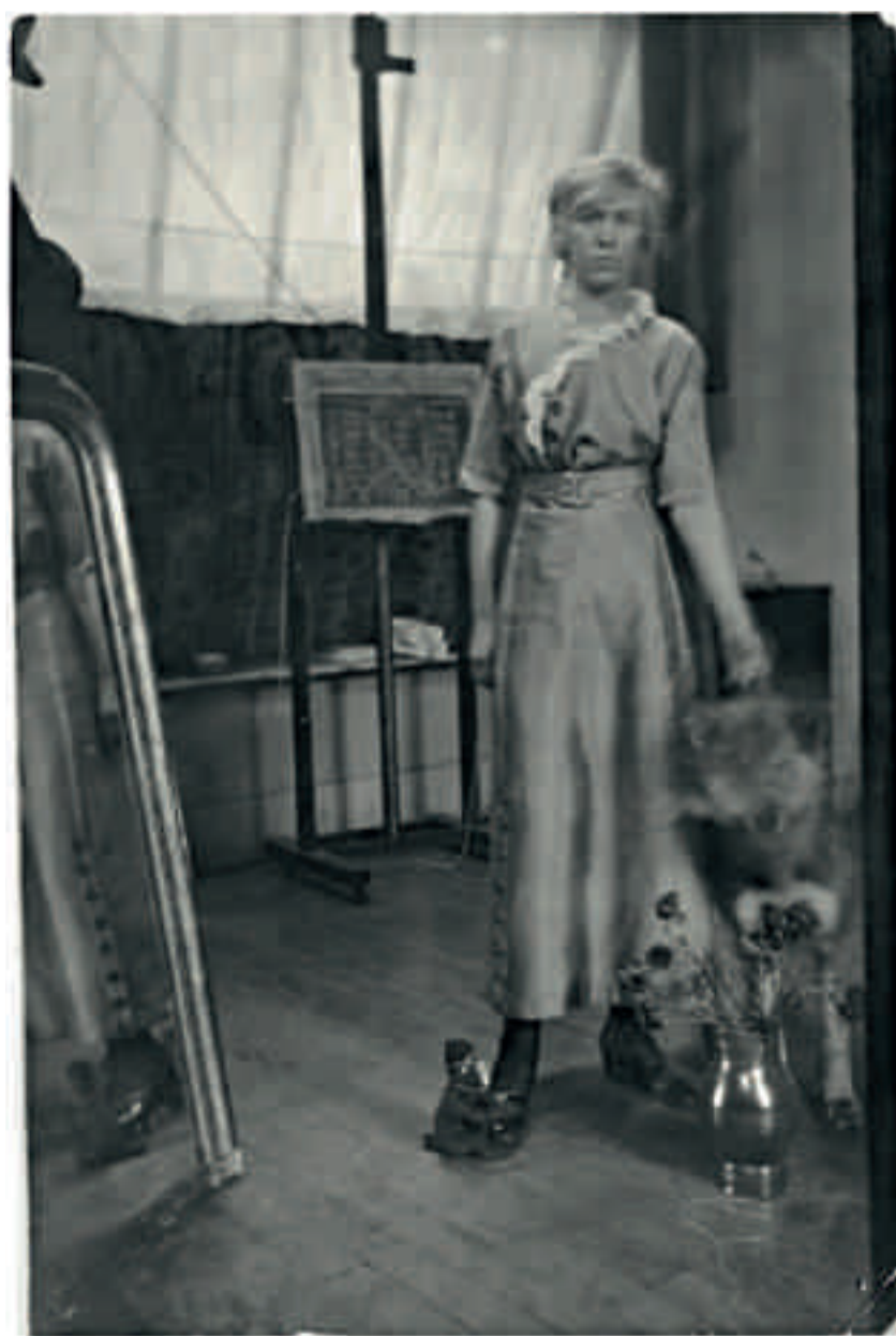
Siri Derkert i ateljén på 48 rue Vavin i Paris, ca 1910.

Siri Derkert intar en ovanlig men också självklar position i 1900-talets svenska konsthistoria. I lika hög grad har hon blivit lite av en myt eller ikon, vilket stundtals skymt blicken för verken och de egentliga ställningstagandena. Tiden är nu mogen att generöst presentera hela hennes konstnärskap tillsammans med nya analyser av detsamma.