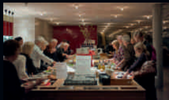
Vännernas timme i Restaurangen är alltid fryntligt fullsatt. Kom i tid!