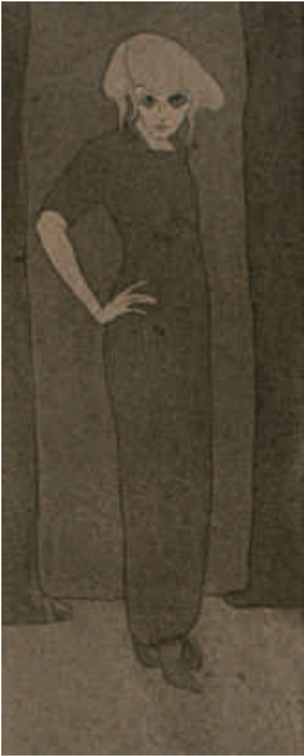
Siri Derkert, Självporträtt , 1911–12 Akvatint. Malmö Konstmuseum