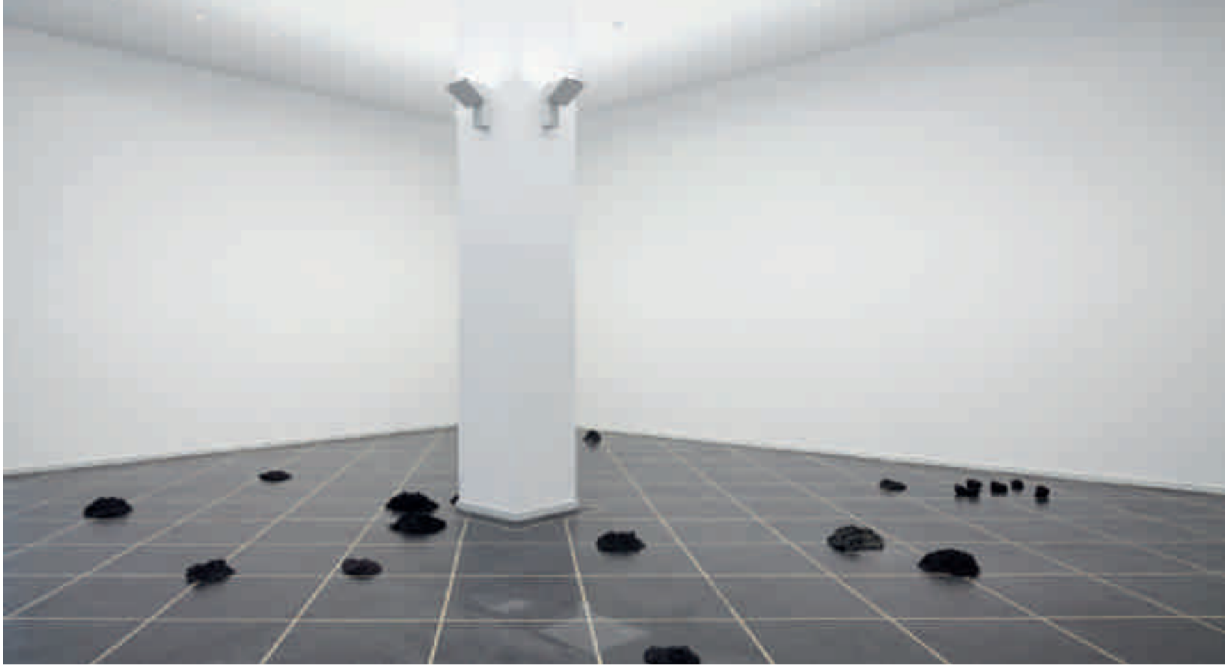
Andreas Eriksson, Sorkhögar , 2010, bronsavgjutningar.