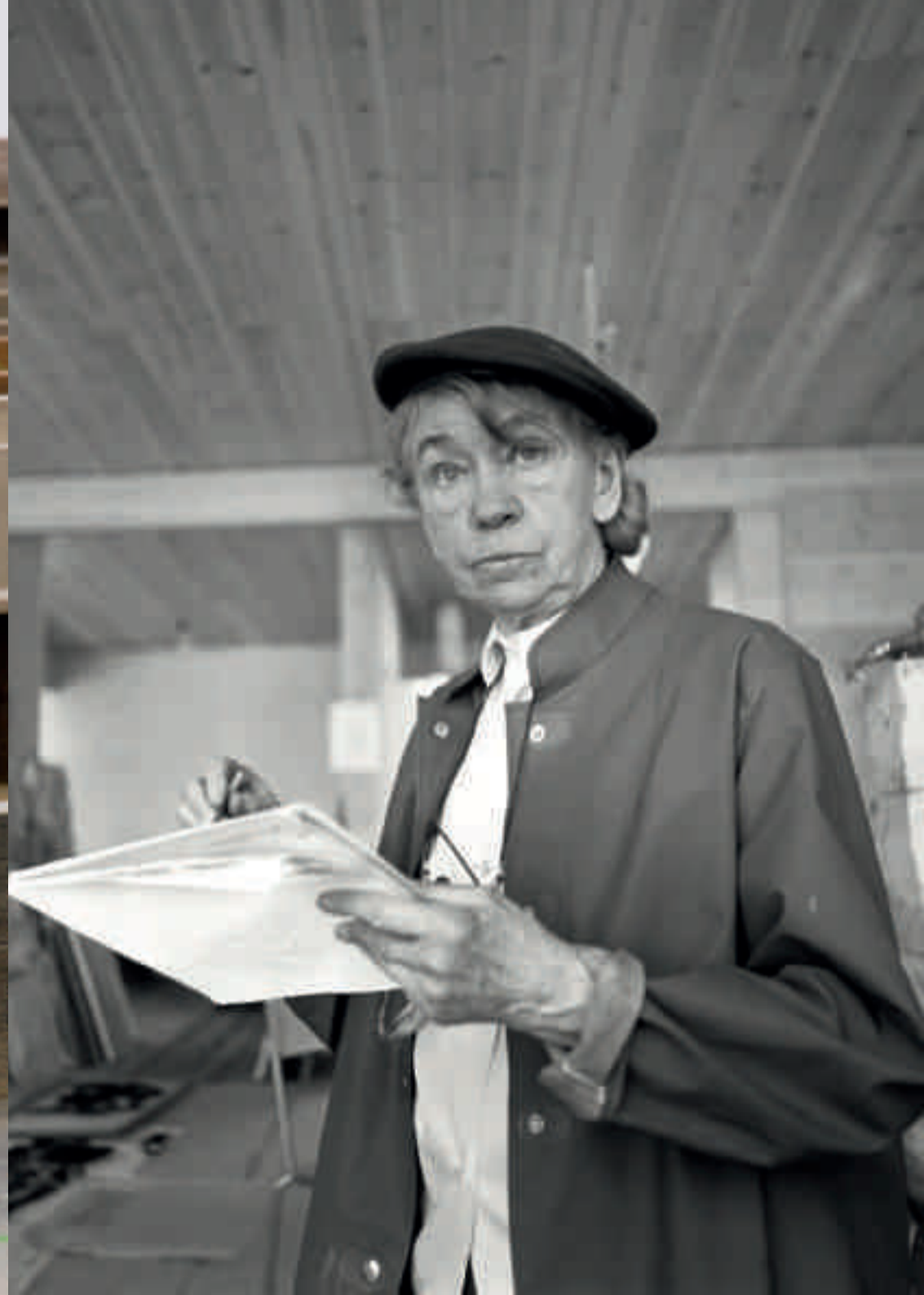
Siri Derkert i sin ateljé på Lidingö, 1968