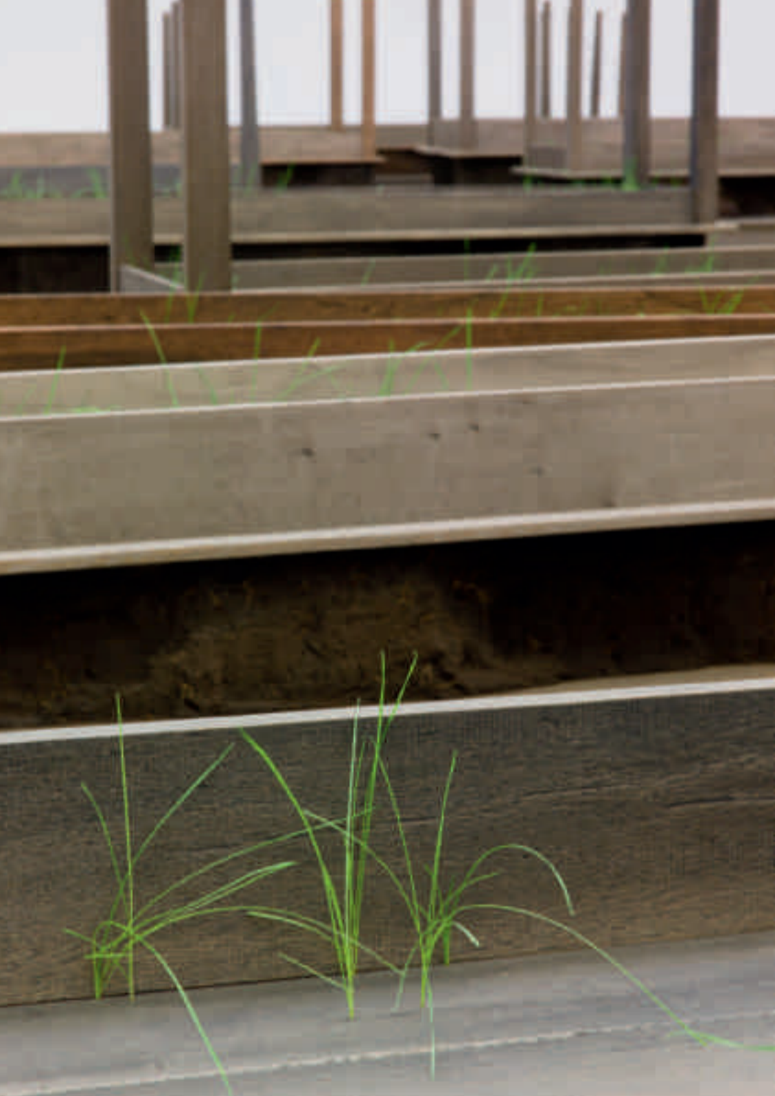
Doris Salcedo, Plegaria Muda , 2011. Installation