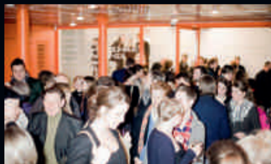
Tack vare Moderna Museet Malmö har medlemsantalet ökat med över 5% i Öresundsregionen. De speciella vänarrangemangen är mycket uppskattade och välbesökta.