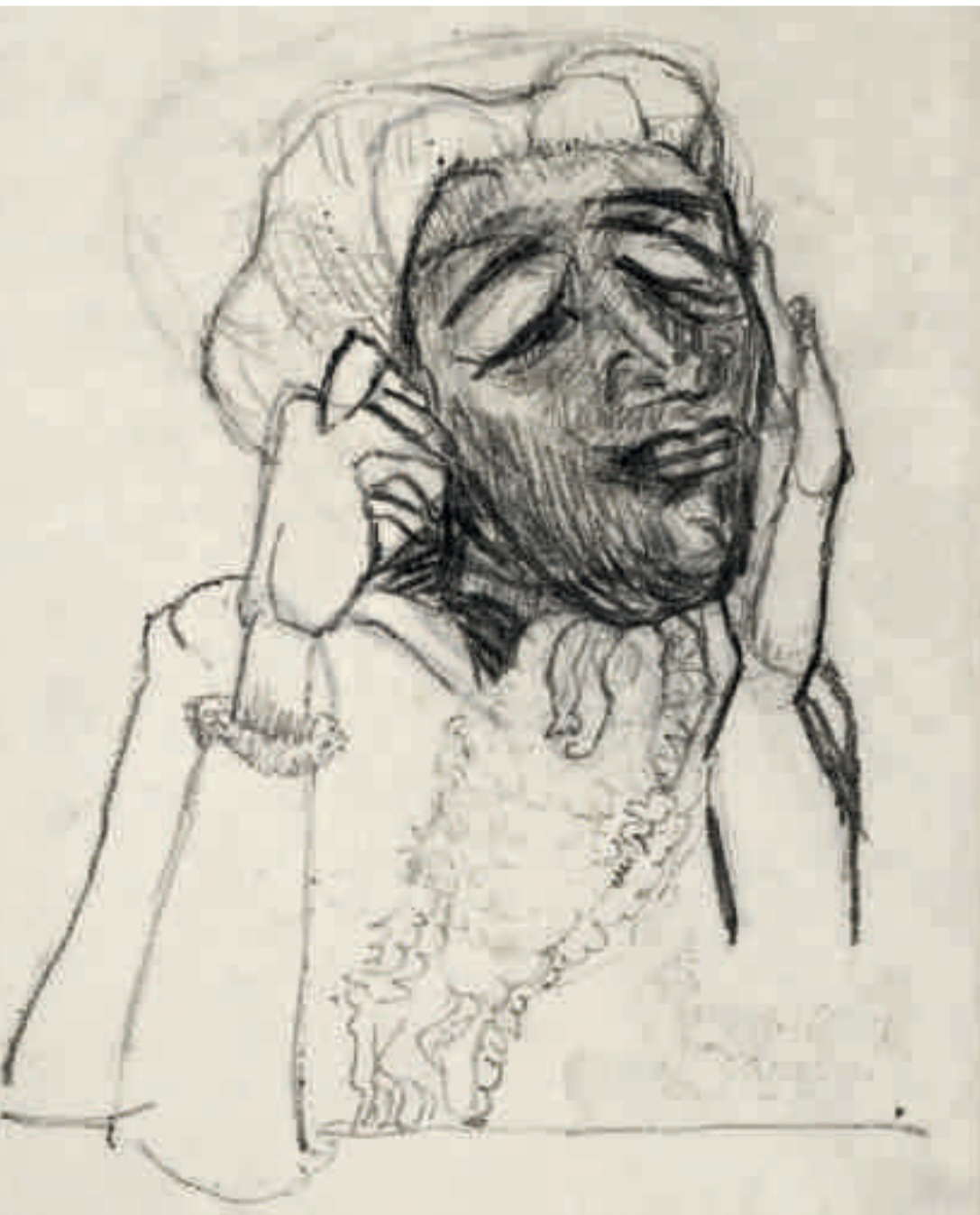
Siri Derkert, Kerstin Hesselgren , 1944. Kol på papper. Moderna Museet