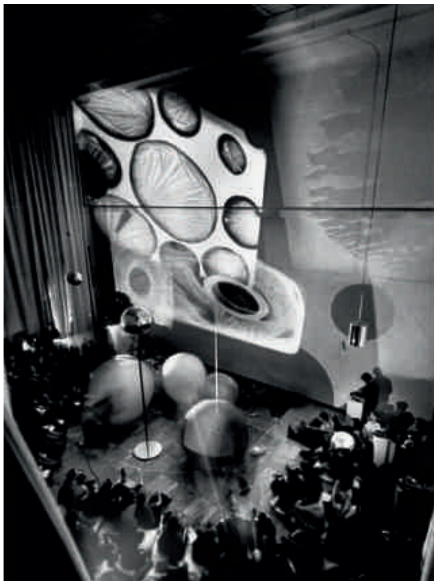
Vy från utställningen Proliferation of the sun av Otto Piene på Museum am Ostwall i Dortmund, 1967. Archiv Otto Piene/ZERO Foundation Foto: Walter Vogel

Catrin Lundqvist är intendent på Moderna Museet