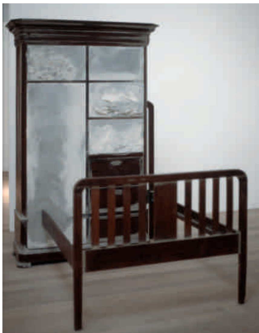
Doris Salcedo, Utan titel, 1997. Trä, cement, tyg. Moderna Museet