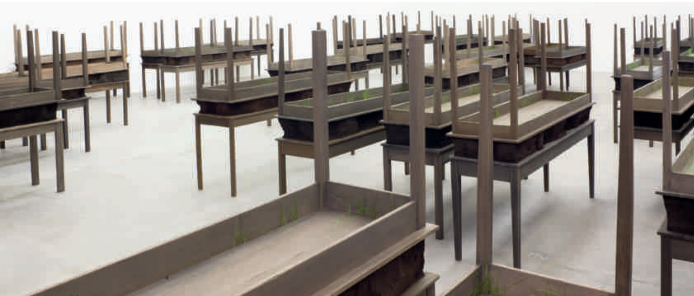
Doris Salcedo, Plegaria Muda, 2011. Installation

rad med två verk som båda har starka beröringspunkter med Plegaria Muda . I Atrabiliarios (1996) är skor placerade, ensamma och parvis, i små nisher in—skjutna i väggen. Skorna har tillhört försvunna personer vars kroppar aldrig har återfunnits. Ett gulnat och fint fårat animaliskt membran skiljer skorna ifrån vår blick, fördunklar den och gör att skorna framträder som i ett töcken. De är bara halvt närvarande, inneslutna i en kokong där tiden tycks förseglad. Endast några kirurgiska stygn lappar samman dessa tidsbubblor med vår egen rumslighet och tidslighet. De existerar invid oss som oläkta sårigheter, fyllda med en bedräglig känsla av närvaro, som så snart man försöker gripa tag i den, riskerar att blotta en traumatisk frånvaro.