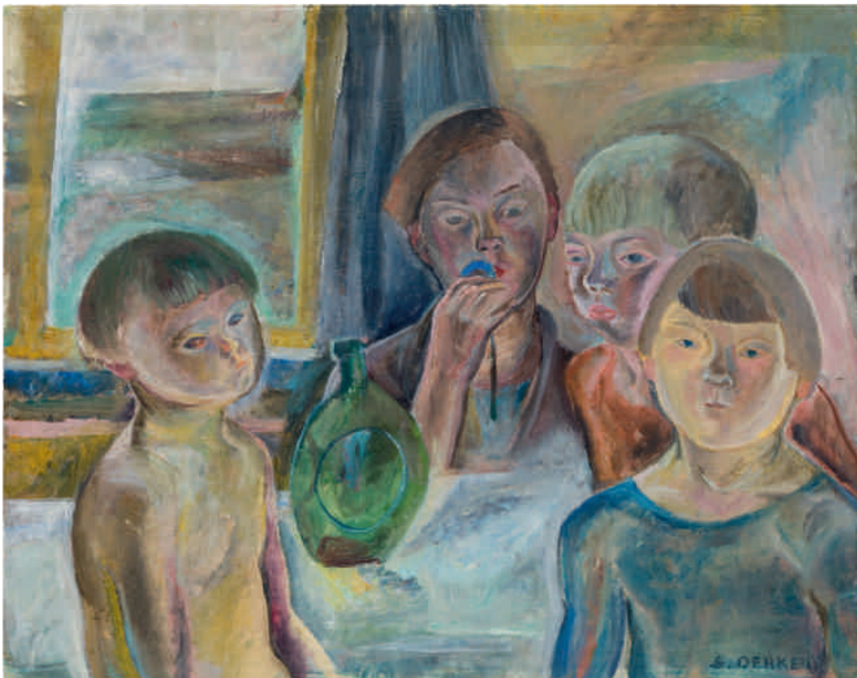
Siri Derkert, Barn kring bord , 1927. Olja på plywood. Privat ägo