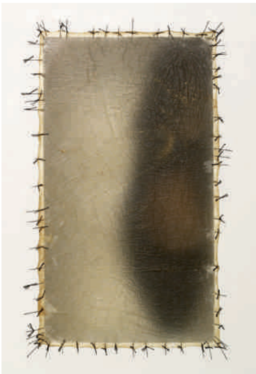
Doris Salcedo, Atrabiliarios , 1996. Gipsskiva, skor, urinblåsa från ko, kirurgisk tråd. Moderna Museet

Som få andra konstnärer har Doris Salcedo lyckats gestalta känslor av trauma och undertryckt sorg. Ett par skor från en försvunnen person, eller helt vanliga möbler omvandlas till en sorts alternativa minnesmonument. På Moderna Museet Malmö visas ett helt nyproducerat verk i 69 skulpturala delar. Verket svarar mot brutala våldsdåd med en kontemplativ stillhet.