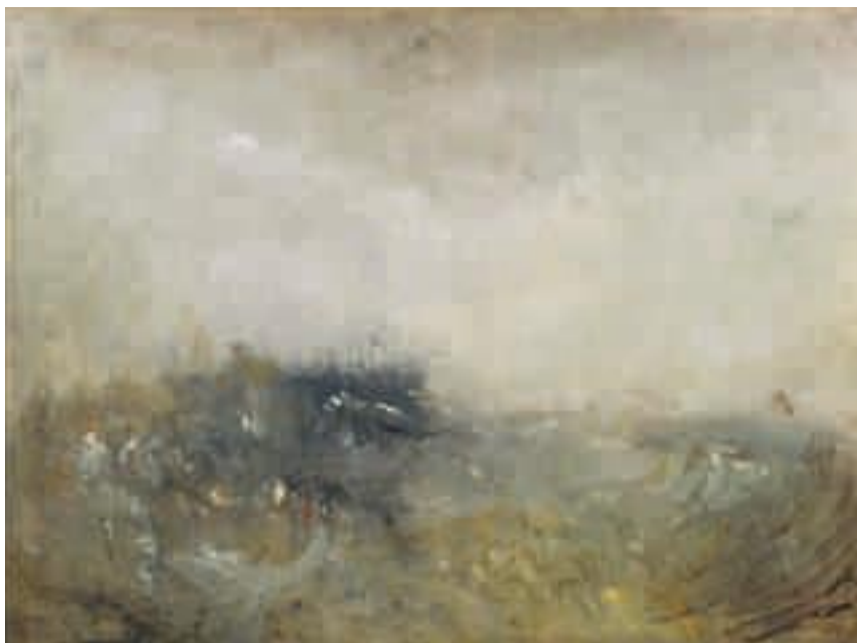
J.M.W. Turner, Rough Sea , ca 1840–45. Olja på duk.