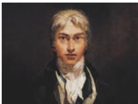
J.M.W. Turner, Self-Portrait, ca 1799. Olja på duk.

I en tid när det konceptuella haft en tendens att ta överhanden är det fint att bli påmind om några av konstens nyckelvärden, skriver curatorn för höstens storslagna utställning med sena verk av J.M.W. Turner, Claude Monet och Cy Twombly. Utställningen är en hyllning till tre banbrytare för det radikala måleriet som alla använde sig av färg för att uttrycka sitt engagemang i sociala och politiska frågor. Här ger han en introduktion till den första museiutställning i mannaminne som ägnas åt någon av dessa tre konstnärer i Sverige.