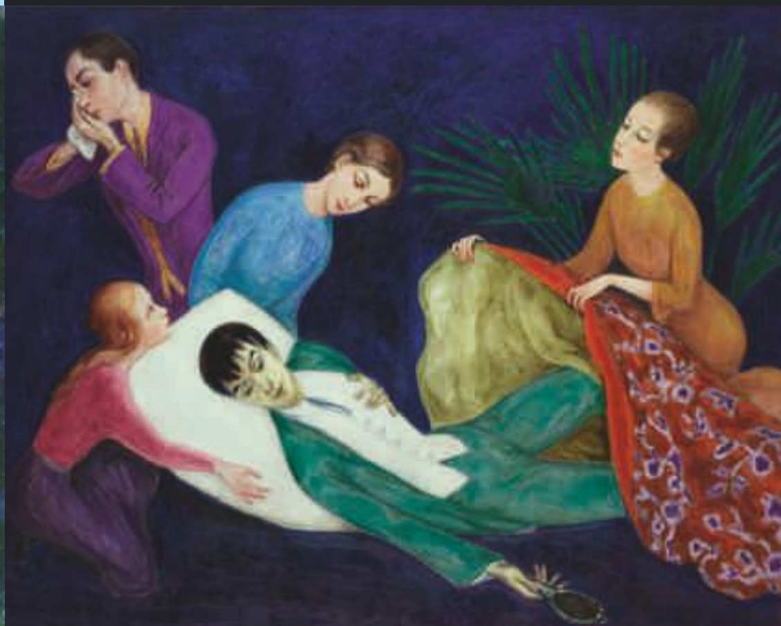
Nils von Dardel, Den döende dandyn , 1918 © Nils von Dardel/BUS 2011