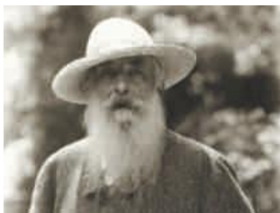
Claude Monet fotograferad av Nickolas Muray, ca 1926. Courtesy of George Eastman House, International Museum of Photography and Film. © Nickolas Muray Photo Archives