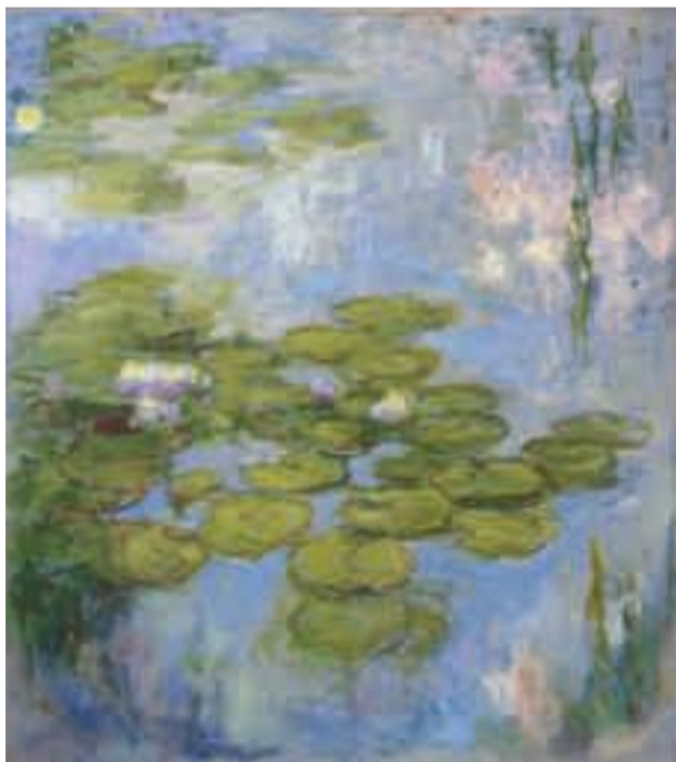
Claude Monet, Nymphéas , 1916–19. Olja på duk. Fondation Beyeler, Riehen/Basel