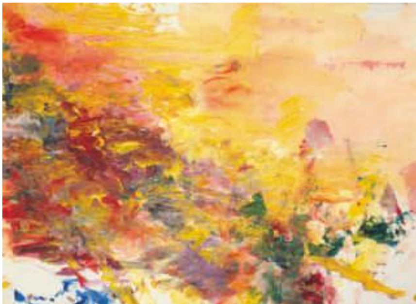
Cy Twombly, Untitled (Sunset) , 1986. Olja och akryl på papper. Privat ägo.

närer. Tre var en ännu större utmaning, men med hjälp av musei-kolleger över hela världen och privata samlare och stiftelser har vi fått ihop ett fantastiskt urval med målningar som aldrig tidigare visats i Sverige.