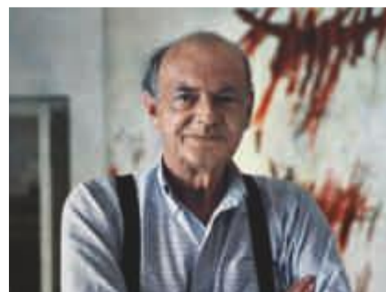
Cy Twombly fotograferad av François Halard, årtal okänt.

I den sannolikt mest ambitiösa utställning som någonsin hållits på Moderna Museet sammanförs tre av de senaste 200 årens största målare, inte som en jämförelse, utan som ett sätt att utforska hur konstnärer över århundraden kan dela intressen, värden och tankar. J.M.W. Turner, Claude Monet och Cy Twombly var alla både aktade och smädade av sin samtid. De var pionjärer som enligt sina belackare målade slarvigt och nonchalant och enligt sina beundrare tänjde på måleriets gränser. Utställningen är en hyllning till tre banbrytare för det radikala måleriet som alla använde sig av färg för att uttrycka sitt engagemang i sociala och politiska frågor – och i de livsfrågor alla människor brukar brottas med under livets senare del, för det är en utställning med verk från andra hälften av deras karriär, från en period då yttre strider har vunnits och de inre börjar. Förhållandet till döden, ett avtagande sexliv, ålderdomens orkeslöshet, förlusten av vänner