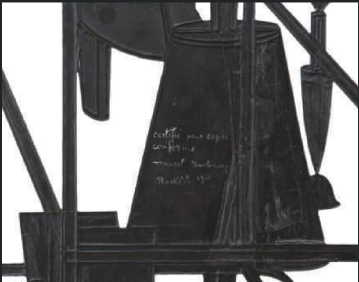
Detalj från The Bride Stripped Bare by Her Bachelors, Even av Marcel Duchamp, 1915–1923: "Certifié pour copie conforme Marcel Duchamp Stockholm, 1961"

Måleriet betonade ögat och konstnärens hand. Det ifrågasattes allt efter hand av fotografien som visade på nya mekaniska möjligheter att avbilda världen. Duchamp vände sig också mot målarens ensidiga betonande av det optiska och ville istället