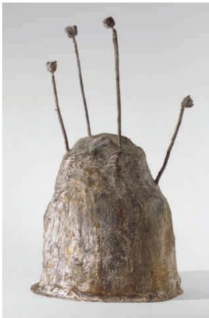
Cy Twombly, Thermopylae , 1992. Patinerad brons. © Cy Twombly/Courtesy Archives Fondazione Nicola Del Roscio

Cy Twomblys målningar kan liknas vid visuella ekon. Han har utvecklat ett absolut gehör för den måleriska ytans vibrationer. Hans skulpturer saknar dock både känd ursprungsort och funktion. Men de har en integritet och närvaro som är häpnadsväckande.