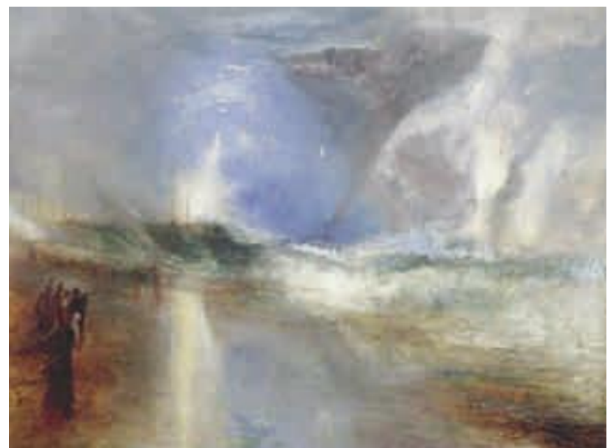
J.M.W. Turner, Rockets and Blue Lights (close at Hand) to warn Steam-Boats of Shoal Water, utst. 1840. Olja på duk. Sterling and Francine Clark Art Institute, Williamstown