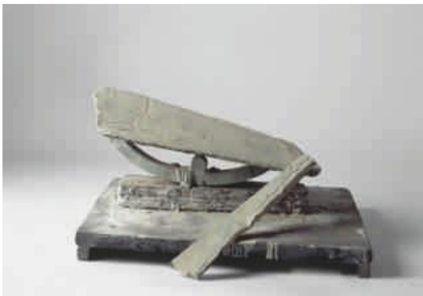
Cy Twombly, By the Ionian Sea , 1988, Brons. Privat ägo. © Cy Twombly/Courtesy Archives Fondazione Nicola Del Roscio

skulle kunna finna i en dammig monter på ett antikmuseum. Utan varken känd ursprungsort eller funktion, men med en integritet och närvaro som är häpnadsväckande.