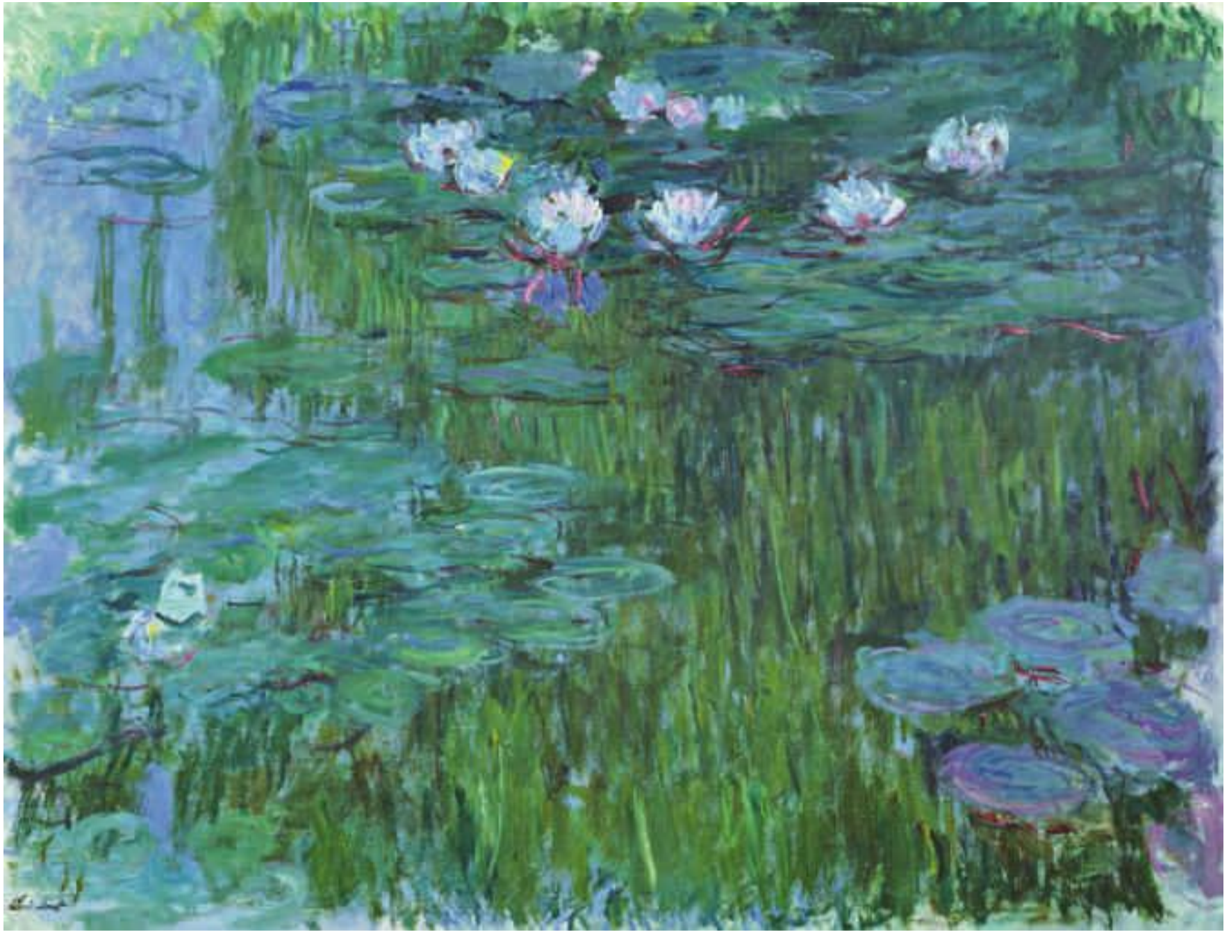
Claude Monet, Nymphéas, efter 1916. Olja på duk.

sen. Flera av hans brev vittnar om hur hjälplös han kände sig när det enda han kunde göra under kriget var att måla. Monets självförtroende vacklade. I jämförelse med den nya konsten som tog form i Frankrike och Tyskland, med fauvister som Henri Matisse och expressionister som Ernst Ludwig Kirchner, kände sig Monet som en del av det förgångna.