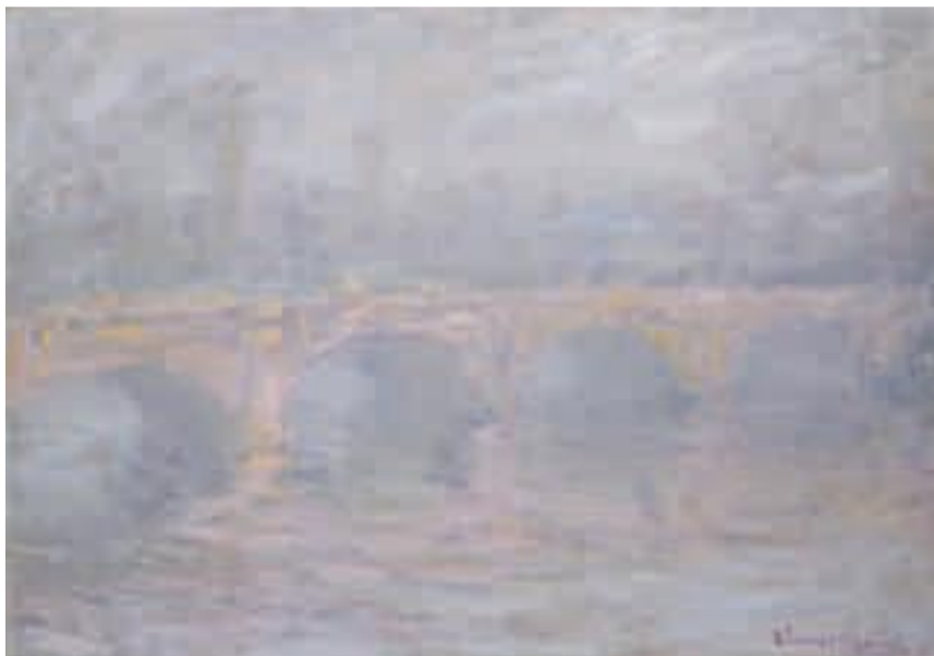
Claude Monet, Waterloo Bridge, London, effet rose, 1904. Olja på duk. National Gallery of Art, Washington D.C. Mr och Mrs Paul Mellons samling, 1983.1.28