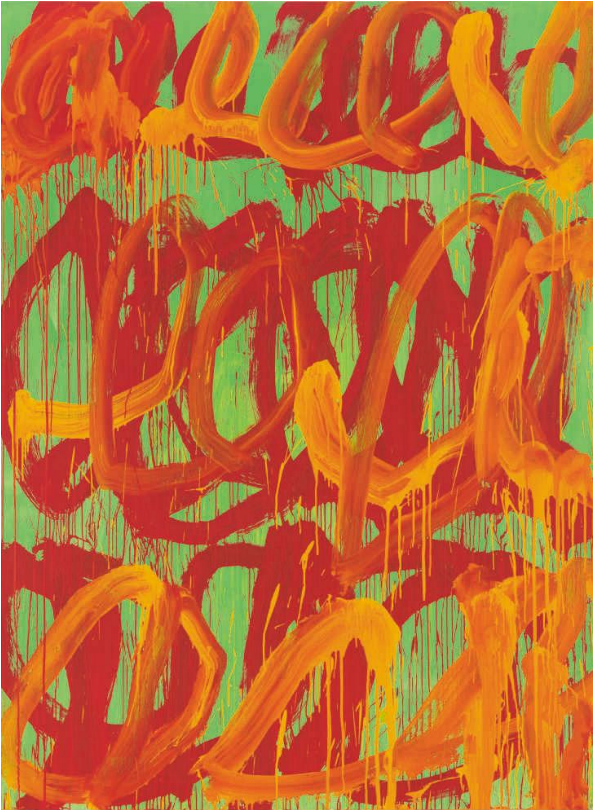
Cy Twombly, Camino Real (II) , 2010. Akryl på träpannå. Privat ägo, Courtesy Gagosian Gallery. © Cy Twombly/Courtesy Gagosian Gallery. Foto: Robert McKeever