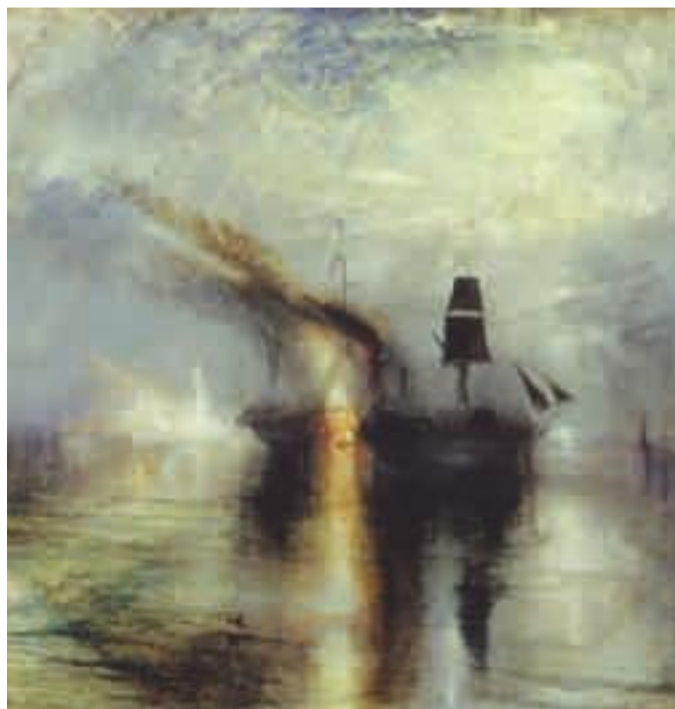
J.M.W. Turner, Peace – Burial at Sea, utst. 1842. Olja på duk.

skönheten. Han skulle senare vända den akademiska idealismen som Reynolds förespråkade ryggen genom att vägra visa människor som ideala arketyper. Istället framställde Turner sina figurer som obetydliga anti-hjältar med begränsade möjligheter att påverka de oändliga krafter som naturen satt i spel. Men Reynolds förespråkade också att eleverna skulle imitera de stora mästarnas stil och genom hela sitt liv målade Turner nära mästare