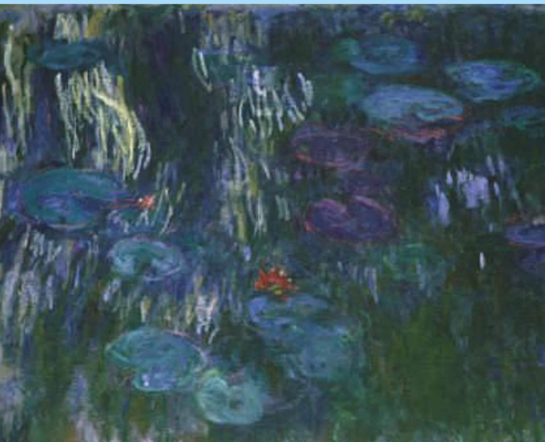
Claude Monet, Water-Lilies , 1907 © Claude Monet Göteborgs konstmuseum. Foto: Hossein Sehatlou