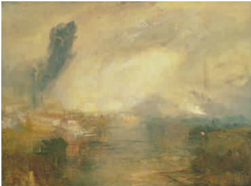
J.M.W. Turner, The Thames above Waterloo Bridge, ca 1830–35. Olja på duk.

som Titian och Raphael, Claude Lorrain, Poussin, Rembrandt och Van Dyck.