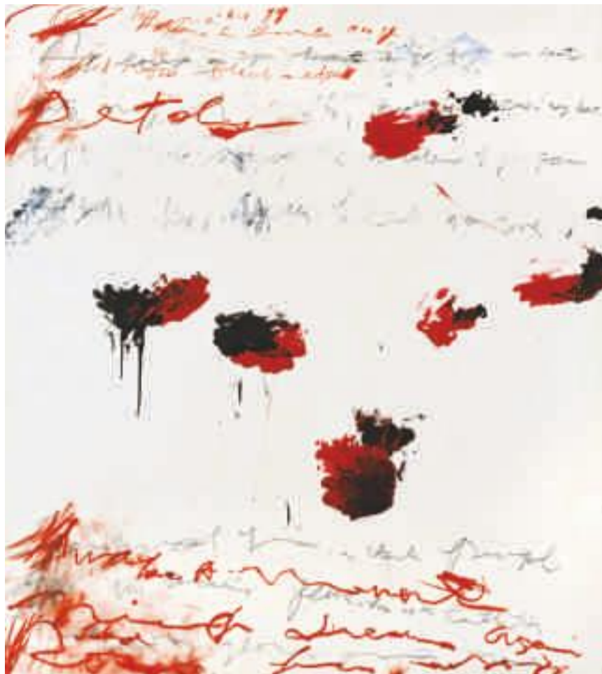
Cy Twombly, Petals of Fire , 1989. Akryl, tempera, oljefärg (lackstift), blyerts och färgpenna på papper. Privat ägo, Courtesy Thomas Ammann Fine Art AG, Zürich. © Cy Twombly/Courtesy Heiner Bastian