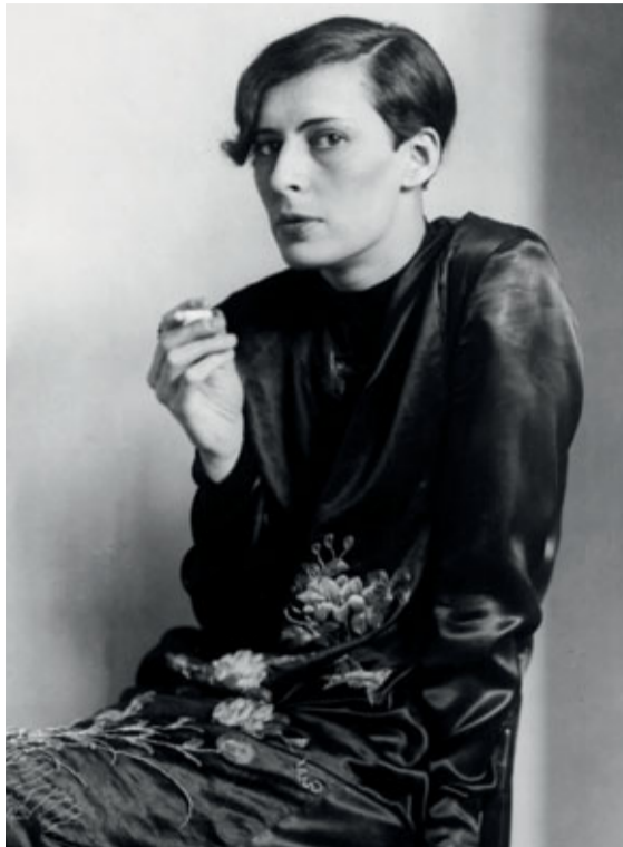
August Sander, Sekreterare vid tyska radion , 1927 (bilden är beskuren) © August Sander / BUS 2011