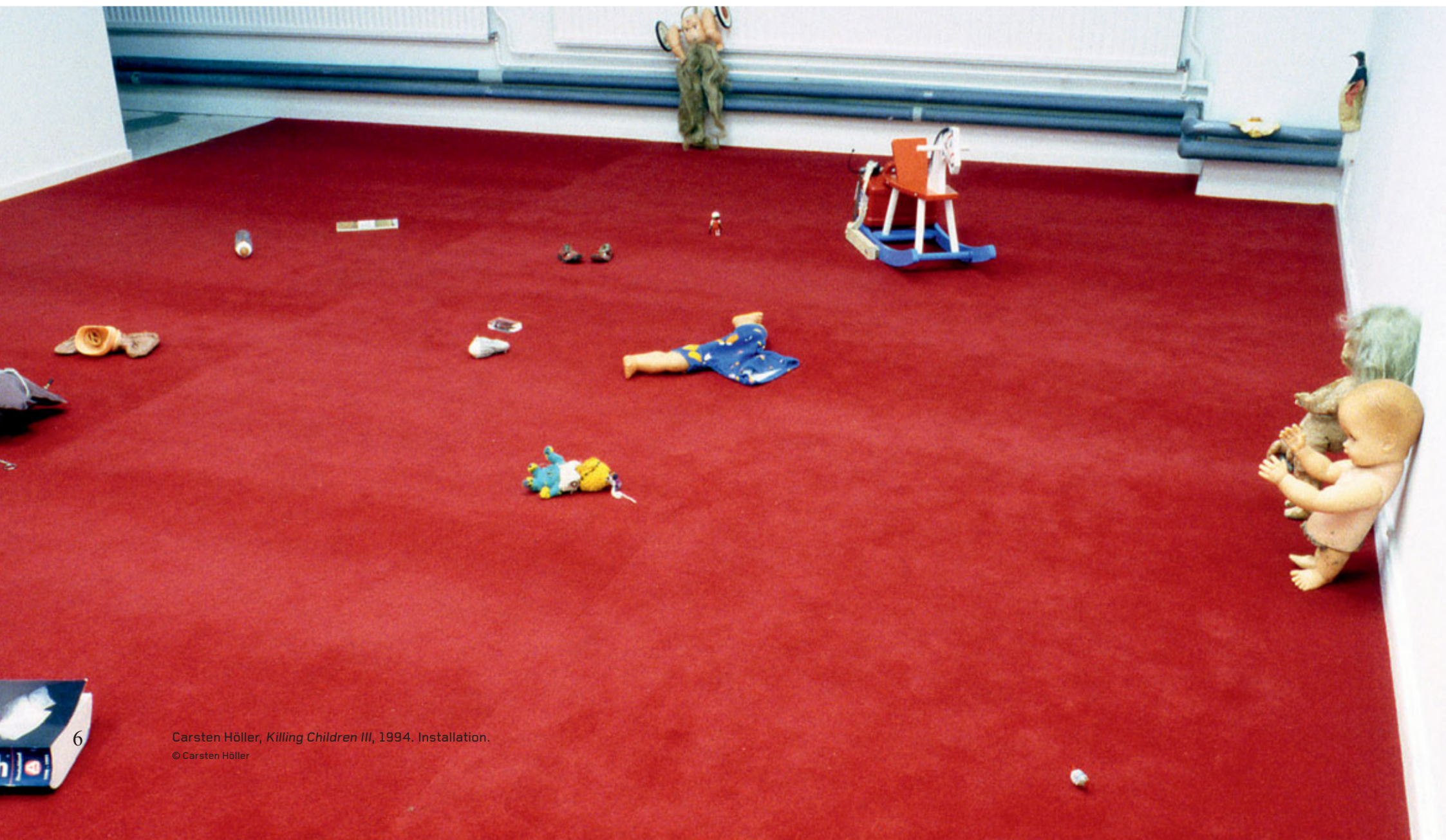
6 Carsten Höller, Killing Children III , 1994. Installation. © Carsten Höller

Moment är titeln på en serie utställningar där konstverken i fråga bestämmer såväl utställningsplatsen i Moderna Museet som själva utställningstiden. Moment – Ynglingagatan 1 utspelar sig på 1990-talet och följer upp vårens programverksamhet och tidskriftsutställning kring 1980-talet som museet gjorde i anslutning till utställningen av Eva Löfdahl. Utställningen pågår mellan 26 november och 22 januari 2012.