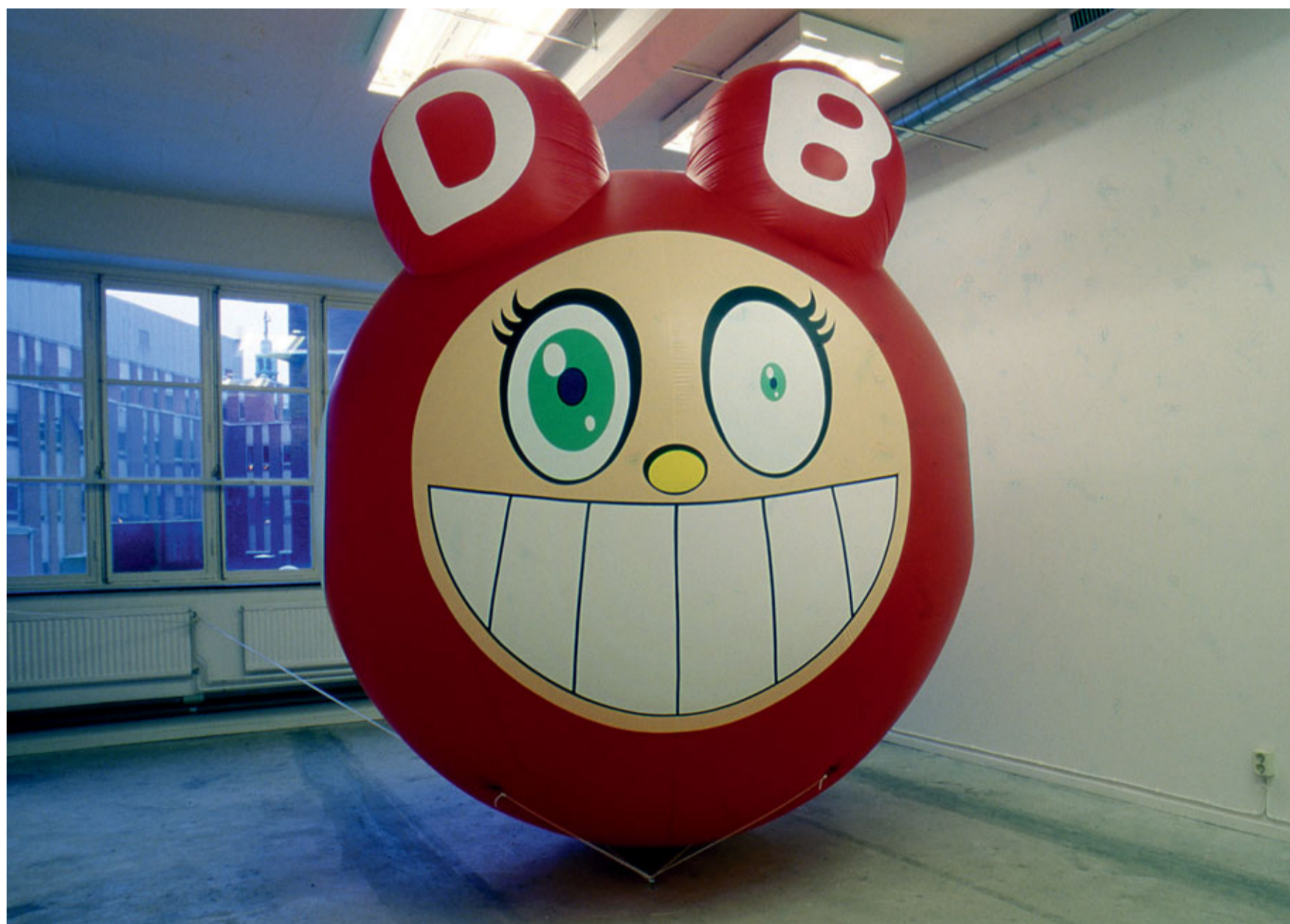
Takashi Murakami, Mr Dob, uppblåsbar skulptur installerad 1995 på Ynglingagatan 1 när galleriet var beläget på Gävlegatan 12.

Det ideella galleriet Ynglingagatan 1 öppnade 1993 på nämnda gatuadress i Stockholm. 1999 stängde det. Då hade galleriet hunnit flytta två gånger och var beläget på Döbelnsgatan 2, fast fortfarande med namnet Ynglingagatan 1. En symptomatisk förvirring som präglade 90-talets sammanblandning av gör-det-självtityd med alternativa finansieringsmodeller.