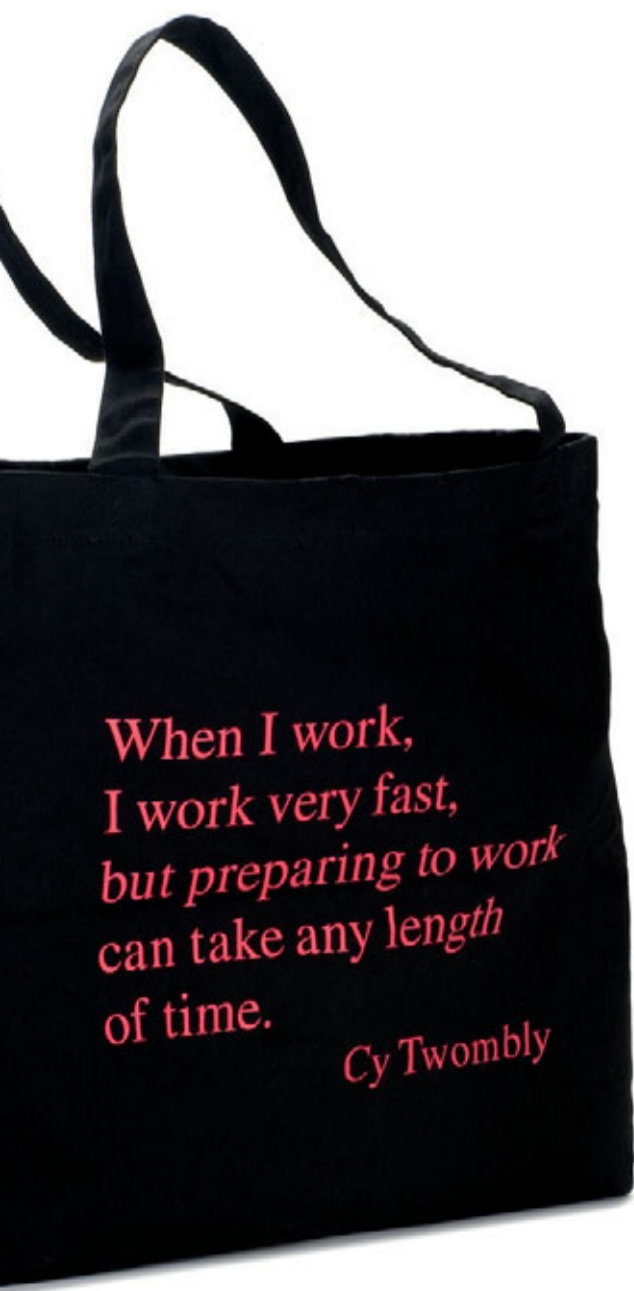
En modernare julklappssäck! Rymlig axelväska (40x15x40 cm) i rejäl 250 gr bomull. 139 kr (125 kr medlemspris). Välkommen till Butiken!