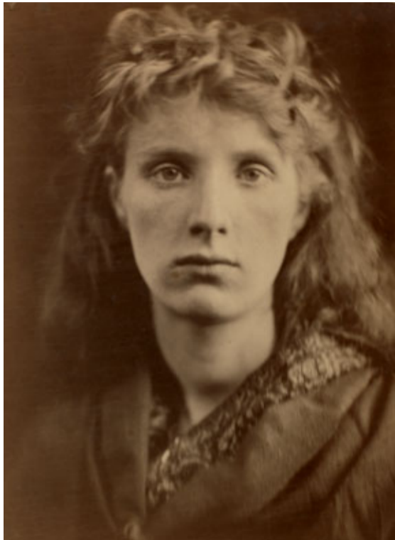
Julia Margaret Cameron, The Mountain Nymph, Sweet Liberty , 1866 © Julia Margaret Cameron