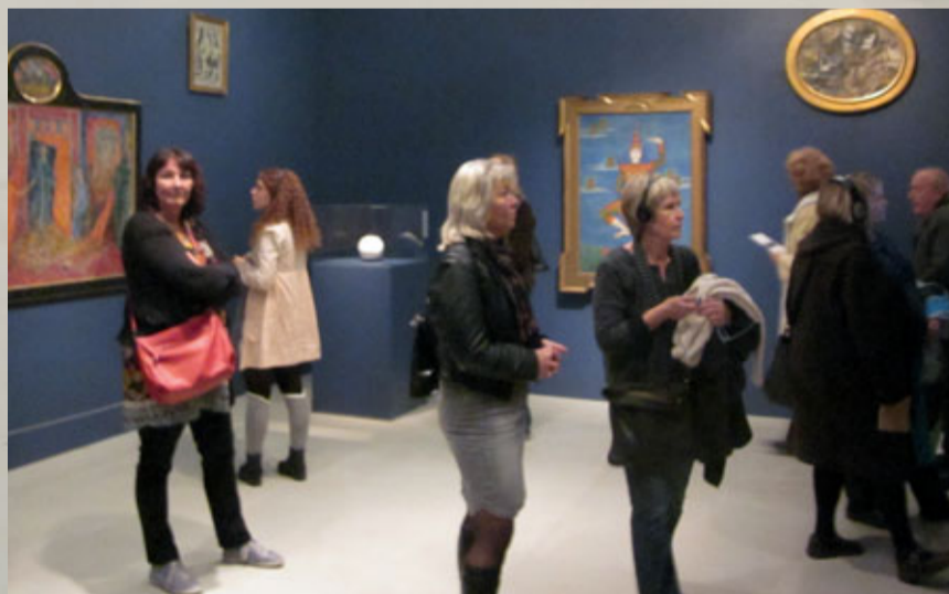
Installationsbild av Rolf de Marés "blå salong" i Scenbyte . Från vänster: Nils Dardels Reception (1914), Fernand Légers De båda gracerna (1929), Brancusis Den nyfödde II (1919–21), Dardels Jean Börnin i Siamesisk dans (1919) och Georges Braques Stilleben med violin (1911).