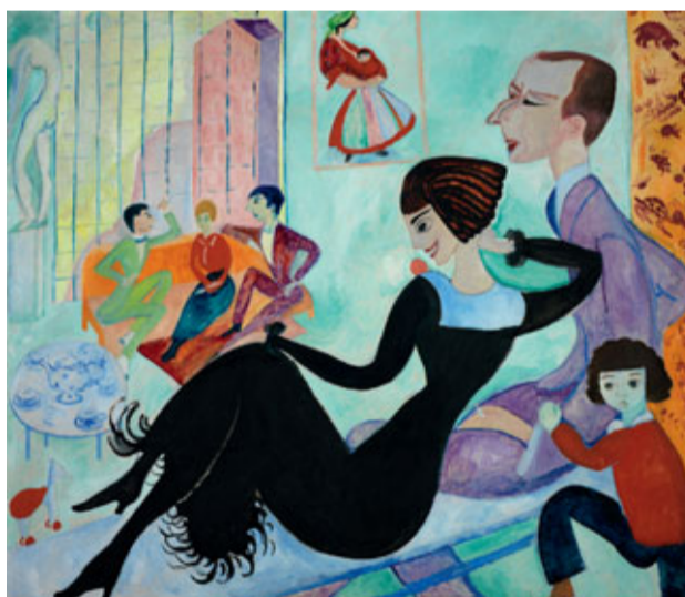
Sigrid Hjertén, Ateljéinteriör , 1916.

nu med Moderna Museets samling i tankarna. Hur hade kubismen utvecklats om inte Picasso mött den afrikanska skulpturkonsten i Paris? Hur hade Matisse sett ut om han inte tagit tåget med några vänner till München 1910 för att se den stora utställningen med islamsk konst och textil? Och hur ska man förstå Sigrid Hjerténs artikel ”Modern och österländsk konst” som hon publicerade i Svenska Dagbladet 1911 där hon drar