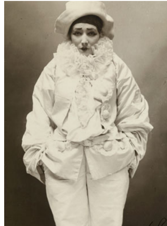
G Felix T Nadar, Sarah Bernhardt i Pierrot, sin hustrus mördare, 1883 (bilden är beskuren)

Nu är det klart. I alla samlingsalar på Moderna Museet presenteras historien från 1840 och fram till idag genom fotografier. Sista delen av En annan historia är färdigställd. Med underrubriken Skrivet i ljus presenteras pionjärerna från 1800-talet. Passa på att se en av de mest radikala omhängningarna av en museisamling någonsin. Nästa år tar den en ny skepnad.