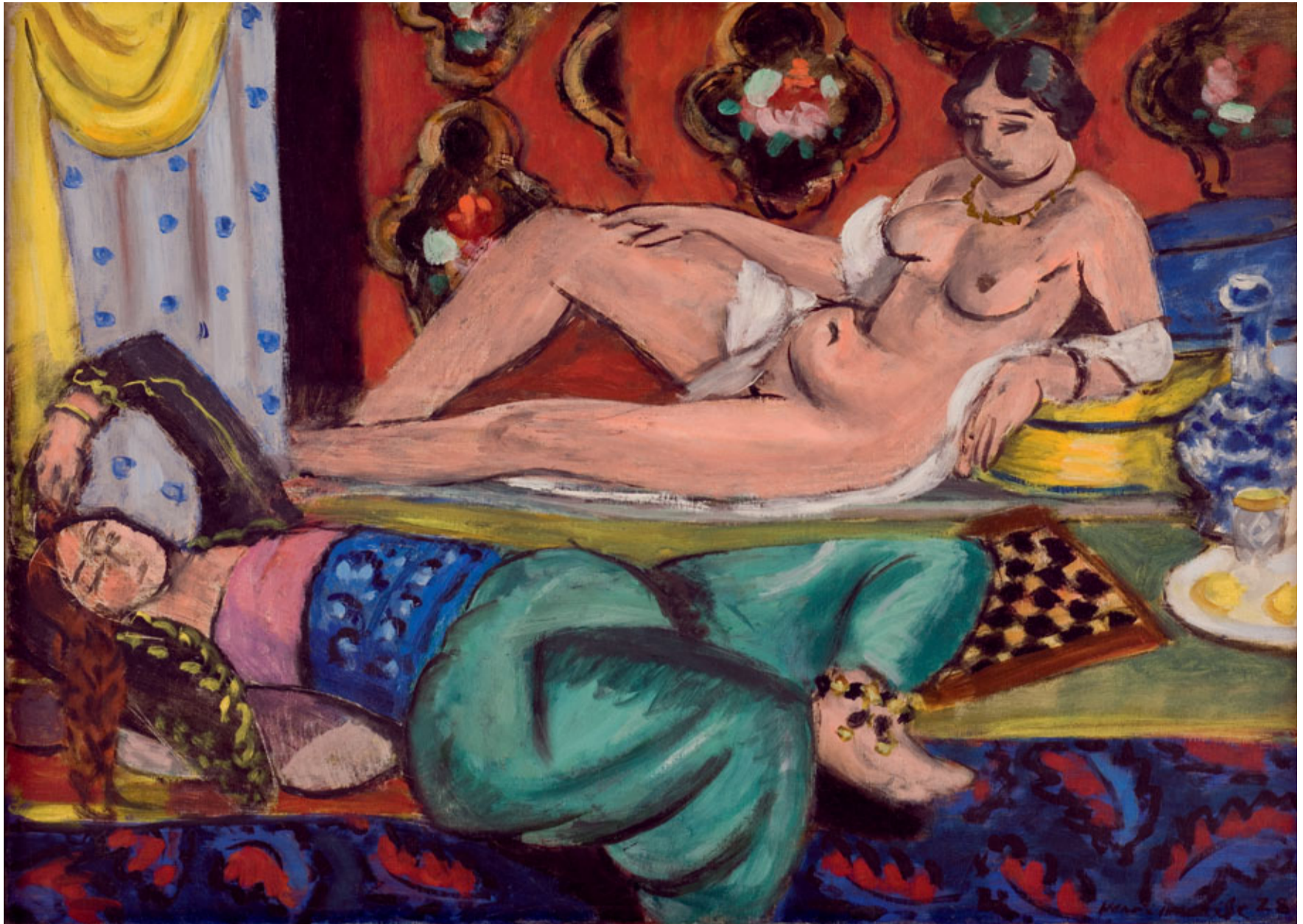
Henri Matisse, Två odalisker varav en är avklädd, ornamental bakgrund och dambräde, 1928.