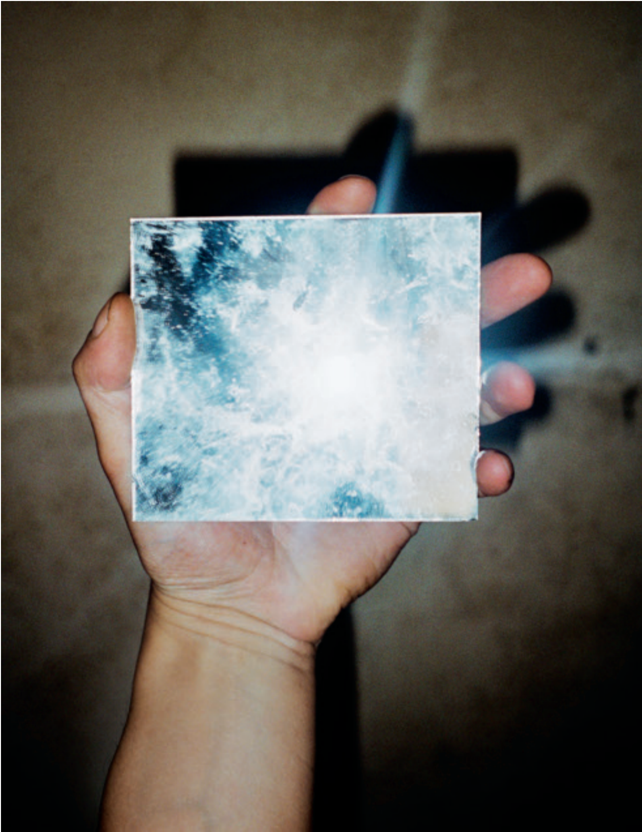
Martin Bogren, Titel saknas. Ur serien Lowlands , 2011. © Martin Bogren