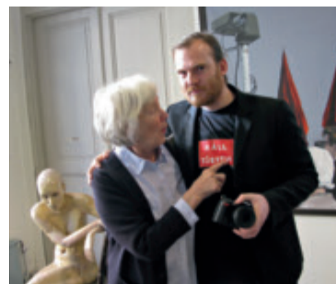
På Tisdagsklubben håller vi inte tjeften.