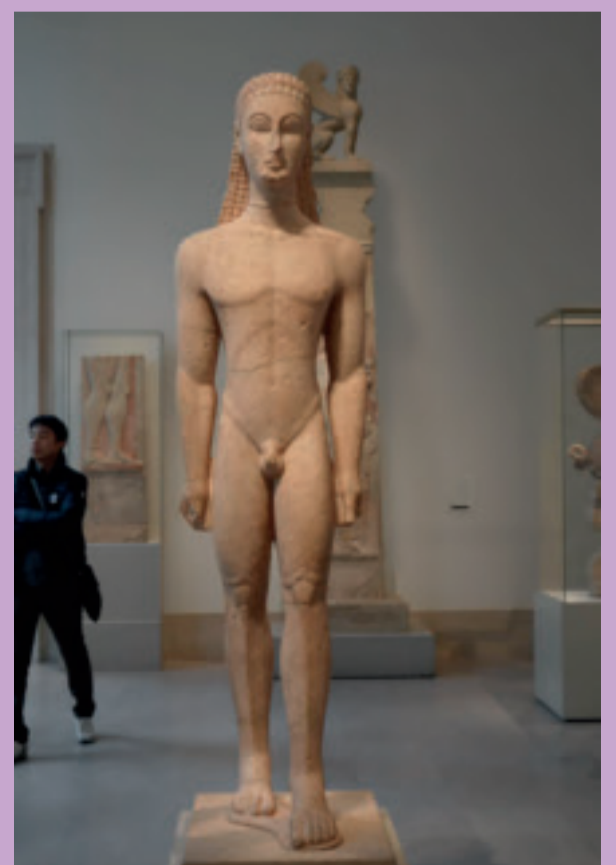
Kouros, marmor cirka 590–580 f.Kr. Foto: Charles Ray