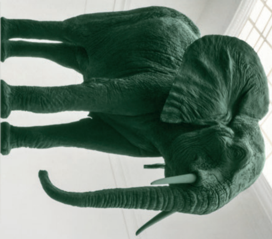
Katharina Fritsch, Elefant , 1987.