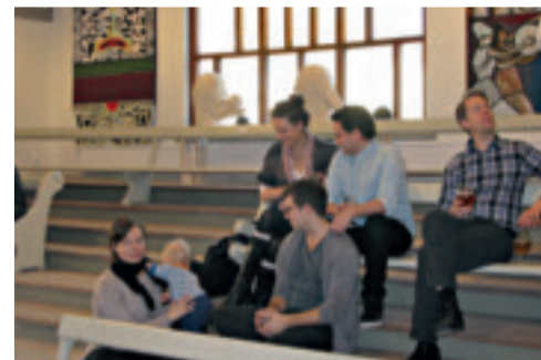
Det Nya Museet invigdes den 8 mars i år.