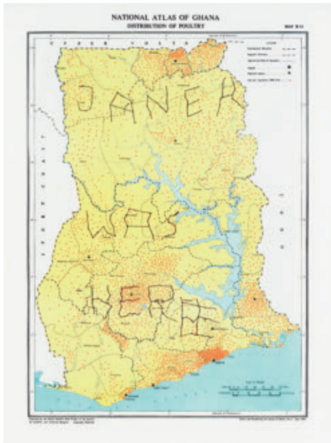
Ovan: Janek Simon, Janek was here (2010), 2010. © Janek Simon, Courtesy of Raster gallery, Warsaw