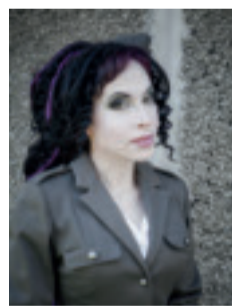
Sofi Oksanen