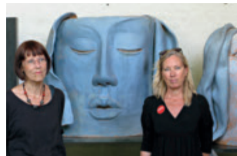
We are blue for you Hertha Hillfons