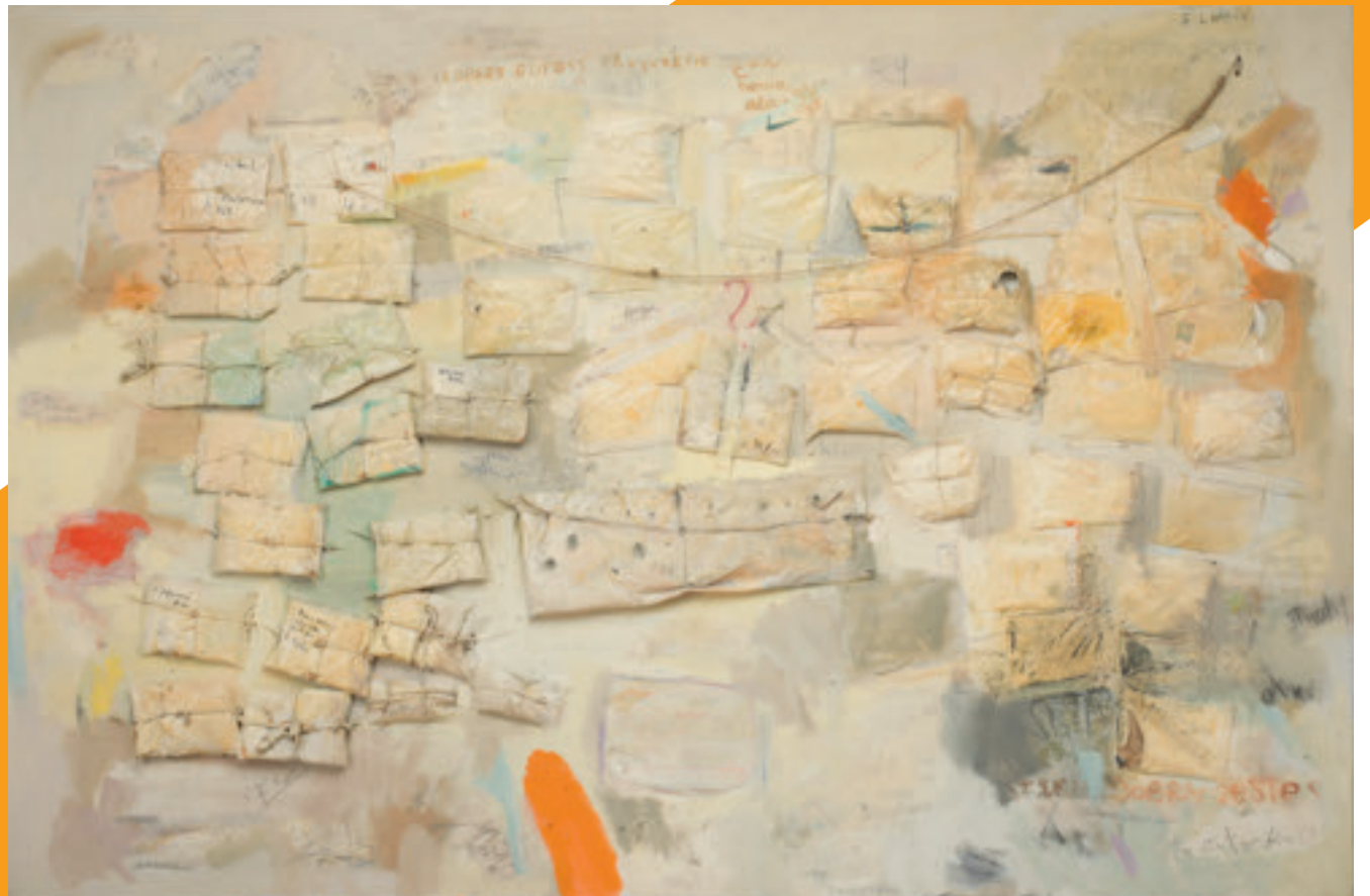
Tadeusz Kantor, Signez, s'il vous plait ( Var god signera!), 1965.