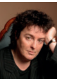
Carol Ann Duffy