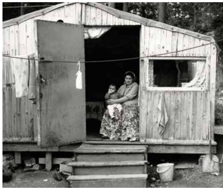
Från vänster till höger: Björn Langhammer, Bröllopsfest i Svedmyra, 1966 © Björn Langhammer