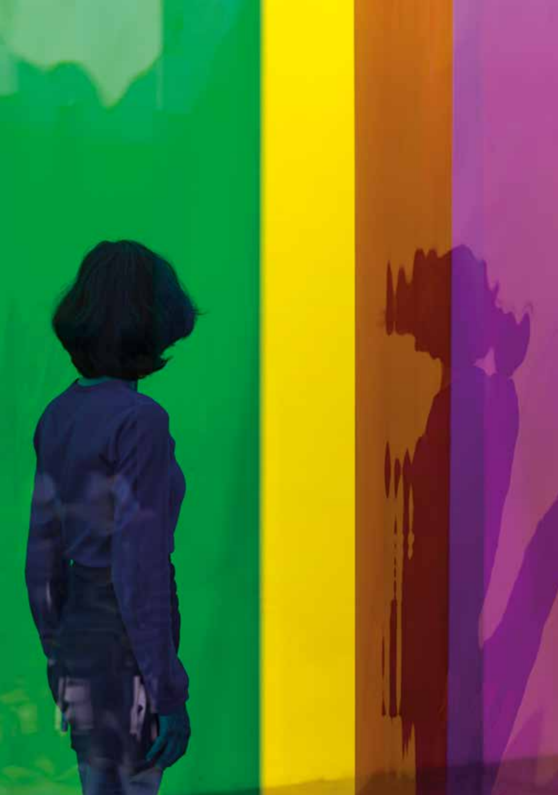
Olafur Eliasson, Seu corpo da obra (Your body of work), 2011. Test hos Studio Olafur Eliasson, 2015