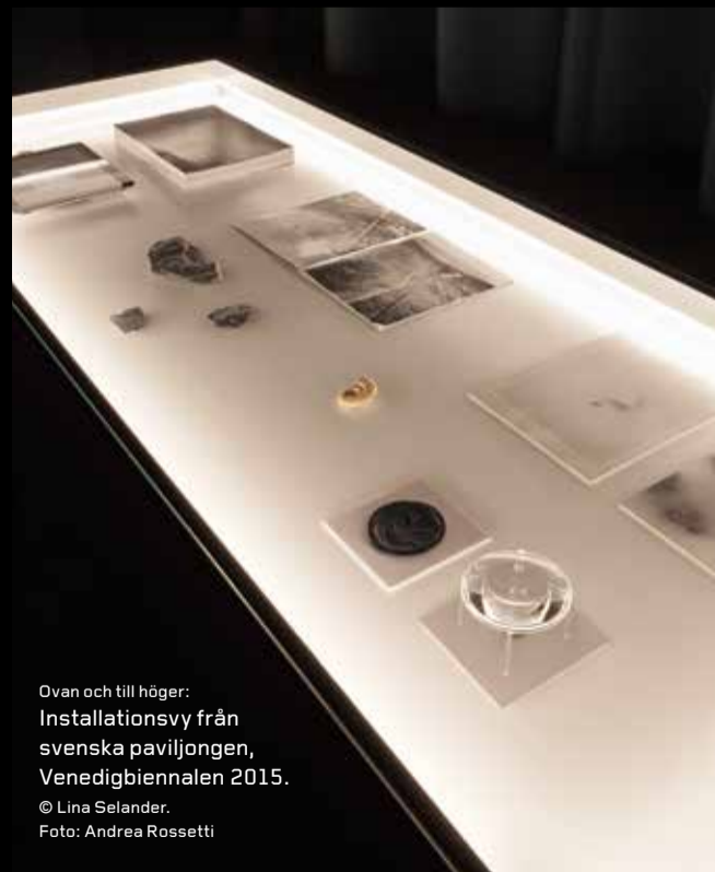
Ovan och till höger: Installationsvy från svenska paviljongen, Venedigbiennalen 2015. © Lina Selander.