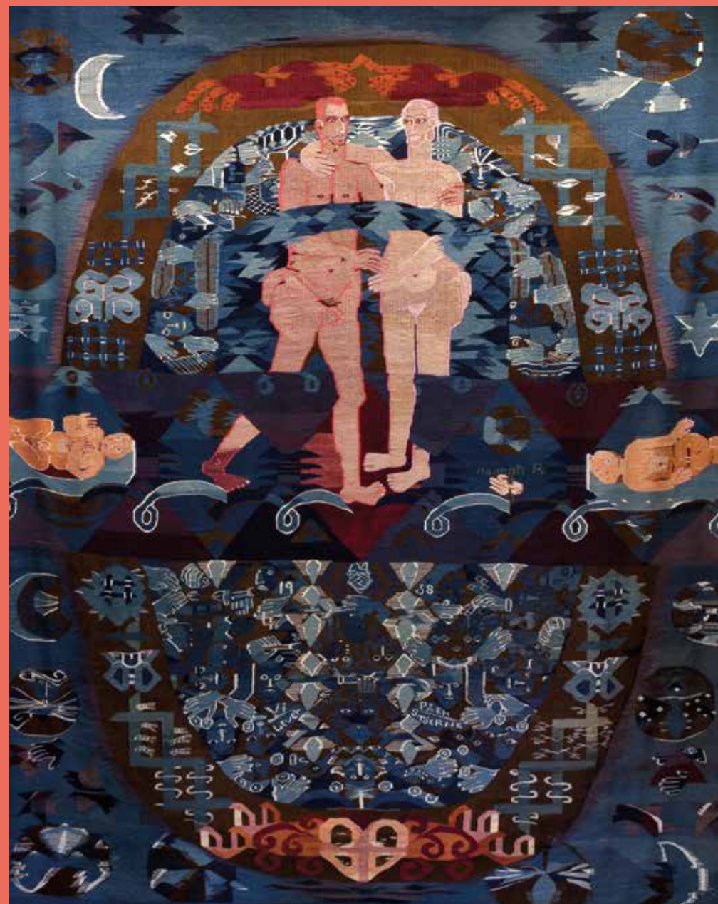
Hannah Ryggen, Vi lever på en stjerne, 1958. Nordenfjelske kunstindustrimuseum