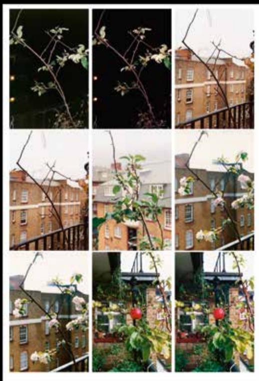
Wolfgang Tillmans, Process (apple tree) , 2012. © Wolfgang Tillmans