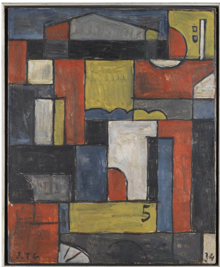
Joaquín Torres-García Locomotora con casa constructiva , 1934

Landsmannen Rhod Rothfuss (1920–1969) flyttade till Buenos Aires 1942 där han kom att få ett anseende på den konkreta konstens utveckling.