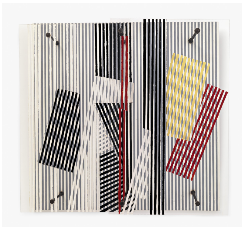
Jesús Rafael Soto Double transparencia, 1956

Den tysk-judiska konstnären och arkitekten Gego (Gertrud Louise Goldschmidt, 1911–1994) flydde till Venezuela undan den nazistiska regimen 1939. Under 1960-talet började hon använda material som ståltråd, papper och järn för att skapa tredimensionella teckningar. Hennes ståltråds installationer satte linjen och formen i ett direkt förhållande till rummet.