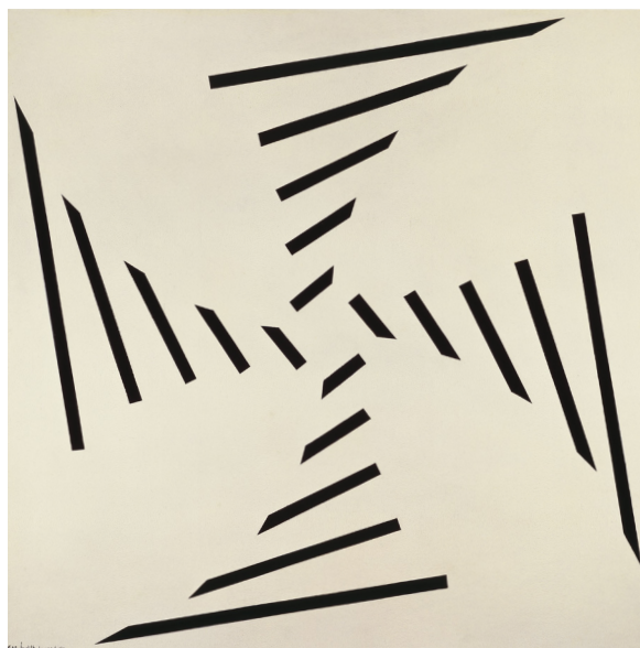
Judith Lauand Concreto 61 , 1957