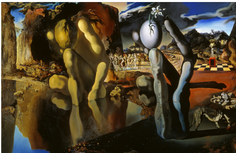
Narcissus metamorfos, olja på duk, 51.1 x 78.1 cm © Salvador Dalí, Gala-Salvador Dalí Foundation/BUS 2009