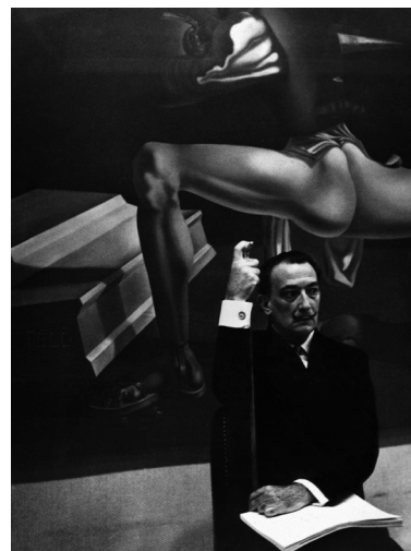
Salvador Dalí framför målningen på Moderna Museet, 1973.

Wilhelm Tells gåta är en för Dalí ovanligt stor målning. Wilhelm Tell är en politisk gestalt från en sägen – en frihetshjälte som inte lydde makten. Som straff tvingades han skjuta bort ett äpple från sin sons huvud – med andra ord utsätta sin son för livsfara. I målningen ser vi en man, vars ansiktsdrag liknar kommunistledaren Lenins, med en väldig skinka. Den långa skinkan hålls uppe av en krycka.