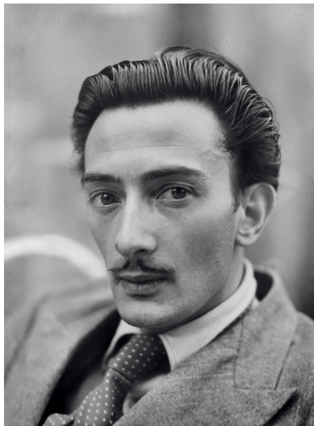
Salvador Dalí, u.å. gelatinsilverfotografi, 10x7.6 cm, Moderna Museet

Gifter sig borgerligt med Gala. Deltar i Exposition du Cinquantenaire i Paris, en utställning som de andra surrealisterna bojkottar. Dalís deltagande tillsammans med hans skildring av Lenin i den utställda målningen Wilhelm Tells gåta leder till att han är nära att uteslutas ur surrealistgruppen. Reser till USA för första gången.