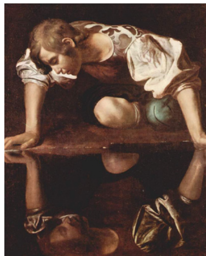
Caravaggio (1571–1610). Narcissus, olja på duk, c. 1597–99. Galleria Nazionale d'Arte Antica

Narcissus metamorfos från 1937 griper sig an ett tema som är välrepresenterat i konstens historia och som har sin grund i myten om Narcissus. Den antika skalden Ovidius skriver i sina Metamorfoser om Narcissus öde. Det berättas där att Narcissus var så vacker att både kvinnor och män som såg honom blev handlöst förälskade. Vid ett tillfälle blev han lurad att böja sig ner över en källa för att dricka. Han förälskade sig då i sin egen spegelbild som han betraktade i vattenytan och inte kunde slita sig ifrån. Han dog på platsen, och där spirade sedan den blomma som fått hans namn – narcissen.