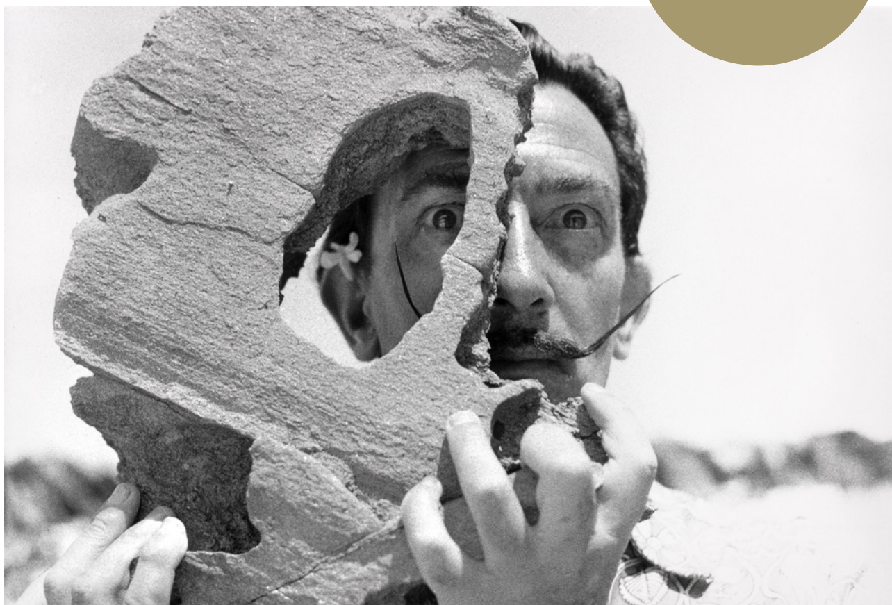
Salvador Dalí, 1953, gelatinsilverfotografi, 20.1X30 cm

Handledningen riktar sig i första hand till lärare på högskolan och gymnasiet