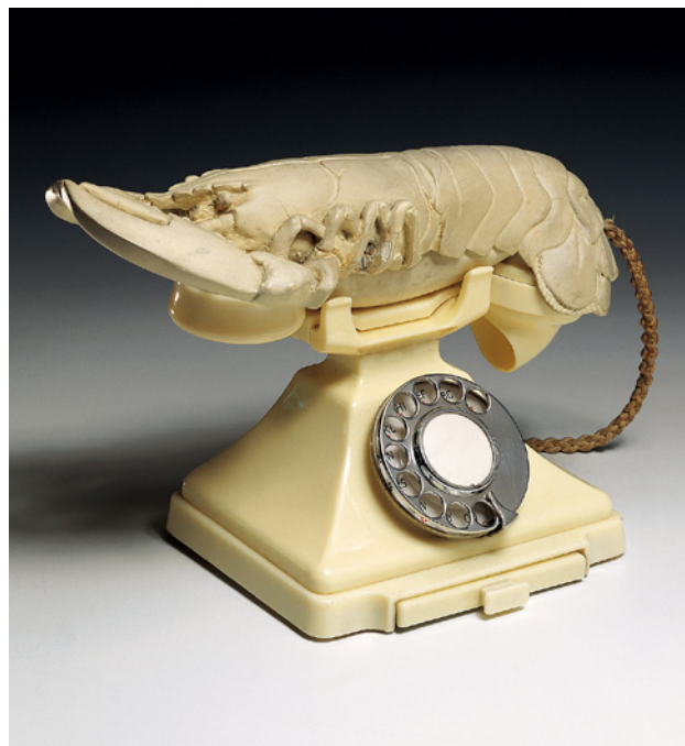
Vit afrodisisk telefon, 1936, blandteknik, 20X30X15 cm

Klockor Från tidigt 1930-tal målade Dalí ofta smältande, mjuka klockor. Inspirationen kom från en mogen camembertost, "som rann iväg och fick eget liv". Vid denna tid var Dalí strängt upptagen av kontrasten mellan hårt och mjukt. Det mjuka representerade det förgängliga, huvudsakligen det som var skapat av människor. Det hårda, som landskapet och klipporna, var beständigt. Dalí's mjuka klockor har av honom själv betecknats som symbol för relativitetsteorins fyrdimensionella sammansmältning av rum och tid. Teorin hade påvisat att varje föremål äger en "egentid", som beror av dess rörelse och energitillstånd och inte av den klockmässigt mätbara tiden.