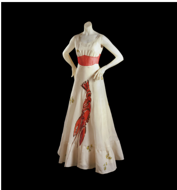
Elsa Schiaparelli med Salvador Dalí, klänning, 1937, silkesorganza

Kläder och mode var för surrealisterna, liksom för dadaisterna före dem, laddat med sexuell symbolik och fetischistiska kvaliteter. Det var framför allt accessoarerna – hattar, handskar, skor och smycken – som surrealisterna ägnade intresse. Salvador Dalí skapade även kläder. Tillsammans med den kända modedesignern Elsa Schiaparelli formgav Dalí surrealistiska klänningar. En sådan är den hummerklänning i silkesorganza som Schiaparelli presenterade under våren 1937. Dalí, som var mycket förtjust i allehanda skaldjur, använde hummern i en rad skapelser från och med 1934. När det gällde Schiaparellis klänning hävdade Dalí att den borde bäras tillsammans med en rejäl klick majonnäs.