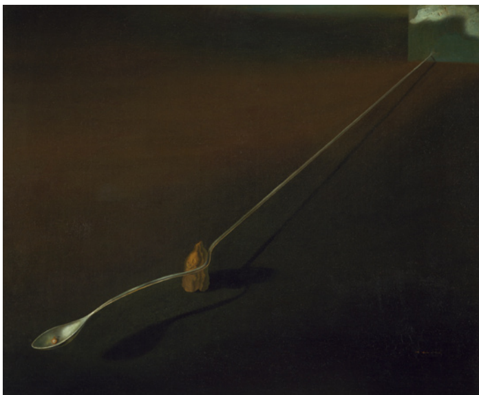
Agnostisk symbol, 1932, olja på duk, 54×65.2 cm © Salvador Dalí, Gala-Salvador Dalí Foundation/BUS 2009

I målningen Agnostisk symbol från 1932 har Dalí målat en förvriden sked, utdragen likt tuggummi, som spränger fram ur en spricka i en vägg i bildens övre högra hörn. Väggen ser nästan ut som en målning i målningen och är en av få detaljer som blicken kan dröja vid i den för övrigt väldigt sparsmakade kompositionen.