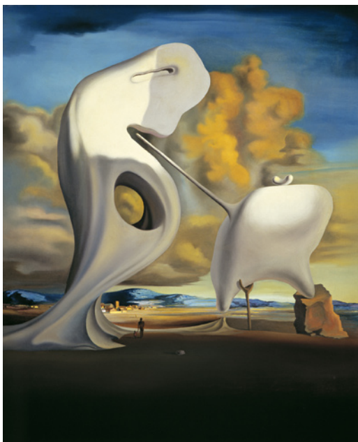
Arkitektonisk Angelus efter Millet, ca 1933, olja på duk, 73x61 cm © Salvador Dalí, Gala-Salvador Dalí Foundation/BUS 2009