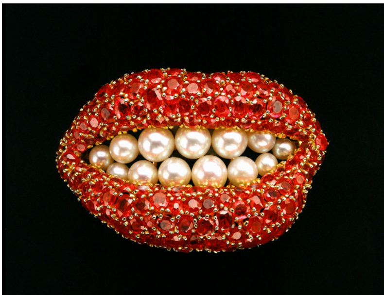
Rubinläppar, 1949. Brosch i 18 kt gult guld, rubiner och pärlor, 3.2×4.8×1.5 cm

”Mina smycken är en protest mot fixeringen vid kostnader för juvelernas själva råmaterial. Mitt mål är att visa juvelerarkonstens i dessa sanna perspektiv – där utformningen och hantverk bör värderas högre än själva ädelstenarna, som under renässansen.”