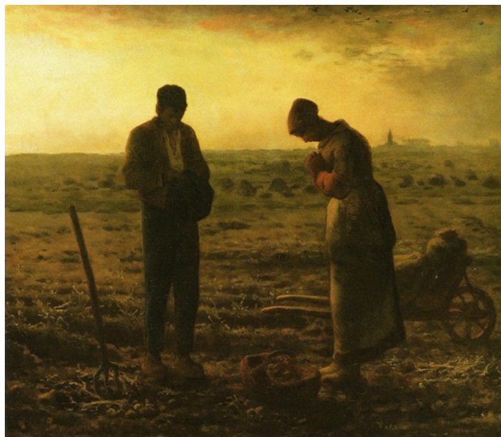
Jean-François Millet (1814–1875). L'Angélus, 1857–1859, olja på duk, Musée d'Orsay.

När Dalí var barn såg han en reproduktion av den franske konstnären Jean-Francois Millets målning Angelus från 1857–59. Den föreställer ett bondpar som har tagit en paus i sitt hårda arbete för att försjunka i en stunds hängiven bön. Målningen skildrar en personlig gudstro, långt ifrån kyrkans pompa och ståt. Minnet av detta verk dök upp hos Dalí år 1932, och minnesbilden blev startskottet till en rad konstverk och en bok som kretsade kring Angelus -målningen.