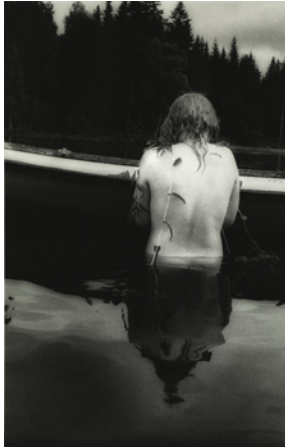
Nina Korhonen, Tång , 1987–1995 © Nina Korhonen