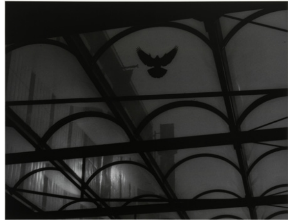
Kenneth Gustavsson, Berlin , 1983