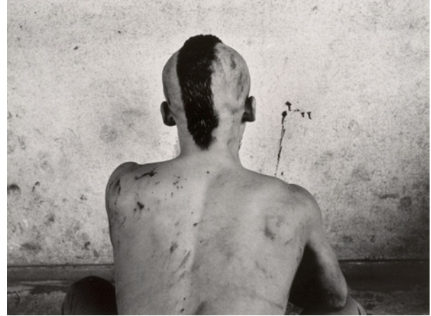
Christer Strömholm, Shinohara , ca 1961