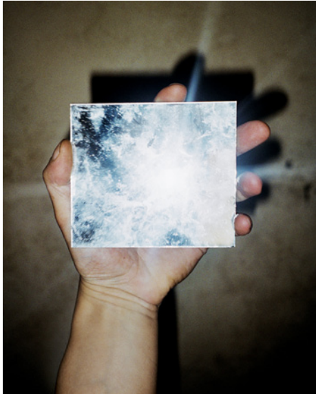
JH Engström, Titel saknas. Ur serien Tout va bien , 2014