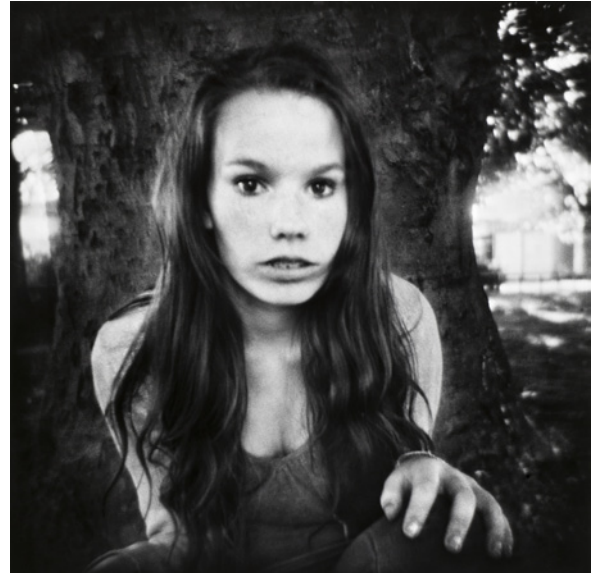
Martin Bogren, Titel saknas . Ur serien Lowlands , 2011 © Martin Bogren