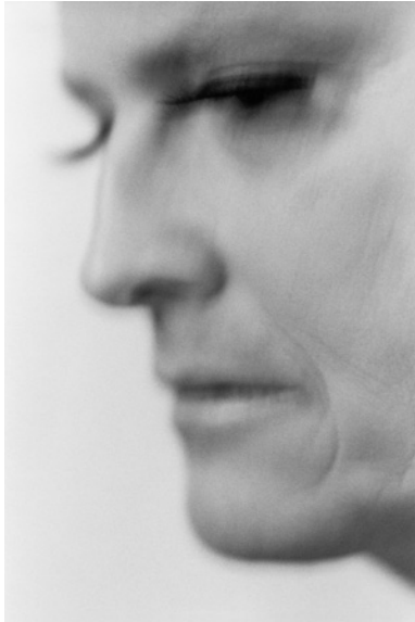
Stina Brockman, Vad hände? , 2001 © Stina Brockman