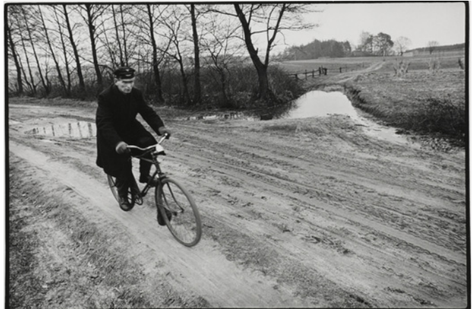
Håkan Pieniowski, Landskap, Polen , 1974