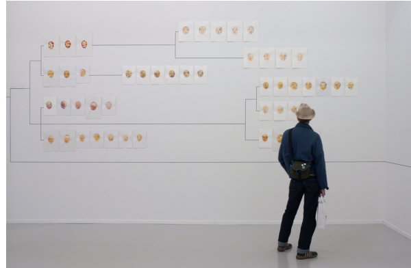
Interbreeding Classified , 2002, © Eva Löfdahl

Två större tunnband är placerade mitt emot varandra högt på väggen, fästade inuti vardera bandet snurrar ett litet gummihjul oförtrutet runt, runt. Modell G (1993) är kanske en cirkel formad som modell för tillvarons meningslöshet, där det lilla gummihjulet trampar på medan de stora tunnbanden intagit sina statiska och ickekommunikativa positioner i förhållande till varandra.