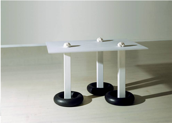
Utan titel , 1989, © Eva Löfdahl