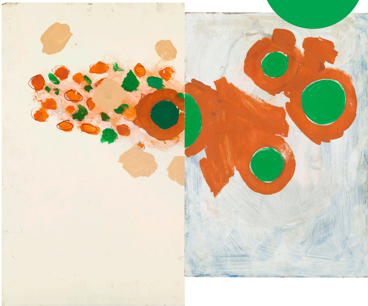
Saturnus, 1981, © Eva Löfdahl

Handledningen riktar sig i första hand till lärare i åk 7–9 och gymnasiet