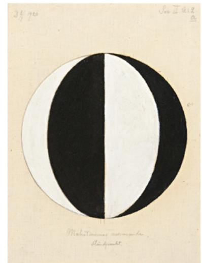
Mahatmernas nuvarande ståndpunkt , nr 2a, serie II, 1920 © Stiftelsen Hilma af Klints Verk.