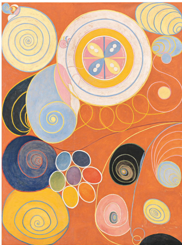
De tio största , nr 3, Ynglingaåldern, grupp IV, 1907

Mellan november 1906 och april 1908 skapades den första delen av Målningarna till Templet , bestående av 111 bilder i olika storlekar. Verken är indelade i serier och grupper, där olika aspekter av ett tema undersöks. Abstraktionen i denna första del av arbetet utgår ofta ifrån former som är hämtade från naturen. De tio största från 1907 skildrar människans fyra åldrar: barnåldern, ynglingaåldern, mannaåldern och ålderdomen. Vissa ord och växtformer kan urskiljas i de i övrigt abstrakta kompositionerna. Evolutionen från 1908 handlar om utveckling och processer, om hur världen och materian har uppstått ur anden. Mellan 1908 och fram till 1912 gjorde hon ett