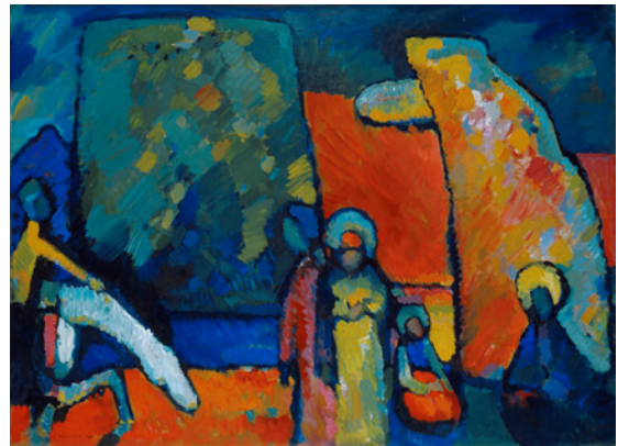
Wassily Kandinsky, Improvisation nr. 2. Sörgmarch , 1908 © Wassily Kandinsky/BUS 2013.

Kandinsky var till en början expressionist och lämnade stegvis den synliga verkligheten bakom sig. Han var intresserad av ockultismen och gav 1911 ut skriften Om det andliga i konsten . Malevitj kom via kubismen och futurismen fram till sina suprematistiska, abstrakta och i hög grad andliga bilder. Mondrian vände successivt ryggen åt gestaltandet av det som är synligt för ögat för att förenkla sina kompositioner till ett spel mellan vertikala och horisontella linjer, och till grundfärgerna rött, gult, blått samt vitt och svart. Som teosof sökte han efter ett rent andligt uttryck för de eviga idéerna bortom den synliga världen.