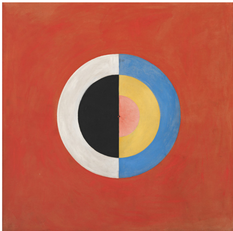
Svanen , nr 17, grupp IX/SUW, serie SUW/UW, 1915

I Hilma af Klints testamente står att de andliga verken inte fick göras tillgängliga för allmänheten förrän tidigast tjugo år efter hennes död. Hon var övertygad om att man först då skulle komma att inse deras betydelse. För hundra år sedan målade Hilma af Klint bilder för framtiden.