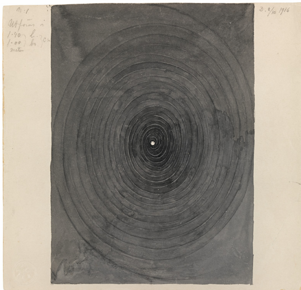
Nr 1, grupp I, serie Parsifal , 1916

Parsifal var enligt legenden en av riddarna kring runda bordet. Tillsammans med Kung Artur sökte han efter den heliga graalen. Själva graalberättelsen kan också sägas handla om sökandet efter andlig kunskap. Berättelsen är av central betydelse i den esoteriska traditionen, och togs också upp av Richard Wagner (1813–1883) i den operan Parisfal från 1882 som sattes upp på Kungliga Operan i Stockholm våren 1917.