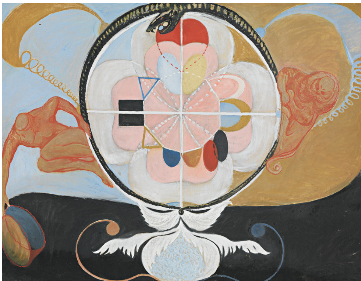
Evolutionen , nr 13, grupp VI, serie WUS/Sjustjärnan, 1908 © Stiftelsen Hilma af Klints Verk. Foto: Moderna Museet/Albin Dahlström

Altarbilderna är en sammanfattning av de tidigare serierna där själen rör sig neråt genom materien, för att sedan vända uppåt igen. Den liksidiga triangeln har en central plats i många kulturer och religioner. Triangeln som sträcker sig mot solen kan betraktas som en utveckling uppåt genom sfärerna, medan den omvända betecknar den motsatta processen. I mitten av den tredje och sista målningens cirkel är två trianglar sammansatta till en sexuddig stjärna. Stjärnan innesluter de fyra elementen – eld, vatten, luft och jord – och är en esoterisk symbol för universum.