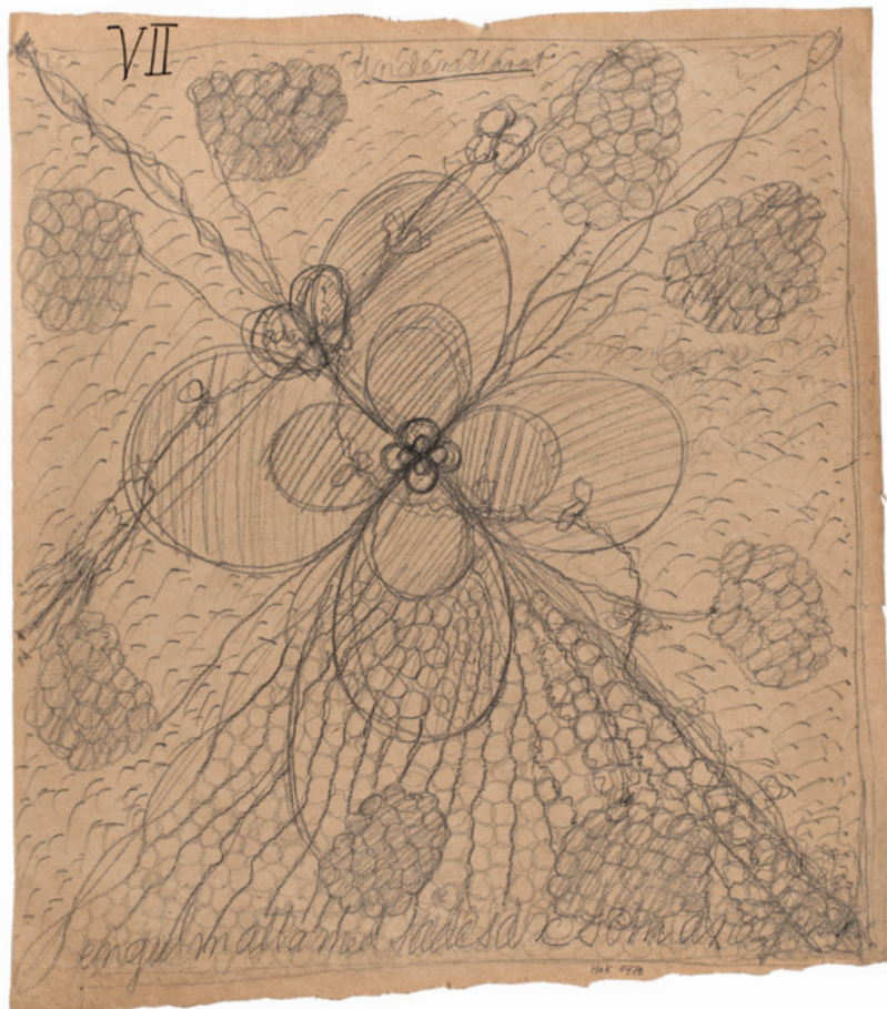
De Fem, titel saknas, u.å.

1896 bildade Hilma af Klint och fyra andra kvinnor gruppen ”De Fem”. De kom i kontakt med ”höga mästare” från en annan dimension. Det fördes noggranna protokoll över seanserna. I och med detta inleddes ett skifte i Hilma af Klints konst. Hon började öva sig i automatisk skrift, vilket innebar att hon inte medvetet styrde handens rörelser över papperet. Så småningom utvecklade hon också ett automatiskt tecknade, flera decennier före surrealisterna. Efter hand övergav hon det naturalistiska bildspråket och strävade bort från sitt skolade uttryck. Hon påbörjade en resa inåt, in i en värld som för de flesta är dold.