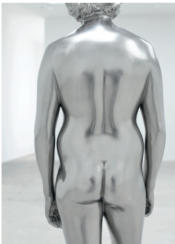
Charles Ray, Young Man (Ung man), 2012