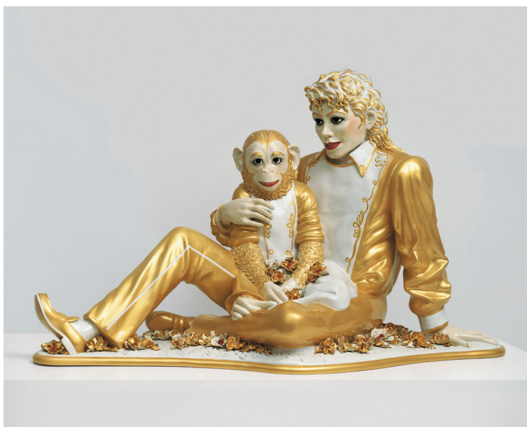
Jeff Koons, Michael Jackson and Bubbles (Michael Jackson och Bubbles), 1988

Stjärnan i Koons vittomtalade utställning Banalität från 1988, Michael Jackson och Bubbles (1988), är en av konstnärens mest minnesvärda skulpturer. Vad skulle kunna vara ett mer passande motiv för popkonstens nutida kung (Koons) än kungen av pop (Jackson)? Vad hade kunnat vara bättre för en konstnär som tagit rollen som den store ”smakutjämnaren”, än att utgå från ett reklamfoto och avbilda en popstjärna och hans tama schimpans som en dramatiskt uppförstorad porslinsfigur? Jeff Koons har sagt att han alltid älskat Michael Jacksons radikalitet; att Jackson skulle göra vad som helst för att kunna kommunicera med människor. Koons själv tycks vara lika radikal. I Michael Jackson och Bubbles har han fritt förenat Michelangelos Pietà med estetiken hos ett prydnadsföremål från en billighetsbutik för att förmedla magin i sitt motiv. Om Koons har axlat Andy Warhols mantel har han gjort det inte bara genom att förvandla sig själv till en kändis, utan även genom att tränga in under huden på kändiskulturen. Koons har, med sina egna ord, med Michael Jackson och Bubbles skapat en ”gudalik ikon”, men han visar oss också en tragisk figur: Jacksons vitfärgade ansikte föregriper både stjärnans strävan efter att genom operationen uppnå ett ideal och hans för tidiga död.