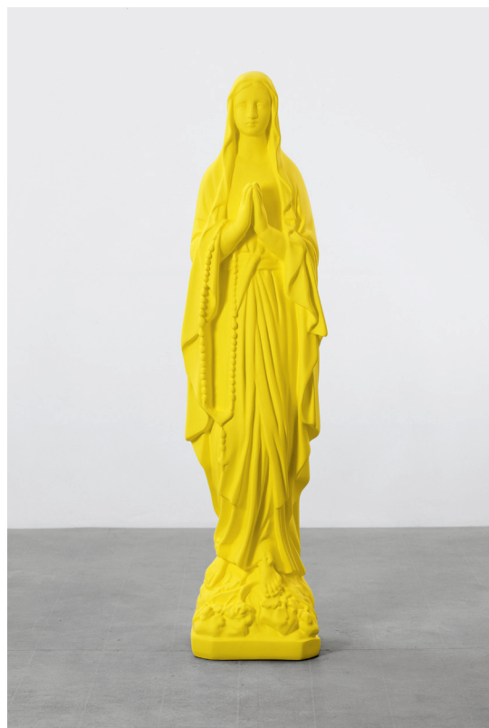
Katharina Fritsch, Madonnenfigur (Madonna) , 1987