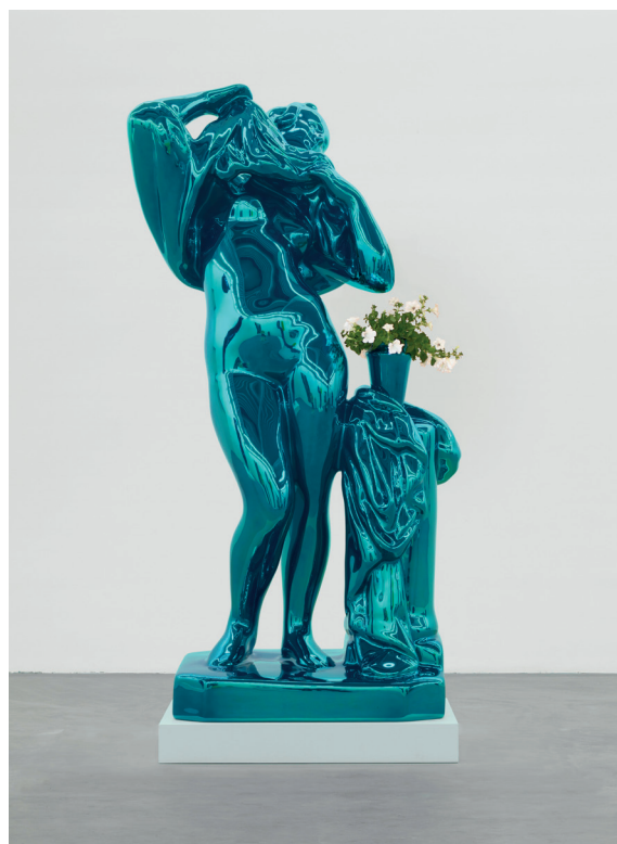
Jeff Koons, Metallic Venus (Metallisk Venus), 2010–12