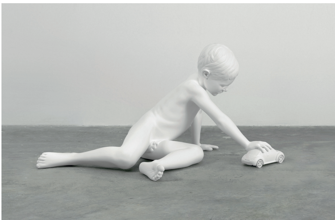
Charles Ray, The New Beetle (Den nya Bubblan), 2006

Skulptur efter skulptur för samman verk av Katharina Fritsch (f. 1956), Jeff Koons (f. 1955) och Charles Ray (f. 1953). Dessa tre konstnärer har alla förnyat skulpturen. Den tredimensionella konsten utvecklades under 1900-talet mot allt större upplösning; från abstraktion till 1990-talets rumsliga och sociala experiment. I denna tid har Fritsch, Koons och Ray trotsat konventionerna och skapat skulpturala verk som är öppet återgivande och rent av föreställande. Man kan säga att den konst som visas i Skulptur efter skulptur är gjord efter det som har beskrivits som skulpturens död, och den är även gjord efter i en annan bemärkelse. Den är nämligen ett slags efterbildning av just den konstform som den förnyat. Denna utställning vill berätta historien om hur Fritsch, Ray och Koons har utvecklat 1900-talets formexperiment till en komplex skulptur för 2000-talet.