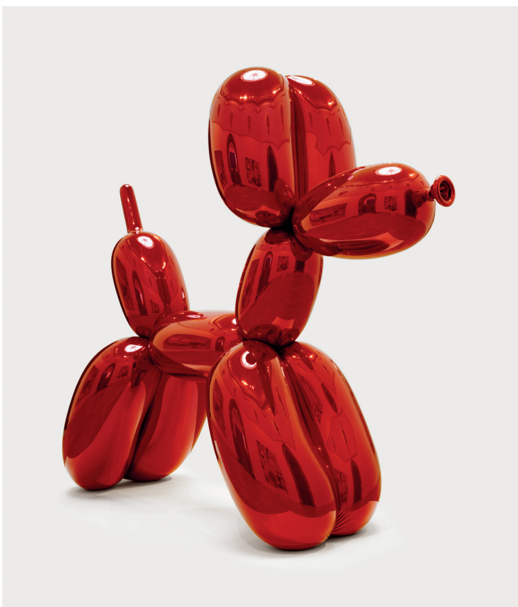
Jeff Koons, Balloon Dog (Red) (Ballonghund (röd)), 1994–2000

Skapa en modell till en skulptur som du skulle vilja låta tillverka i stort format. Arbeta med funna föremål, med lera, modellera, gips eller annat material. Skissa hur skulpturen skulle kunna se ut i stort format och placerad i ett sammanhang, exempelvis på ett museum eller i en stadsmiljö. Skriv en kort text där du berättar hur du har tänkt.