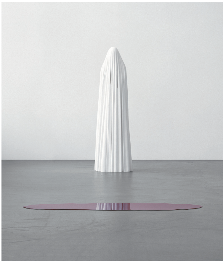
Katharina Fritsch, Geist und Blutlache (Spöke och blodpöl), 1988

Popkonsten har betytt lika mycket för Katharina Fritsch som för Jeff Koons. På samma sätt som hennes lysande gula Madonna (1987) förvandlar en kitschig religiös souvenir till ett genuint föremål att förundras över, är Spöke och blodpöl (1988) på en gång en Halloweenkliché och en kuslig uppenbarelse. Konstnären har sagt att hon har eftersträvat en verklighet som är ”verkligare än verklig”, och det är omsorgen om enskildheterna i verken – storleksförhållandena, stiliseringen och utsuddandet av figurativa detaljer – som möjliggör hennes trolleri. Att stöta ihop med Jungfru Maria på väg till bankomaten är utan tvivel avväpnande, och det är det även att se ett spöke.