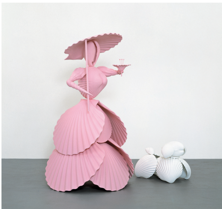
Katharina Fritsch, Frau mit Hund (Dam med hund), 2004

De tidigaste verken i Skulptur efter skulptur kan fortfarande uppfattas som readymades, men de är readymades som bearbetats radikalt. De hittade föremålen befinner sig långt från Duchamps cykelhjul eller pissoar och uppträder i sällsamt omarbetad (om inte fullständigt omgjord) skepnad. Antingen verken är efterbildningar av redan existerande objekt (som Koons glittrande monument Ballonghund från 1994–2000 eller Fritschs Dam med hund från 2004, som fantasifullt omvandlar ett stycke krimskrams till en skapelse i mänsklig storlek), eller (som i fallet med Rays Den nya Bubblan från 2006) lämnar readymaden därhän till förmån för en direkt återgivning ur livet, så uppvisar de alla ett stort intresse för det hantverksmässiga. Med hjälp av dagens avancerade teknologi når detta intresse för perfektionen sin höjdpunkt i Koons fabriksliknande ateljé, där en hord medhjälpare arbetar i skift dygnet runt. Charles Ray säger att han vill att vi ska ”hålla andan” inför konstföremålet, och samma sak tycks gälla också för de båda andra skulptörerna.