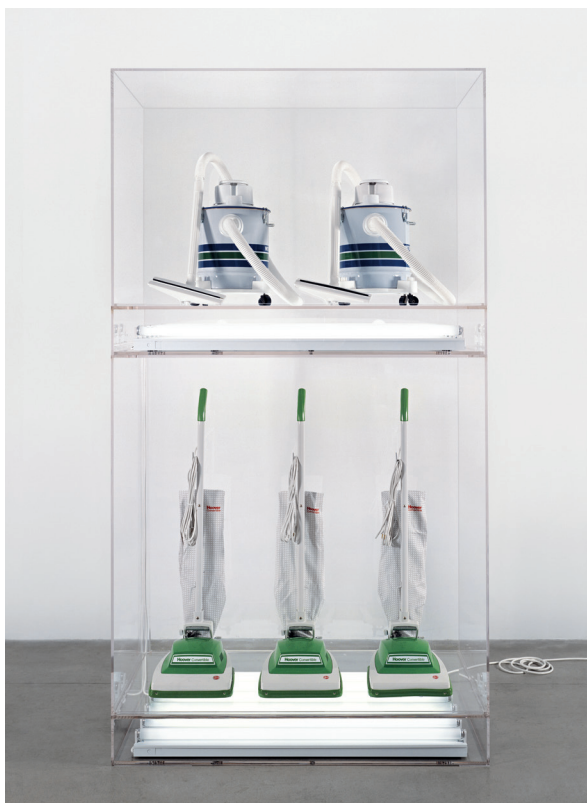
Jeff Koons, New Hoover Convertibles, New Shelton Wet/Dry 5-Gallon, Doubledecker (Nya Hoover Convertibles, Nya Shelton Wet/Drys 5-Gallon, Doubledecker ), 1981–1987

Konstens möte med skyltfönstret är ett bärande tema i den moderna konsten. När Jeff Koons epokgörande serie The New (här representerad av Nya Hoover Convertibles , Nya Shelton Wet/Drys 5-Gallon , Doubledecker 1981–1987) presenterades på New Museum of Contemporary Art på Manhattan ställdes verken ut i museets skyltfönster på den starkt trafikerade 5th Avenue. Katharina Fritschs Madonna (1987) såg dagens ljus på en öppen plats i Münster i Tyskland, med konstnärens egna ord ”mellan kyrkan och skyltfönstret”. Charles Ray har skapat en serie verk som bygger på den vanliga skyltdockan. Rays kommersiella kloner – i utställningen representerade av en version av hans numera legendariska Höst '91 (1992) – utvecklade minimalismens serialitet och popkonstens upprepningar och slog in på en väg som ledde bortom den gängse uppfattningen av att konsten i och med minimalismen nått ett slutstadium och inte handlade om något annat än om sig själv.