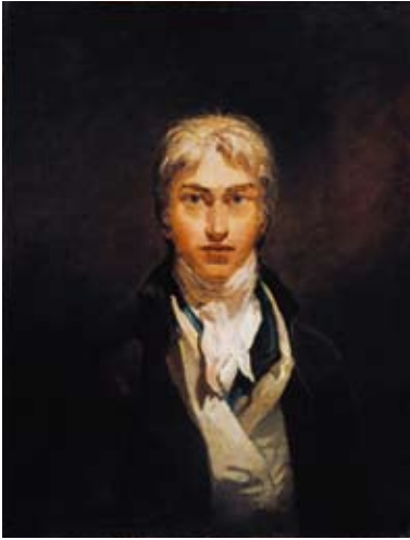
J.M.W. Turner, Självporträtt , ca 1799