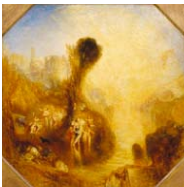
J.M.W. Turner, Bacchus and Ariadne , ca 1840 © Tate, London 2011