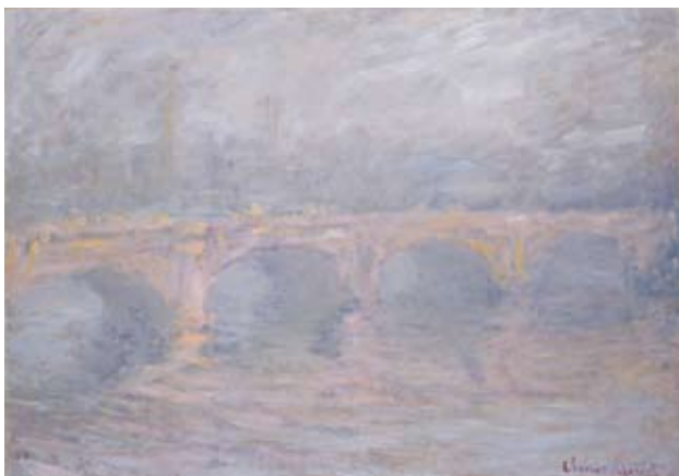
Claude Monet, Waterloo Bridge, aftonrodnad , 1904