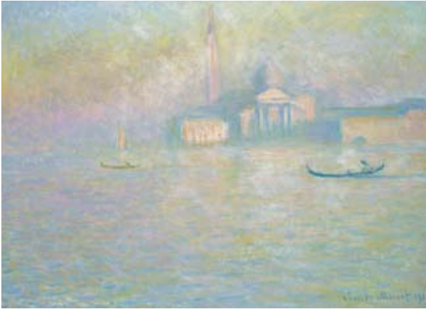
Claude Monet, San Giorgio Maggiore , 1908