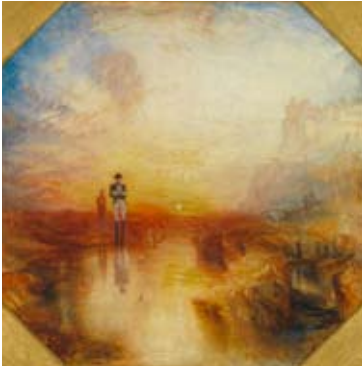
J.M.W. Turner, Krig. Den landsförvisade och stenkistan , 1842