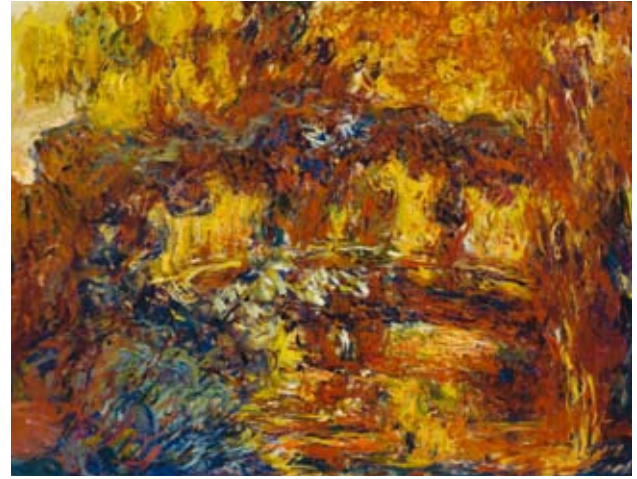
Claude Monet, Den japanska bron , ca 1920–22

glider mot undergången, formerna upplöses och höljs i dimmans och havets silvertoner.