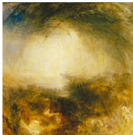
J.M.W. Turner, Skugga och mörker – Syndaflodens afton , utställd 1843