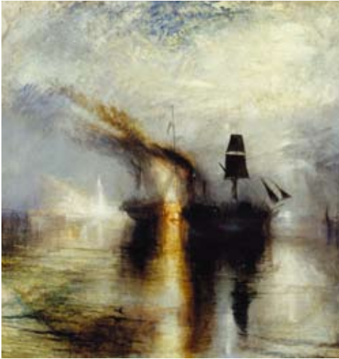
J.M.W. Turner, Fred. Begravning till havs , utställd 1842

i en sonett av John Keats i färgen. Förutom den mänskliga tragedin är också Twomblys tema naturens kraft och raseri.