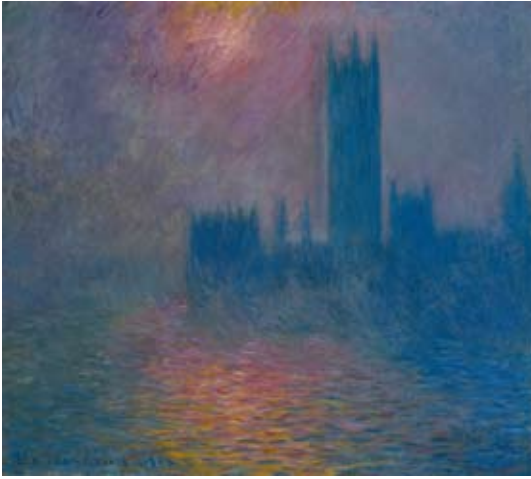
Claude Monet, London, Parlamentsbyggnaden. Solljus bryter igenom dimman , 1904