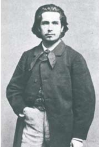
Porträttfotografi av Monet, av Etienne Carjat i Paris ca 1864