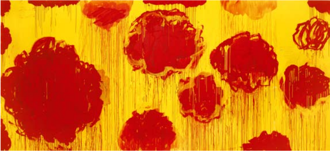
Cy Twombly, Utan titel , 2007

© Cy Twombly Foundation. Foto: Robert McKeever