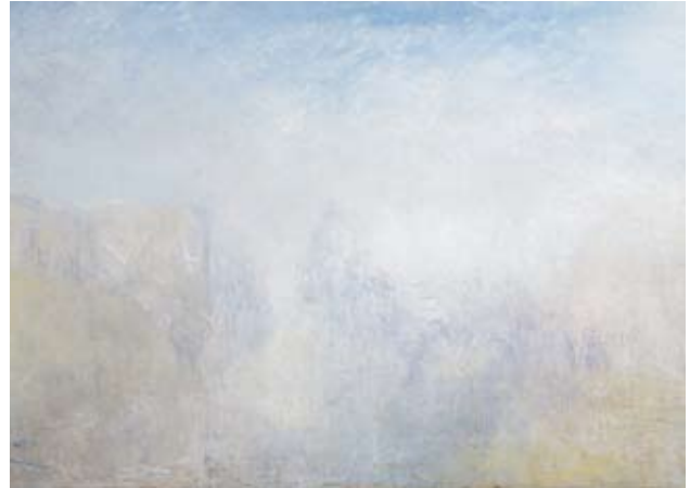
J.M.W. Turner, Venedig med Salutekyrkan , ca 1840–45