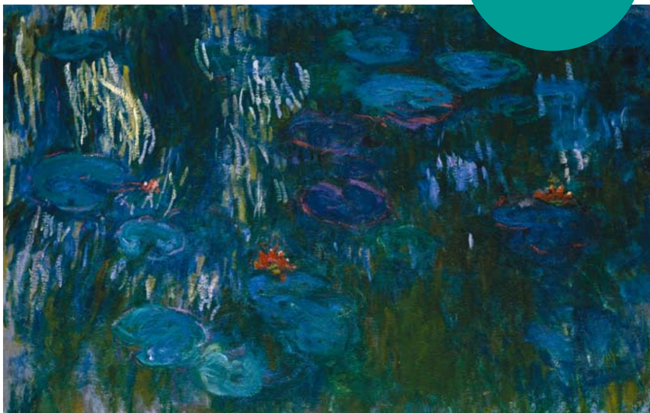
Claude Monet, Näckrosor , efter 1916

Handledningen riktar sig i första hand till lärare i åk 7–9 och gymnasiet