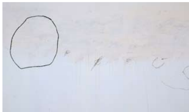
Cy Twombly, Orfeus , 1979 © Cy Twombly Foundation