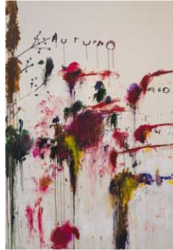
Cy Twombly, Quattro Stagioni (en målning i fyra delar), Del III: Autunno , 1993–95

Även i de sena Venedigmålningarna, som Turner utförde efter sin sista resa dit 1840, råder en melankolisk stämning. Monets målningar från samma stad på-