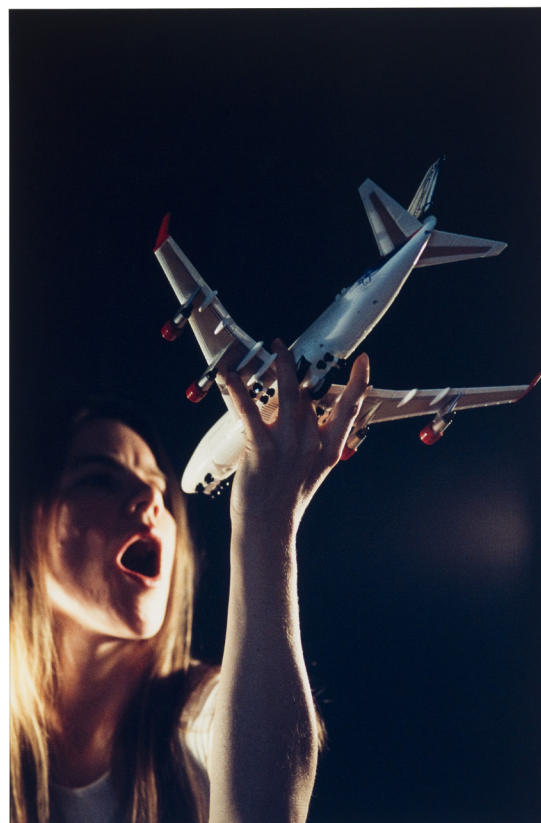
I Am the Runway of Your Thoughts , 2008