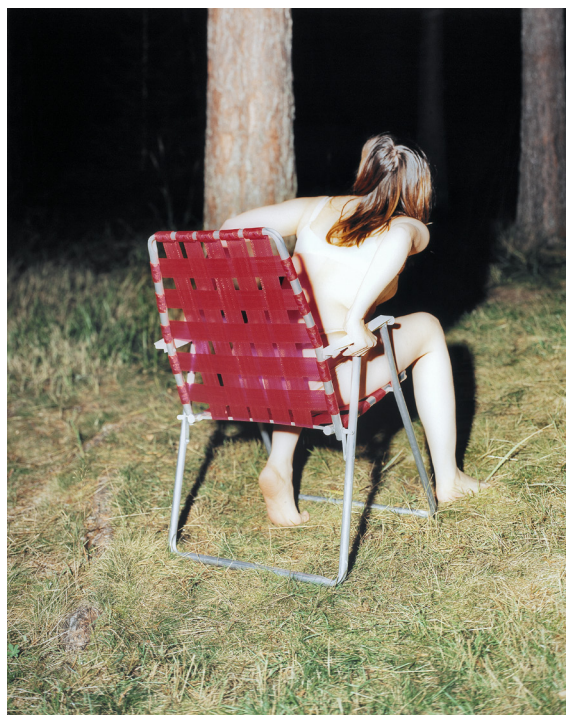
Varje rörelse bär på sin motsats , 2002

SYFTE: Att stimulera fantasin och använda det skrivna språket för att skapa en historia utifrån en bild.