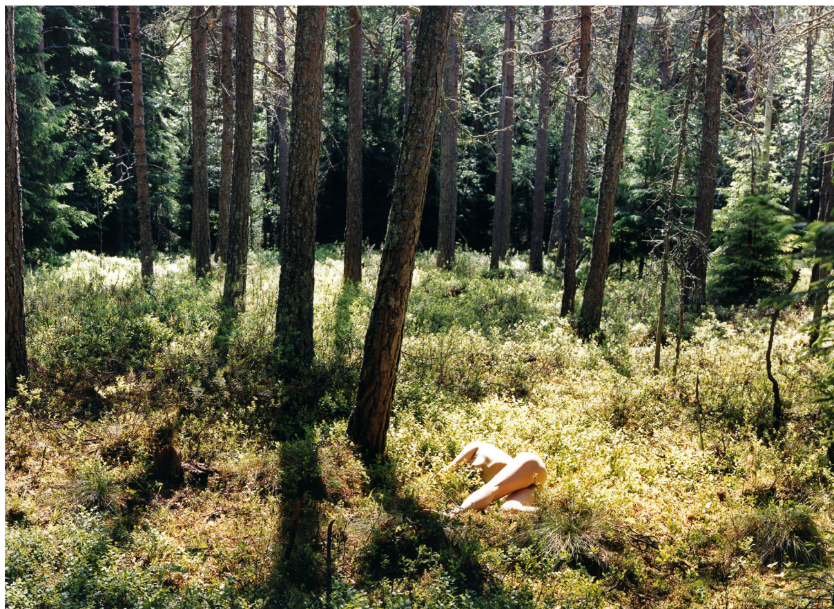
Tillbaka till naturen , 1993