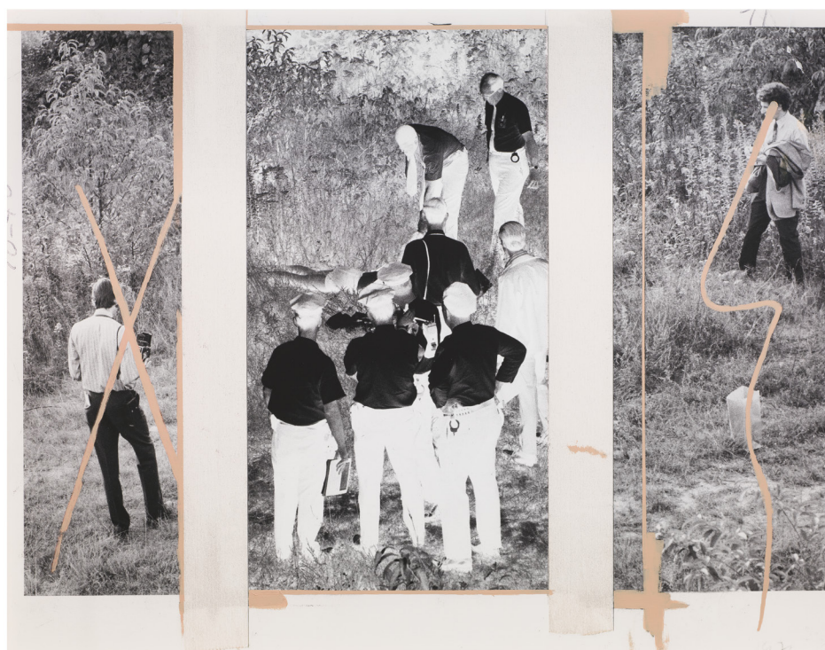
The Photographer , 2015