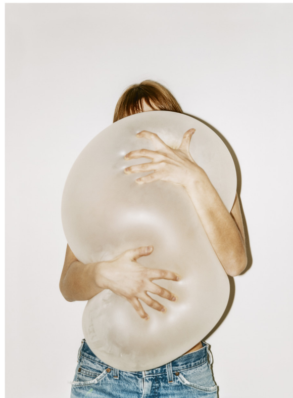
Försök att hålla ordning på tid och rum, 1997/2001

SYFTE: Att öva sig i att analysera bilder och utveckla förståelse för vissa ord och begrepp som kan användas för att kunna samtala om bilder. Att lyssna till och respektera andras åsikter och tankar.