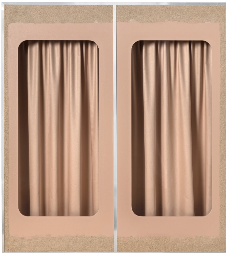
Esoteric Forensic , 2007