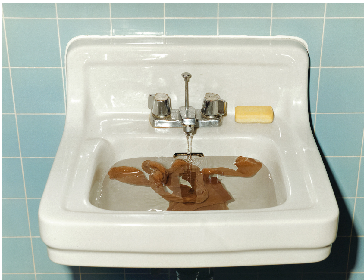
Allting hänger ihop ha, ha, ha , 1999

När Annika Elisabeth von Hausswolff 1999 representerade Sverige vid konstbiennalen i Venedig med ett antal stora blanka färgfotografier tycktes de vara som gjorda för den ljusa, modernistiska nordiska paviljongen. Men skenet bedrog. Fotografiernas komposition är lika tydlig som byggnadens arkitektur men motiven är dunkla, drömlika, fyllda av begär. Ytan kontrasterar mot de oglamorösa miljöer som utgör rum och scen i verken. De verk som ställdes ut i Venedig befäste och vidareutvecklade von Hausswolffs idéer. Här visades nya suggestiva bilder, vissa med psykoanalytiska teman, däribland Allting hänger ihop ha, ha, ha (1999) som baseras på ett barndomsminne av moderns nylonstrumpbyxor blötlagda i handfatet. Det humoristiska blev ett inslag. En inspiration från surrealistisk fotografi kunde också skönjas nu; von Hausswolff var bland annat intresserad av den tyske fotografen Hans Bellmers arbeten från 1930-talet då han fotograferade dockor utan huvud i sexuella situationer och andra surrealistiska motiv.