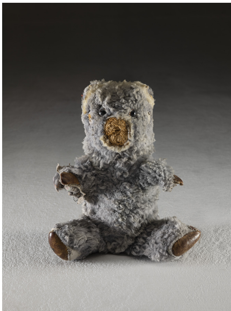
The Body of Anthropocene , 2020