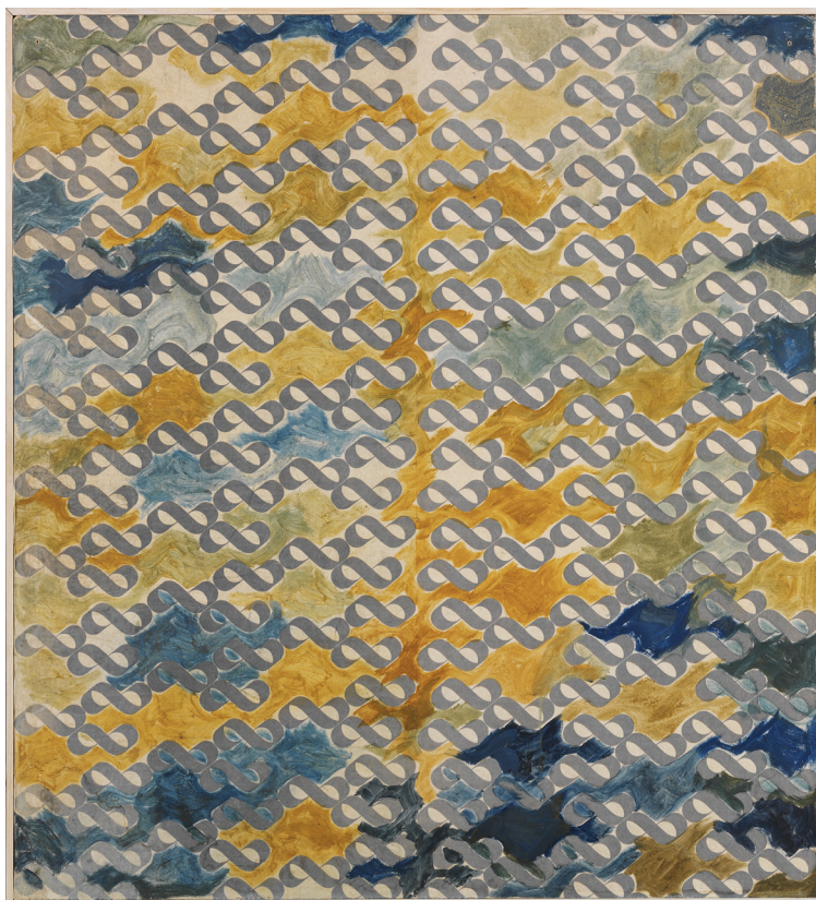
Björn Lövin, Äggoljetempera på Konsums omslagspapper , 1971 © Björn Lövin

SYFTE: Att öva sig i att analysera bilder och utveckla förståelse för vissa ord och begrepp som kan användas för att kunna samtala om bilder. Att lyssna till och respektera andras åsikter och tankar.