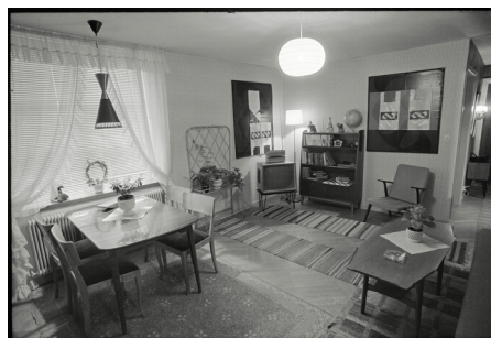
Björn Lövin, Konsument i oändligheten och "Herr P:s penningar". Installationsbild, Moderna Museet, 1971 © Björn Lövin Foto: Erik Cornelius