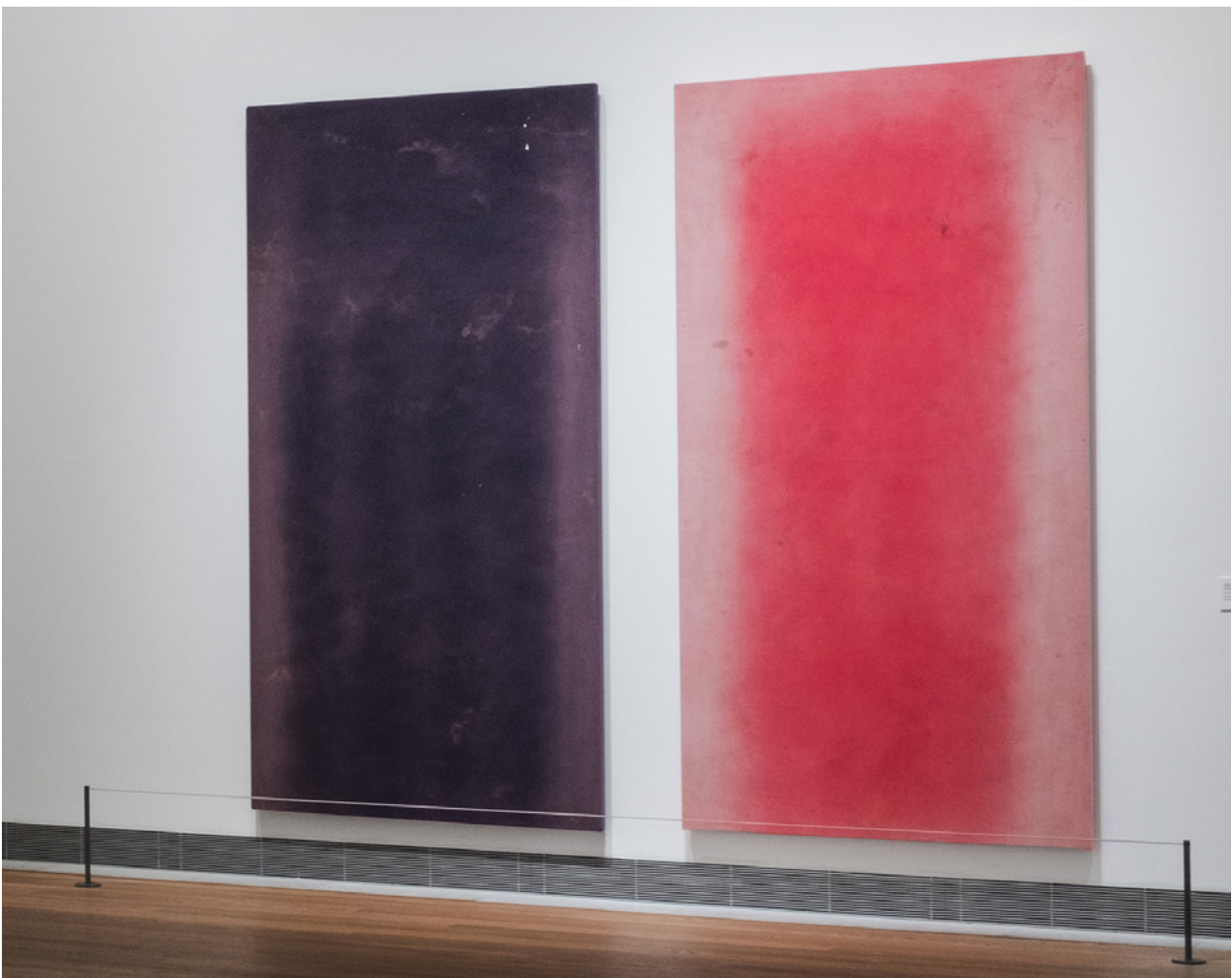
Ayan Farah, RA, 2013–2018

Finns det platser och minnen som du själv bär inom dig?