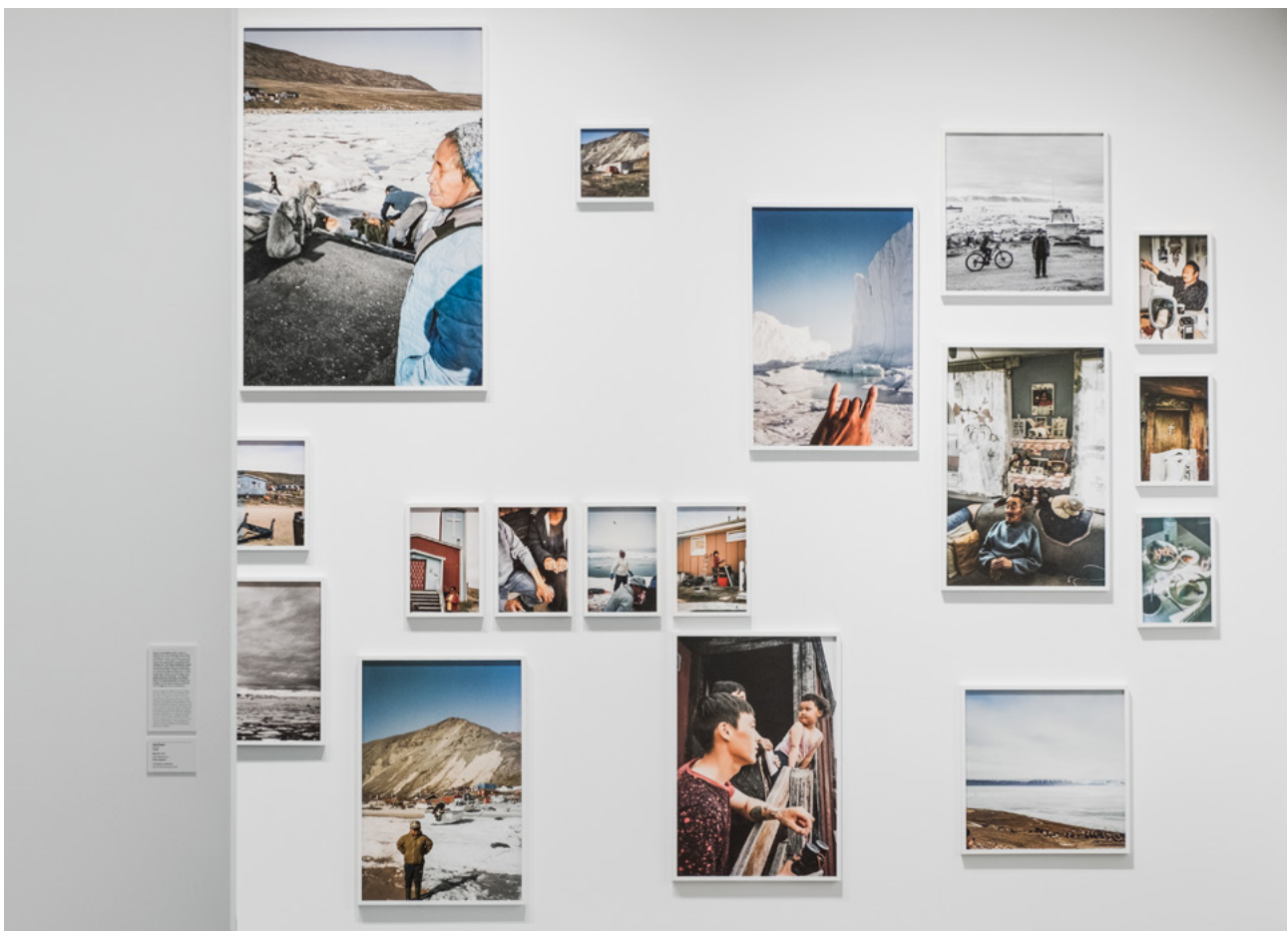
Inuuteq Storch, Soon Will Summer Be Over (Venice Edition) , 2023

Tänk dig att museet bara kan bevara ett mycket begränsat antal verk och föremål från vår tid. Vad tycker du ska sparas? Varför just dessa verk eller uttryck?