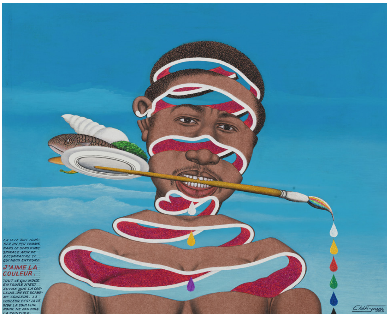
Chéri Samba, J'aime la Couleur , 2005

Konst kan synliggöra orättvisor, utmana normer och ge röst åt dem som sällan hörs. Hur? I det här temat möter vi verk som gör motstånd på olika sätt – genom berättelser, språk, gemenskap och symboler. Konstnärerna undersöker maktens strukturer och tar tillbaka rätten till sina erfarenheter, kroppar och bilder. Tillsammans visar verken hur konst kan vara både protest, vittnesmål och läkande kraft.