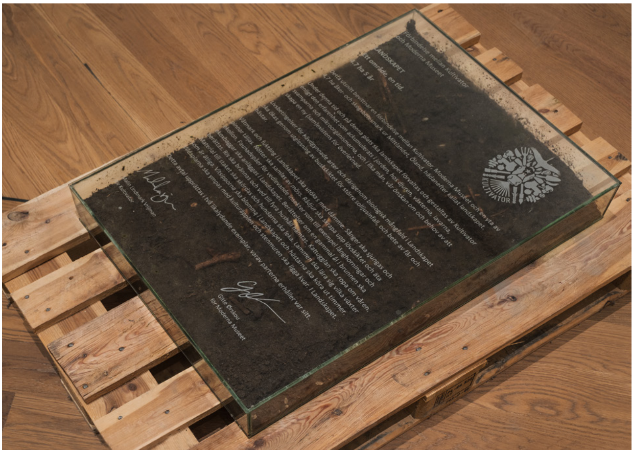
Kultivator, Landskapet , 2021–

Vad innebär det att det är naturen som formar ett konstverk?