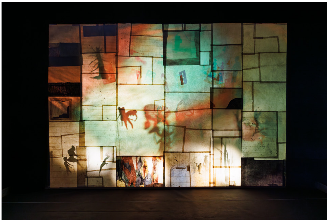
Jockum Nordström, The Anchor Hits the Sand , 2019

Vilka bilder, minnen eller känslor väcks hos dig när du upplever verket?