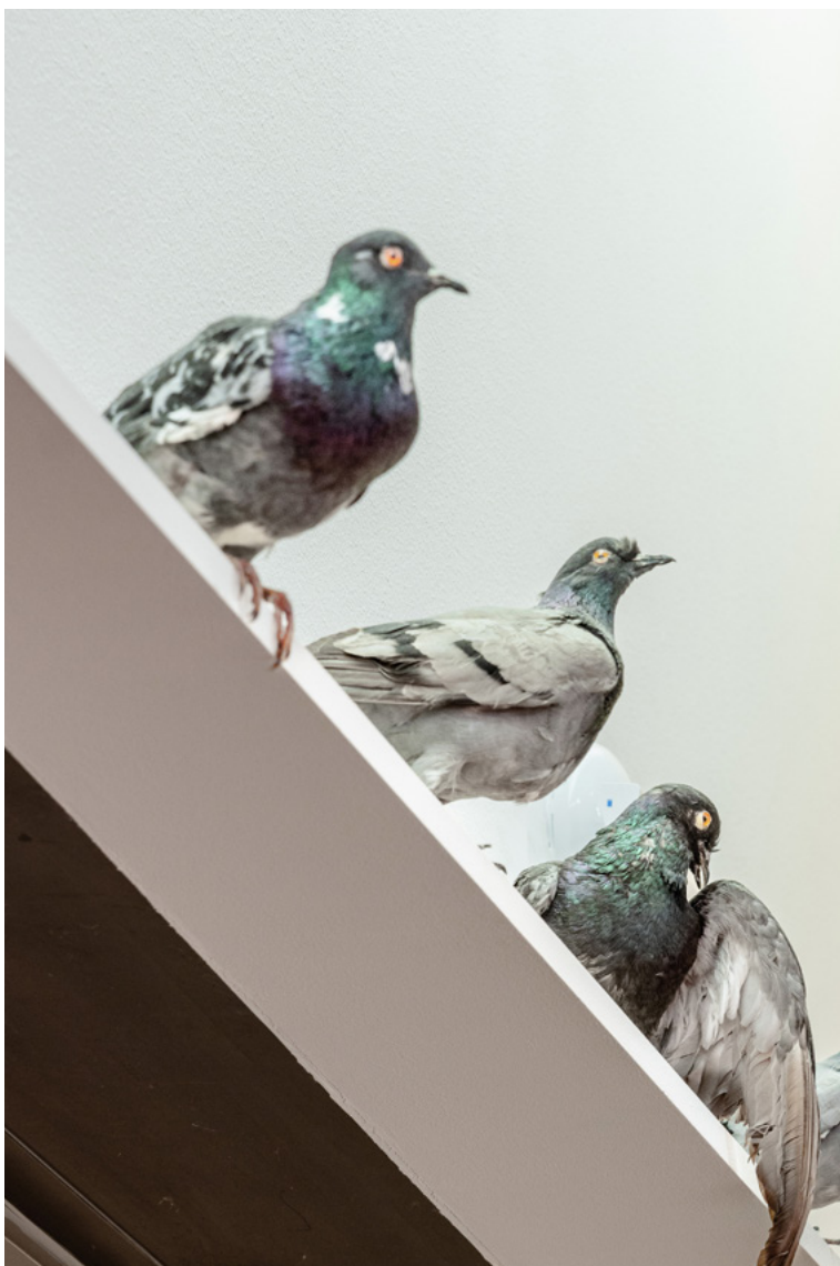
Maurizio Cattelan, Ghosts , 2021

Duvor förknippas ofta med fred och frihet, men också med något smutsigt, vardagligt och oönskat. I Ghosts framstår de som spöklika vittnen, varken helt levande eller döda. Cattelan använder ofta humor och obehag sida vid sida för att rubba invanda maktordningar. Här tycks blicken vändas tillbaka mot publiken – som om vi också blir betraktade.