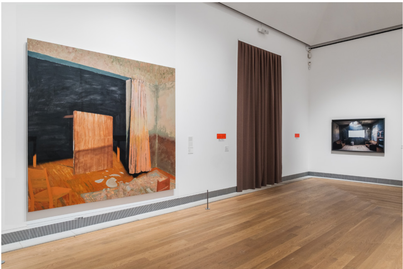
Installationsvy, Konsten att samla . Från vänster till höger:

HISTORIA: historiebruk, kollektiva minnen, olika perspektiv på skeenden.