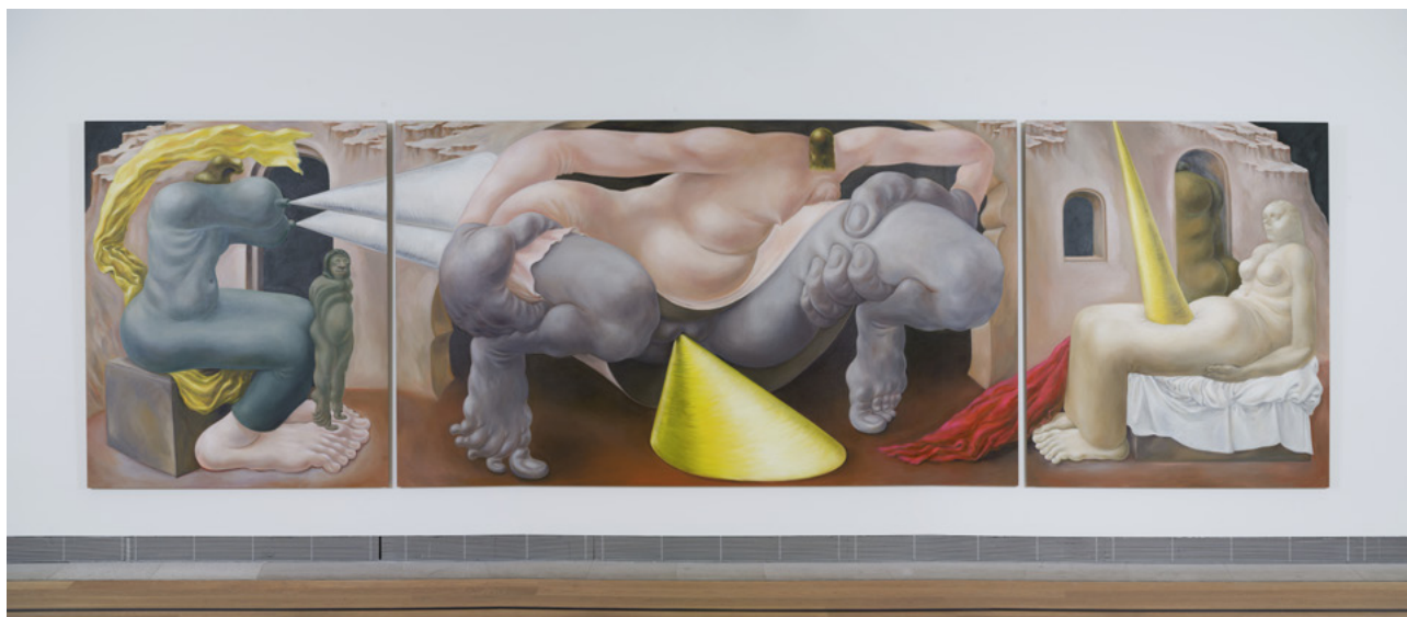
Louise Bonnet, Pisser Triptych , 2021

© Louise Bonnet 2026. Foto: Tobias Fischer, Moderna Museet