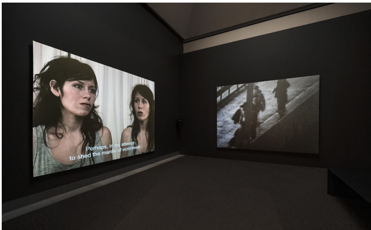
Anna Odell, Okänd kvinna 2009–349701 , 2009

Observera: Verket berör psykisk ohälsa. Om du eller någon i gruppen behöver stöd kan du kontakta Mind eller ringa 90101 (dygnet runt).