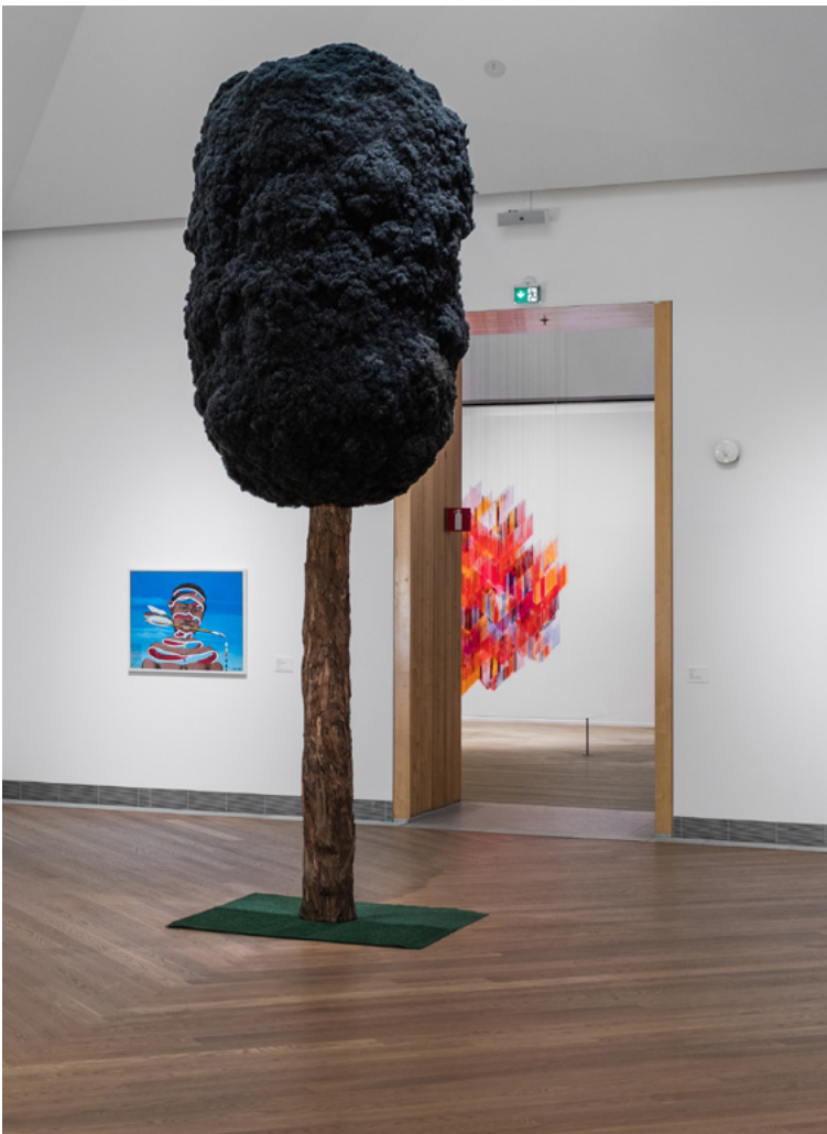
Installationsvy, Konsten att samla

Henry Taylor kallar sin metod för ”jakt och samlande”. Vad kan det betyda när det gäller att skapa konst?