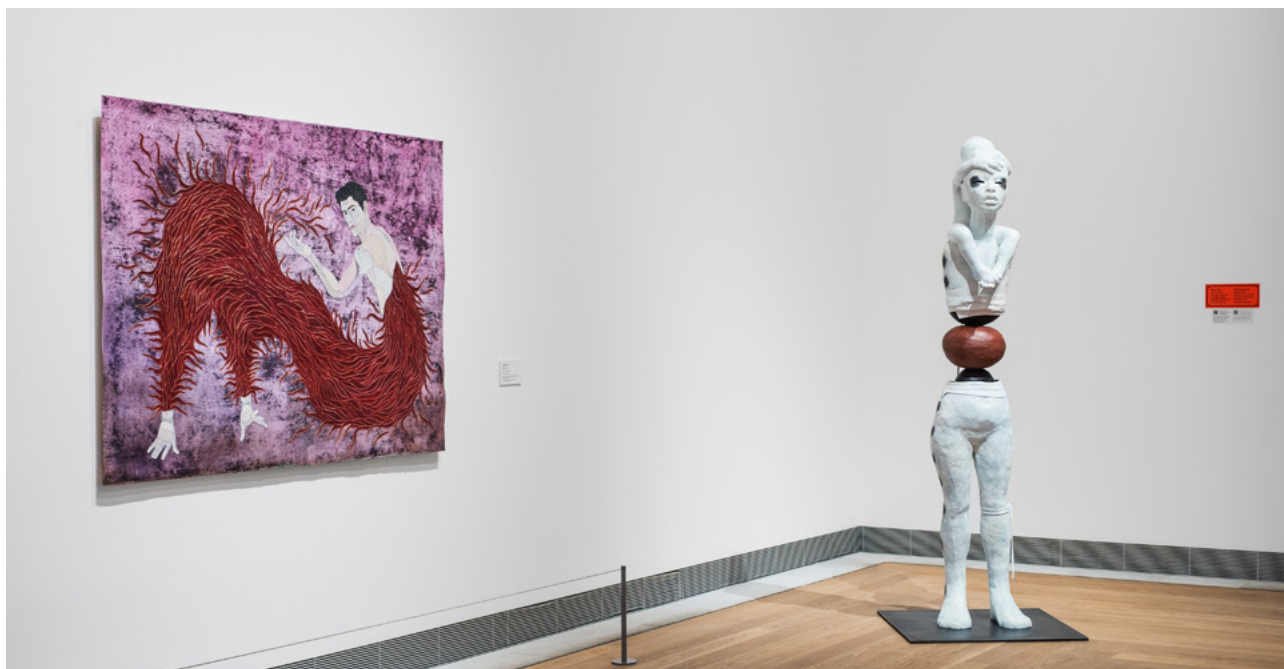
Installationsvy, Konsten att samla . Från vänster till höger:

https://www.modernamuseet.se/ stockholm/sv/om-museet/kontakt/ nyhetsbrev/