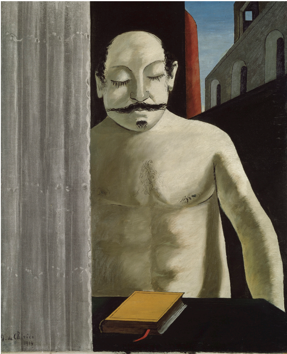
Giorgio de Chirico, Barnets hjärna , 1914

Ägd av författaren till det surrealistiska manifestet, André Breton, fram till 1967 då den köptes in till Moderna Museets samling. Kallad Gengångare tills 1927, då poeten Louis Aragon gav målningen en mer surrealistiskt klingande titel. Mannen med den karakteristiska mustaschen förekommer också i målningar av Max Ernst och Pablo Picasso.