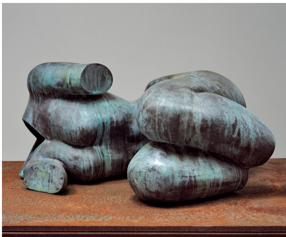
Bronzefrau Nr. 7 , 2001

Thomas Schütte använder sig av och utmanar konsthistoriska genrer, klassiska ämnen och tekniker. Motivet i serien Frauen – den nakna, vilande kvinnokroppen – har gott om systrar i konsthistorien, ofta skildrade av manliga skulptörer, som Auguste Rodin (1840–1917), Pablo Picasso (1881–1973) eller Henry Moore (1898–1986). Schütte är som många skulptörer fascinerad av olika material och deras egenskaper, och av hur tredimensionella kroppar eller volymer kan skapas i rummet. Kropparna i serien Frauen är högst fysiska, men samtidigt är volymerna ibland synligt ihåliga och gestalterna kraftigt deformerade.