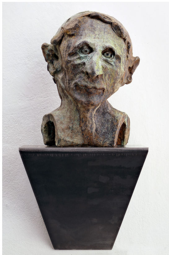
Wicht , 2006 © Thomas Schütte 2016.

De tolv huvudena i Wichte (2006) är mindre i formatet. Det är en serie besynnerliga fysionomier som tittar ner på oss. Som så ofta hos Schütte kan referenser till tidigare konstepoker anas, här de så kallade grotesker som smyckar många äldre hus. Schüttes Wichte skiftar i uttryck; några blickar vänligt, andra ser vilande och meditativa ut, vissa är hålöga.