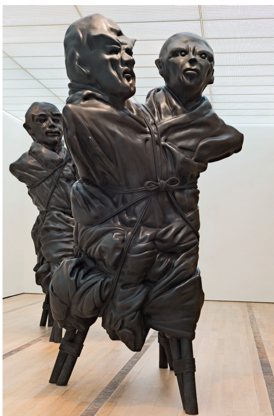
United Enemies , 2011 © Thomas Schütte 2016.

Figurernas huvuden är av plastbaserad modellera och fastsatta på trästickor. Individerna har bundits hårt ihop i par och placerats under glashuvar på piedestaler. Skulpturerna är mångtydiga. Ordet ”united” antyder gemenskap och till och med försoning, men föreningen förefaller påtvingad. Enligt Schütte togs titeln från en internationell klädkedjas annonskampanj på temat United Colors, och gestalterna var personer han sett på gatan. När han tjugo år senare återvänder till motivet är ”fienden” förstörd till en skala bortom den mänskliga gestaltens, och figurerna gjutna i ett av konsthistoriens mest traditionella material: brons.