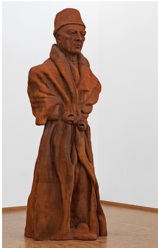
Vater Staat , 2010

Thomas Schütte anknyter här till ett format som är tyngt av tradition – den monumentala skulpturen. Sådana har genom tiderna rests som hyllning till heroiska bedrifter, kungar och makthavare, för att påminna om och ena nationer kring en stolt historia. Idag, då envåldshärskare förevigade som statyer snarare rivs ned i kollektivt raseri, är den monumentala statyn som konstgenre ifrågasatt. När Schütte tar sig an formatet gestaltar han statsmakten som en bakbunden gammal man, på samma gång auktoritär och sårbar.