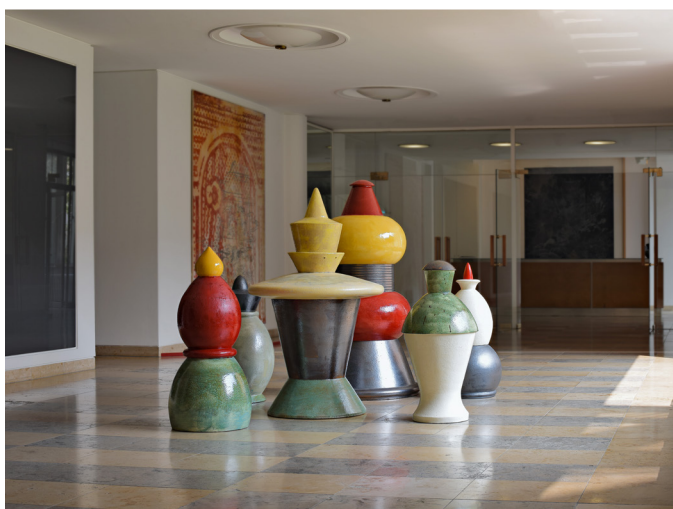
Gartenzwerge , 2015–16

I serien Walser Drawings hyllar konstnären den schweiziske författaren Robert Walser (1878–1956), vars karaktärer har dubbeltidigheten gemensam med många av Schüttes figurer, liksom spelet mellan underdånighet och poetisk frihet.