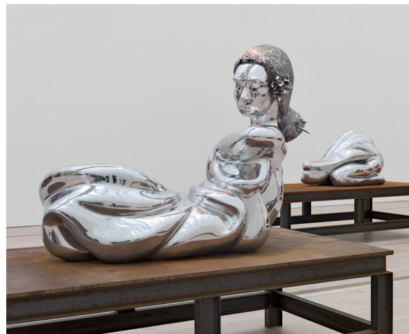
Aluminiumfrau Nr. 17 , 2009

© Thomas Schütte 2016.