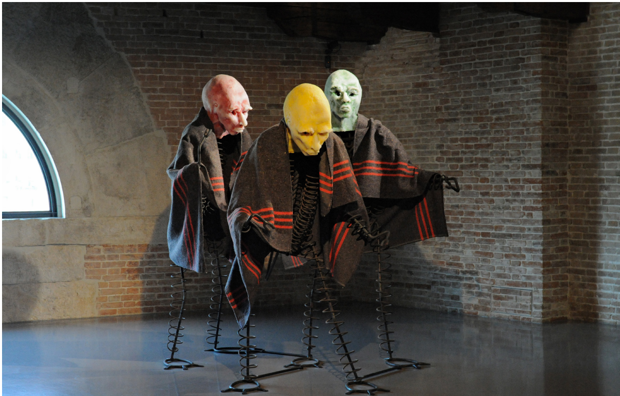
Efficiency Men , 2005

Figureerna är sammankedjade med varandra vid fötterna så att rörelseförmågan är begränsad. Om de förflyttade sig skulle stegen behöva vara små och koordinerade. De verkar bräckliga och sorgsna, men det vilar ändå något obevekligt över deras stirrande ansikten. Dessa ”effektiva män”, Efficiency Men , har också beskrivits som en kommentar till de internationella investmentbolag som vid tiden då verket gjordes profiterade på den tyska industrin och ställde krav på ökad effektivitet utan att ta något socialt ansvar.