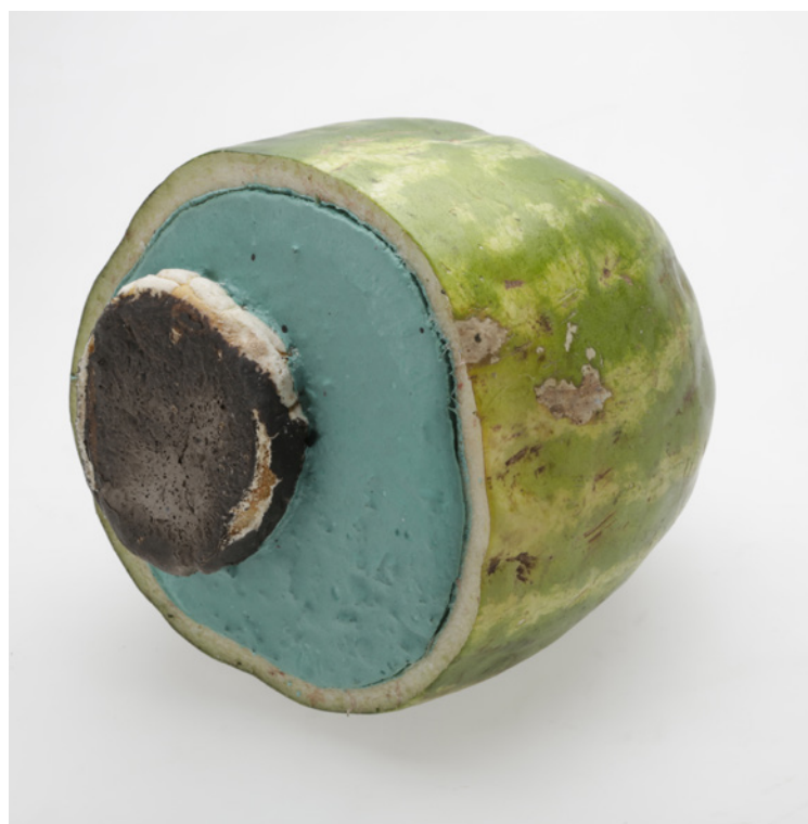
Adrián Villar Rojas, Los teatros de Saturno (The theaters of Saturn) , 2014 (detalj), 2014

Skapa något i lera och låt de obrända skulpturerna utsättas för väder och vind under ett par veckor. Dokumentera processen (fotografera, filma och/eller beskriv med ord).