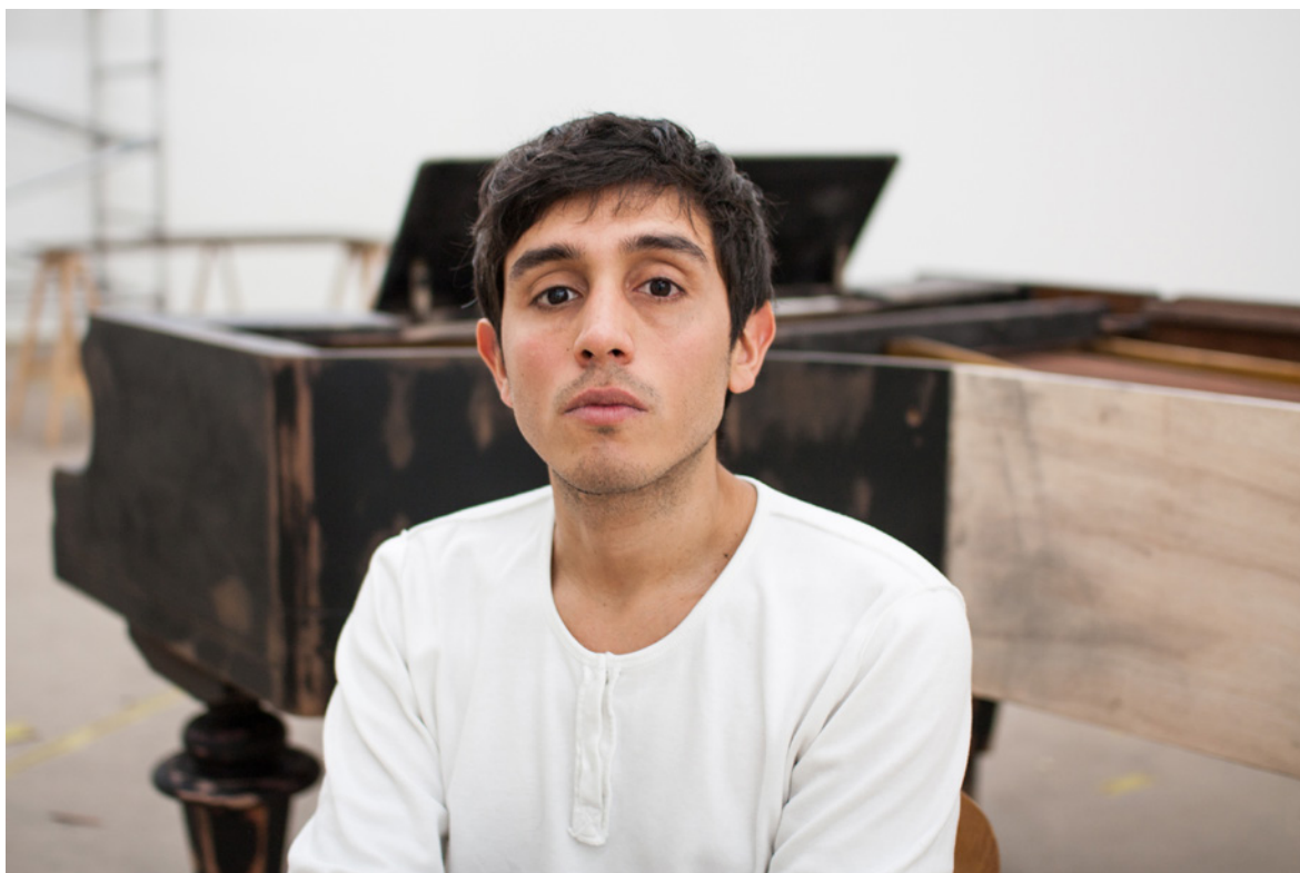
Adrián Villar Rojas, 2013.

Villar Rojas är mest känd för sina platsspecifika, ofta monumentala verk i obränd lera och andra organiska material, som får förändras, gro eller falla sönder. Han är baserad i Rosario, Argentina, men arbetar på ständigt resande fot med en grupp medarbetare. Efter det inledande konceptuella arbetet inför ett projekt ställs ett team samman, som ibland arbetar månader i sträck på den aktuella platsen. Flera av medarbetarna har en bakgrund som konstnärer och hantverkare; var och en bidrar till processen utifrån sin kreativitet. Villar Rojas förskjuter dynamiken i sin nomadiska ateljé till att närma sig en teaterscen eller filminspelning, och har själv beskrivit sin roll som konstnärlig ledare eller regissör. Han rollsätter och skriver in medarbetarna