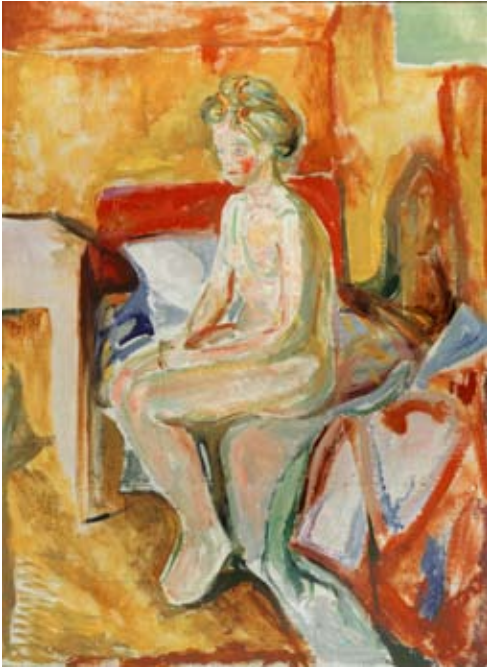
Edvard Munch, Flicka sittande på sängkanten , 1916. Edvard Munch © Munch-Museet/Munch-Ellingsen- gruppen/BUS 2010.