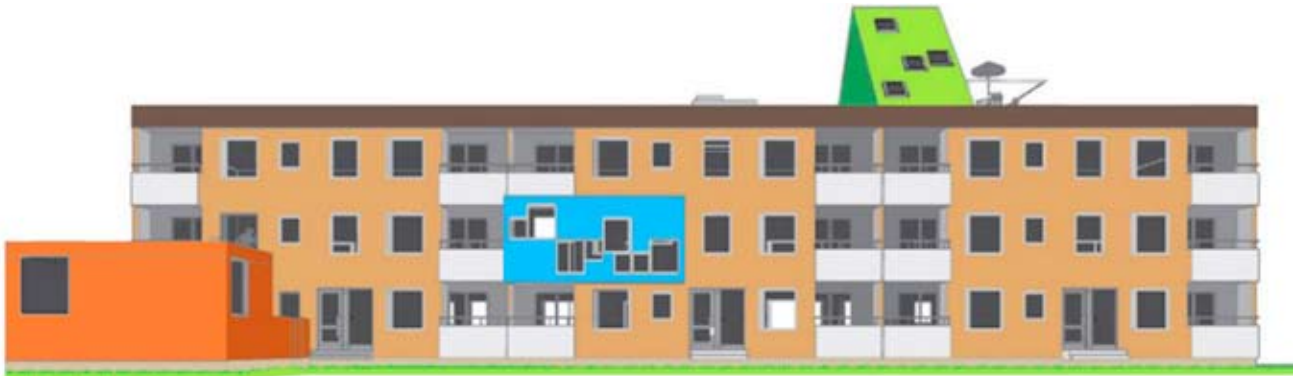
Per Hasselberg, Småstugebyrån , 2009, skiss/diskussionsunderlag. Arkitekt: Linus Romberg