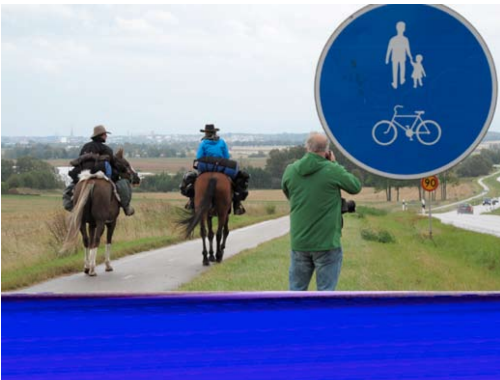
Ann-Sofi Sidén, Mitt land (Någonstans i Sverige) , 2009 © Ann-Sofi Sidén Courtesy Galerie Barbara Thumm och Christian Larsen. Video filmad av: José Figueroa, Paul Giangrossi 2009.

Det du håller i din hand är en kortfattad introduktion till utställningen och ett fåtal av konstverken. Den är tänkt att inspirera och ge idéer till hur man kan arbeta med utställningen inom ramen för några av skolans ämnen, nämligen samhällskunskap, svenska och religion. Naturligtvis är det fullt möjligt att välja helt andra verk och arbeta inom andra skolämnen än de som här föreslås. Framför allt riktar sig materialet till dig som undervisar skolår 7–9 och på gymnasiet.