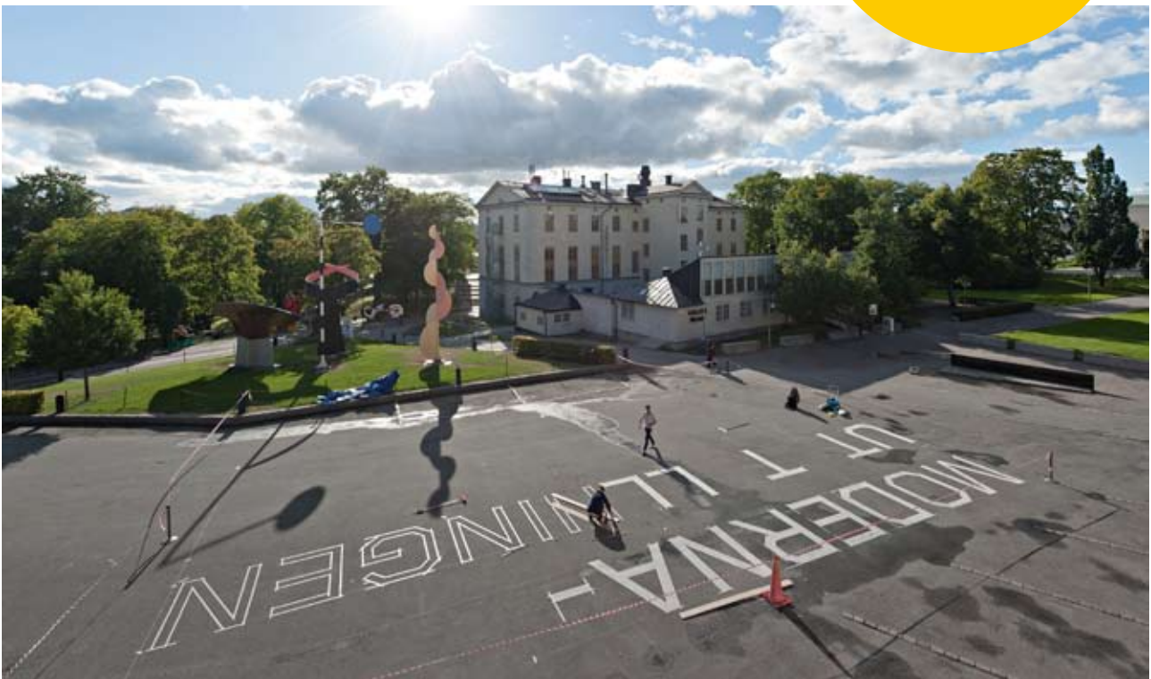
Exercisplan, Skeppsholmen.

Handledningen riktar sig i första hand till lärare på högstadiet och gymnasiet