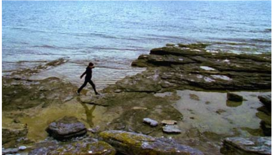
Sara Jordenö, Personaprojektet: Kulisshuset , 2009 (16 mm film, stillbild). Filmfotograf: Petrus Sjövik