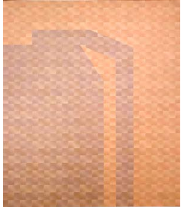
Barbro Östlihn, Wall with Shadow , 1978 © Barbro Östlihn