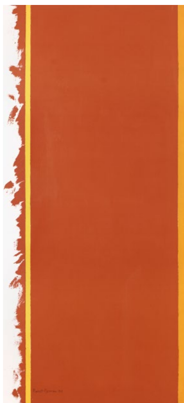
Barnett Newman, Tertia , 1964 © Barnett Newman/Bildupphovsrätt 2016. Foto: Prallan Allsten/Moderna Museet

Genom reproduktion kan livsformer föra sin arvs massa vidare. En stark drift till reproduktion hos många livsformer säkrar deras överlevnad. Människan har länge fantiserat om att skapa liv bortom den egna biologiska reproduktionsförmågan. Många tror att vetenskapen inom kort kan skapa icke organiskt liv. Det är en möjlighet som både skrämmer och lockar. Kanske har man då öppnat dörren mot möjligheten att skapa evigt liv.