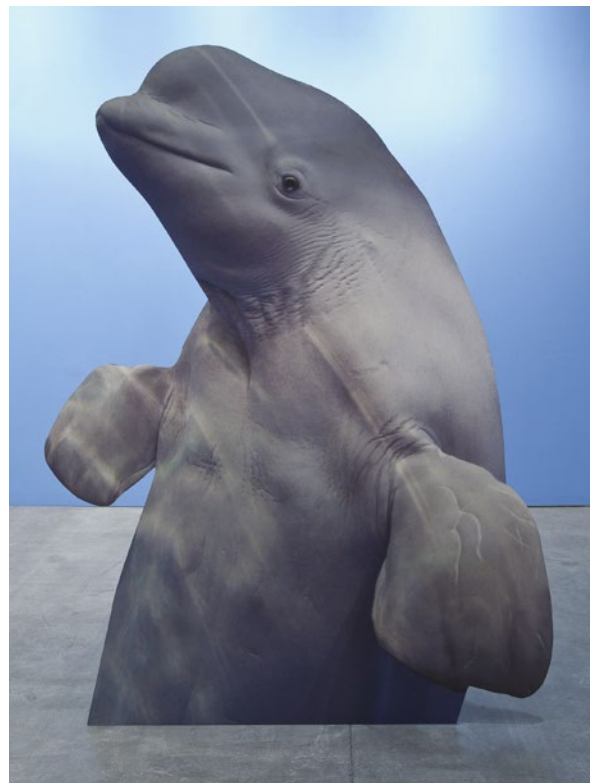
Katja Novitskova, Approximation III , 2013 © Katja Novitskova. Courtesy Kraupa-Tuskany Zeidler, Berlin

SYFTE: Att öva sig i att analysera bilder och utveckla förståelse för vissa ord och begrepp som kan användas för att kunna samtala om bilder. Att lyssna till och respektera andras åsikter och tankar.