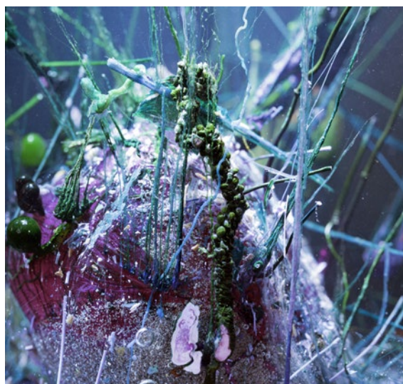
Hicham Berrada, Varsel, skiva , 2007–2016

SYFTE: Att skapa bilder i olika och oväntade material. Att studera biologiska processer.