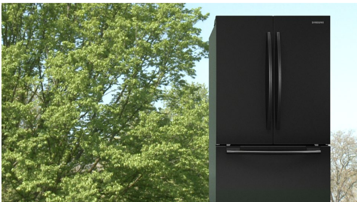
Mark Leckey, GreenScreenRefrigeratorAction , 2010

Texterna nedan erbjuder ett antal perspektiv utifrån vilka man kan betrakta frågan om livets natur. Den beskriver också sex vanliga egenskaper som kännetecknar organiskt liv.