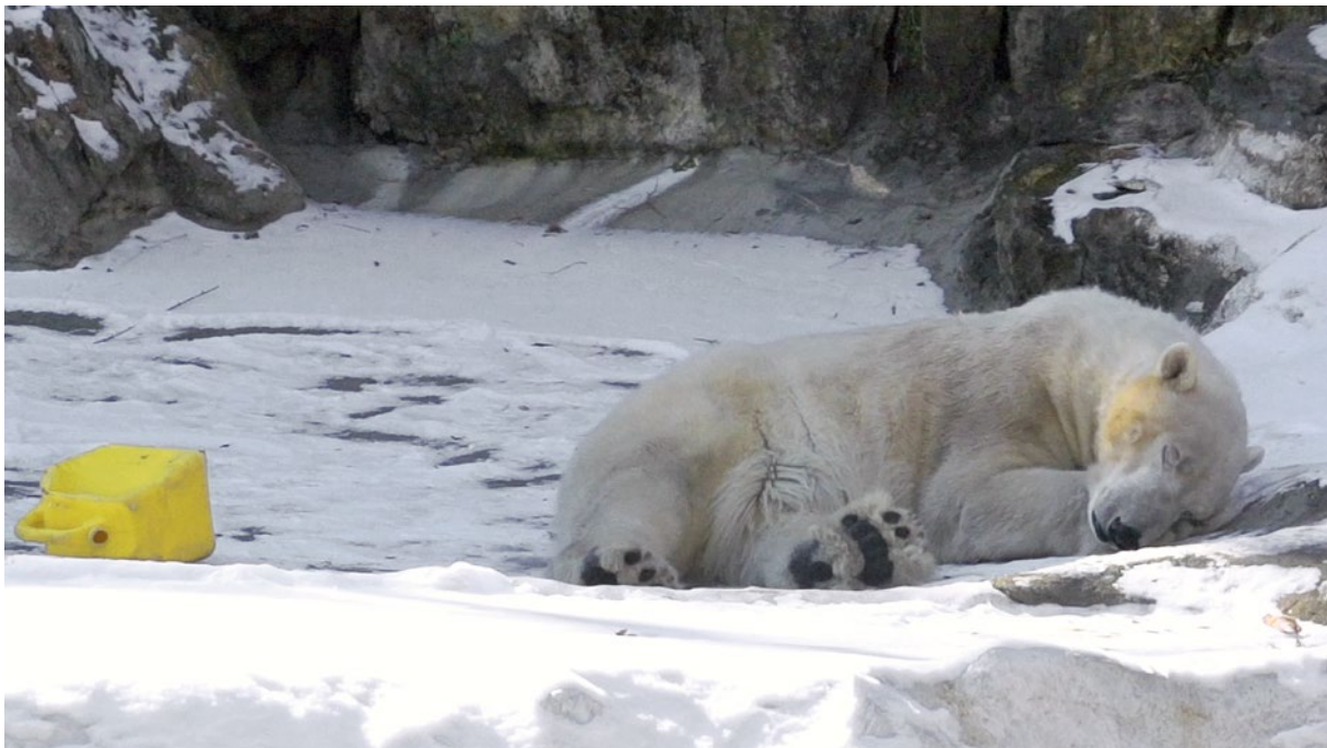
Rachel Rose, Sitting Feeding Sleeping , 2013 (film still)

Något som utmärker liv är dess förmåga till förnyelse av den egna materian. Utan återväxt av celler dör till slut allt organiskt liv. Vad händer med livet när kroppen dör, när de funktioner vi förknippar med liv avtar och slutligen upphör? Människan har i alla tider funderat över detta. I Paul Theks (1933–1988) teknologiska relikier ställs grundläggande frågor om livets essens utifrån den katolska traditionens syn på liv och död. I Rachel Roses Sitting Feeding Sleeping (2013) skildras hur så kallad kryoteknik används för att frysa ner kroppar i hopp om att vetenskapen i framtiden skall hitta nyckeln till evigt liv.