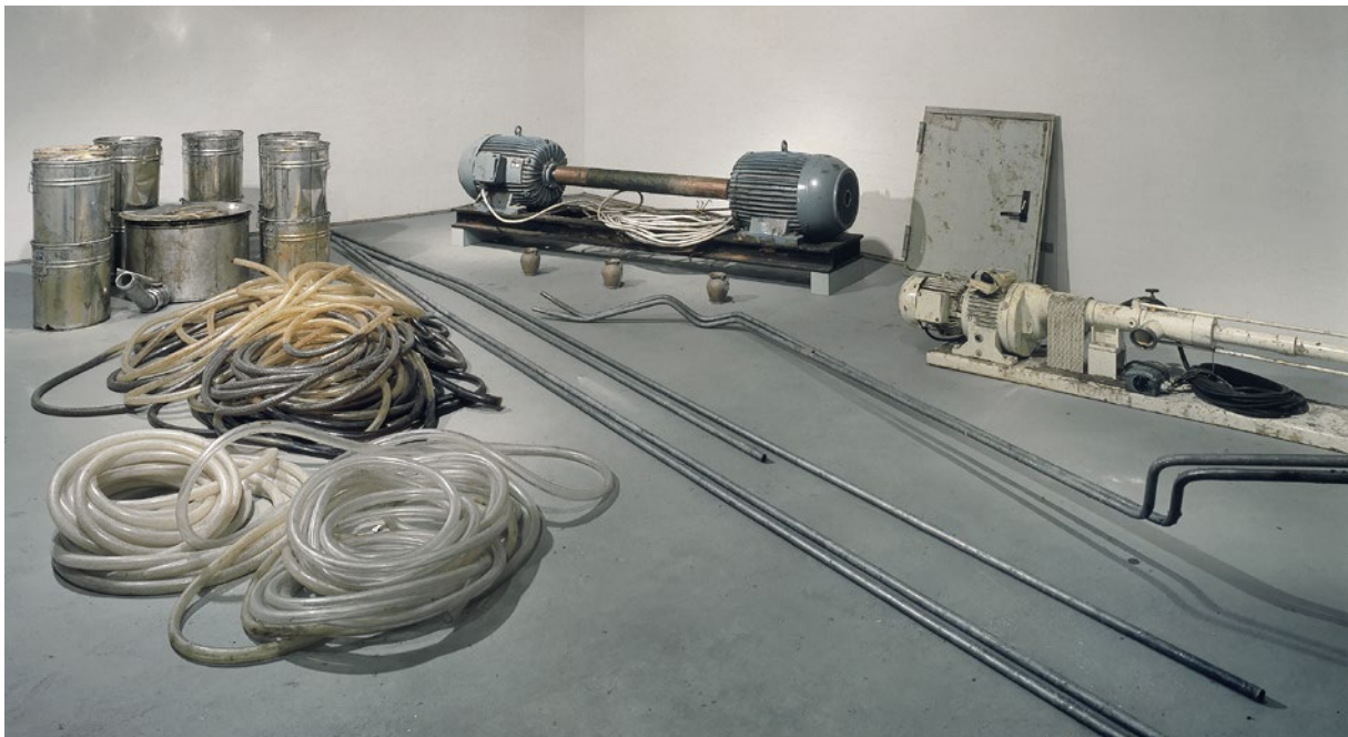
Joseph Beuys, Honungspump på arbetsplatsen , 1974–1977