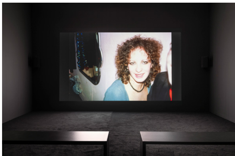
Nan Goldin, installation view from Memory Lost 1982, 2019–2021

Goldin fortsätter att föra en kamp mot stigmat kring drogberoende. P.A.I.N. inriktar sig nu på att arbeta med stöd till olika organisationer som ägnar sig åt skademinskning i syfte att hålla drog-användande människor vid liv.