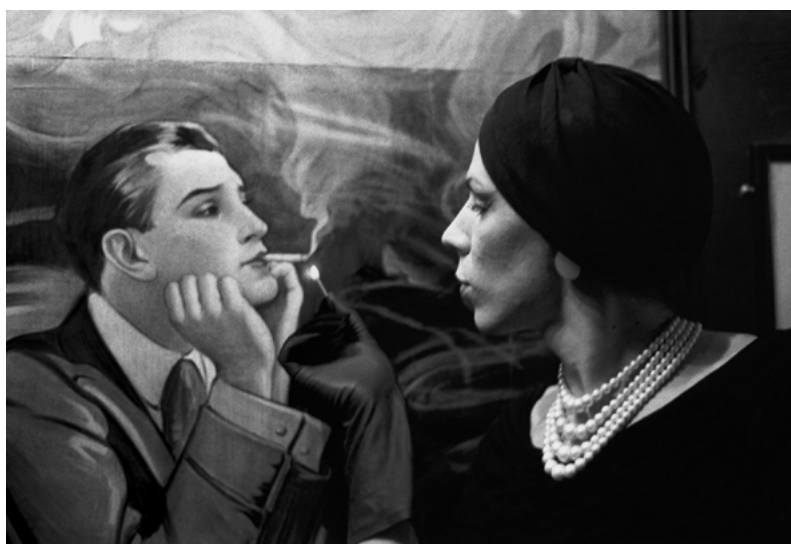
Nan Goldin, Christmas at The Other Side , Boston, 1972

Medan hon gick på konstskolan saknade hon tillgång till ett mörkrum där hon kunde framkalla och kopiera bilder, så hon började använda diabilder för att presentera sitt arbete. Snart kom hon att ägna sig åt bildspelet som konstform. Fotografierna från åren med dragartisterna i Boston blev senare till en bok och ett bildspel med titeln The Other Side (1992–2021).