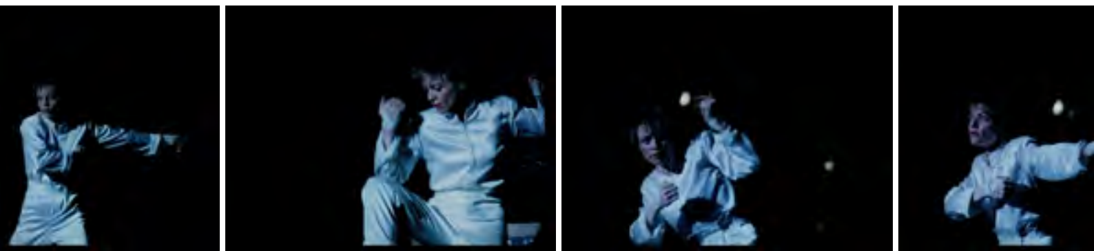
Laurie Anderson, Drum Dance, ur Heart of the Brave, 1986

SYFTE: Att öva på rytmisk och melodisk improvisation med röst, rörelse och instrument med utgångspunkt i musikaliska byggstenar.